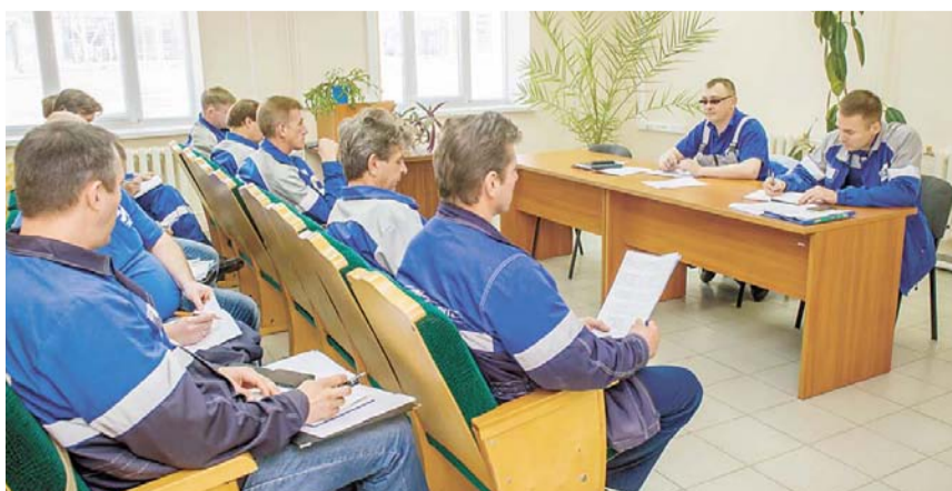
Оперативное совещание по срокам проведения ремонта на заводе