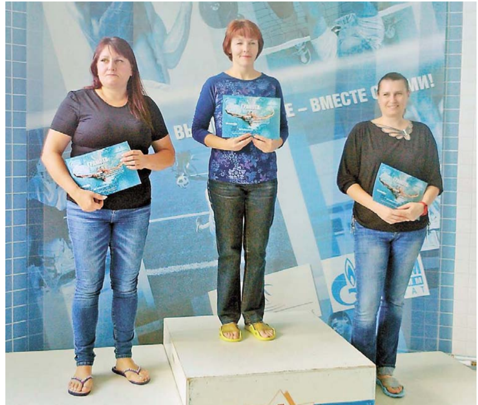
Тройка призеров в заплыве среди женщин 45-55 лет