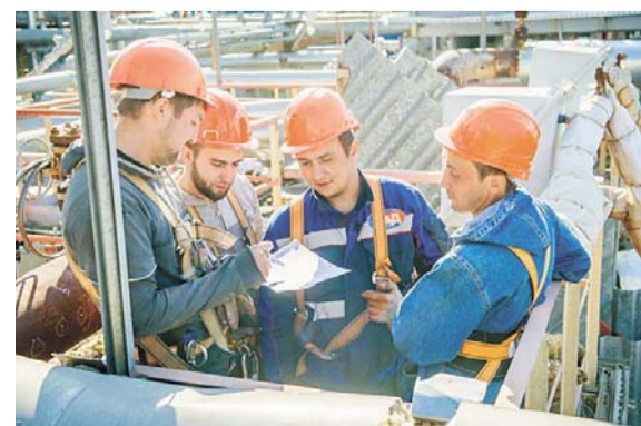
Бригада подрядной организации ООО «РегионСтройТеплоМонтаж» обсуждает схему зачистки участков трубопроводов для проведения ультразвуковой толщинометрии на установке ГО-2