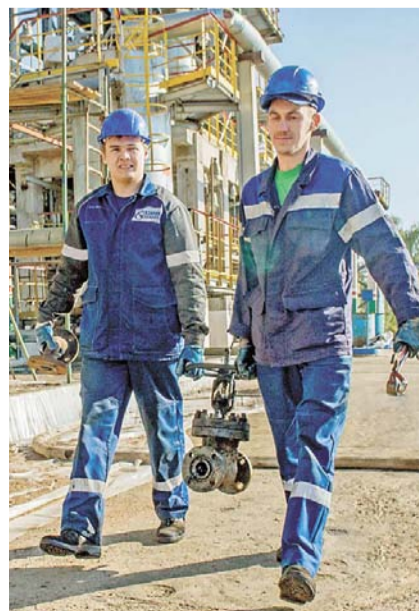
Подготовка арматуры к сдаче на ревизию