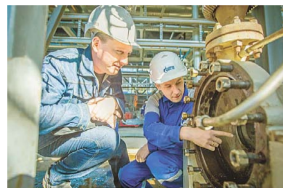
Осмотр внутренней поверхности насоса на установке ЭЛОУ АВТ-6