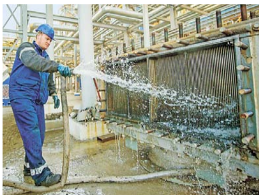
На ЭЛОУ АВТ-6 производится мойка внутренних поверхностей пластинчатых теплообменников

– Мы хотим посмотреть аппараты изнутри, внутренние устройства, тем более что установка висбрекинга ра-