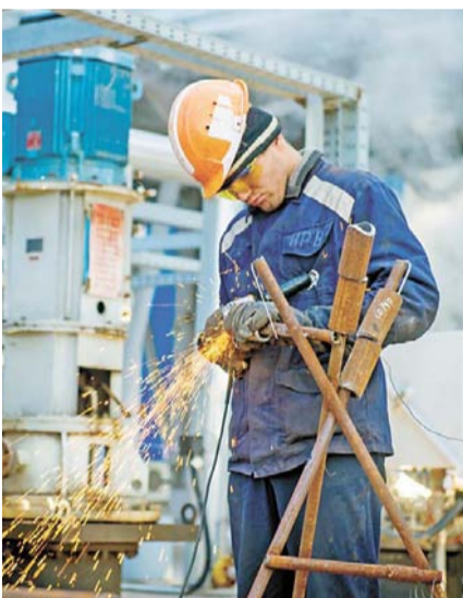
На технологических трубопроводах установки ЭЛОУ АВТ-6 выполняются подготовительные работы по акту отбраковки

проверяют во время опытного пробега, который начнется сразу же после ввода установки в эксплуатацию.