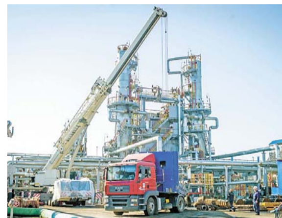
На установке ГО-2 разбирается теплообменное оборудование

Исторически сложившаяся структура ремонтов в компании предполагала ежегодную остановку производств, хотя правила промышленной безопасности в большинстве случаев допускали двухлетнюю периодичность освидетельствования. Для того чтобы прийти к такой периодичности, мы изменили подход к химико-технологической защите оборудования, где-то полностью заменим реагенты, дозировку, а в некоторых случаях внедрим мероприятия, направленные на снижение рисков аварийной остановки, усилим контроль эффективности работы.