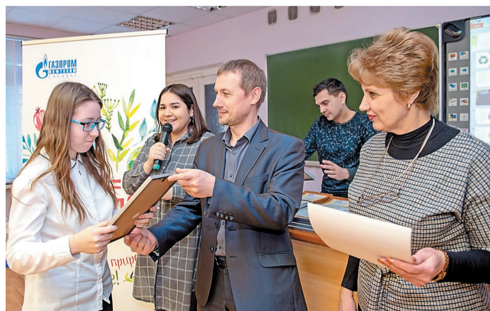
Выпускникам экошколы от компании «Газпром нефтехим Салават» были вручены похвальные листы, фирменные футболки и браслеты проекта

Детская экошкола была организована компанией «Газпром нефтехим Салават» совместно с Салаватским филиалом Уфимского государственного нефтяного технического университета в рамках социального проекта «Ты + Я = Земля». В 2017 году этот проект на корпоративном конкурсе ПАО «Газпром» победил в номинации «Лучший проект, посвященный Году экологии».