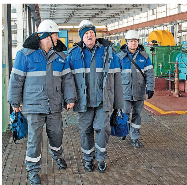
Для ветеранов провели экскурсию по всей территории цеха