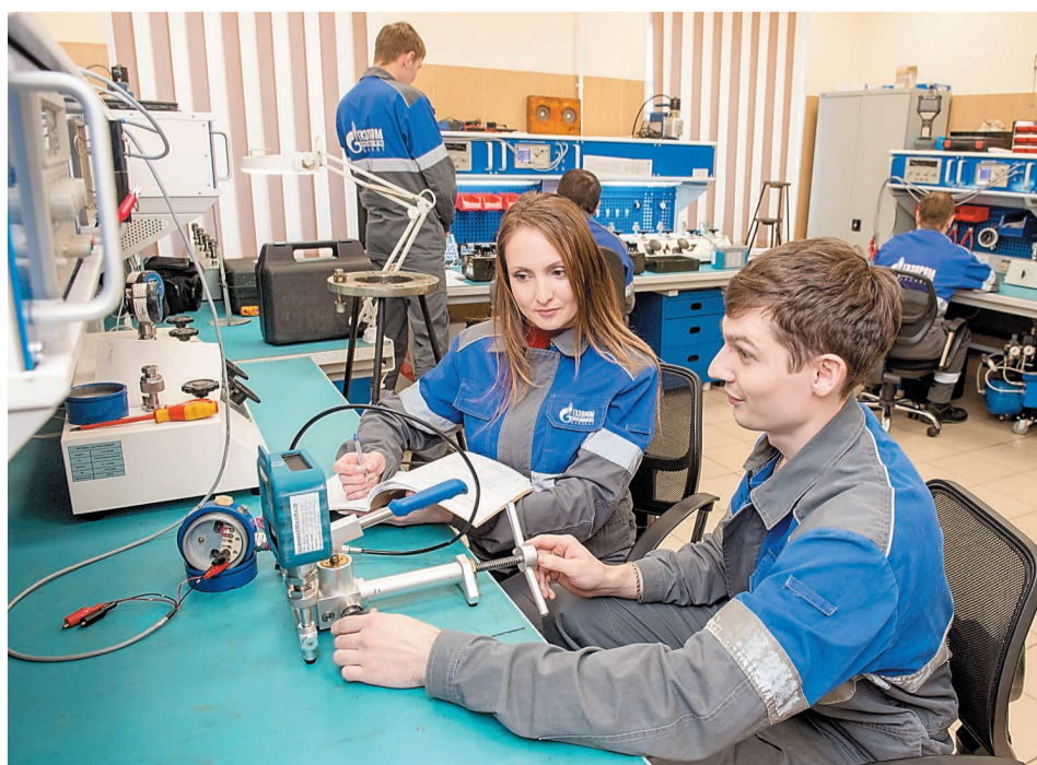
Калибровка электронного преобразователя давления в лаборатории цеха ремонта КИПиА

«В своей работе четко следуем стратегическим планам, отвечая вызовам текущего времени и перспективам развития».