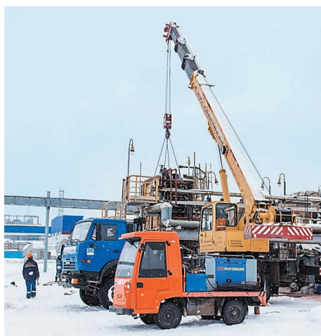
Демонтаж змеевиков печи дожига ПД-1

Ремонт на установке битума начался 11 января 2020 года и продлится до 5 февраля. Наряду со стандартными работами предусмотрена ревизия внутренних устройств, чистка печи дожига и замена верхнего уровня АСУТП.