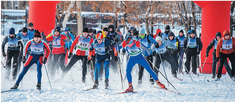
1700 спортсменов-любителей приняли участие в XII Комплексной спартакиаде

Накануне нового года в спортивно-концертном комплексе «Салават» прошло награждение победителей XII комплексной спартакиады ООО «Газпром нефтехим Салават». В этом году команда «Управление» показала свое преимущество уже после экватора спартакиады. Завершила все состязания с рекордной для спартакиады суммой – 16 очков.