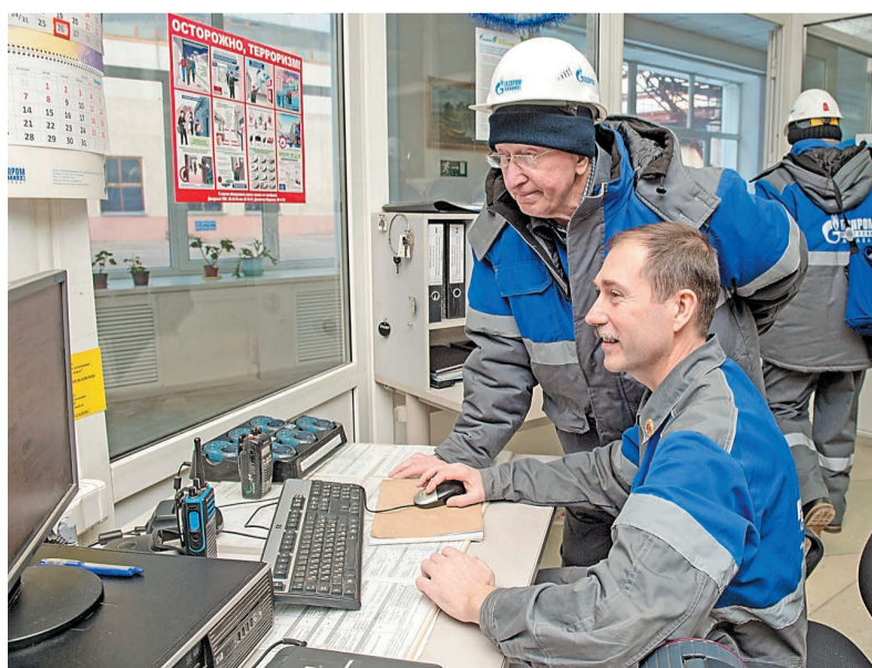
Интересно, как там сейчас управляется процесс?