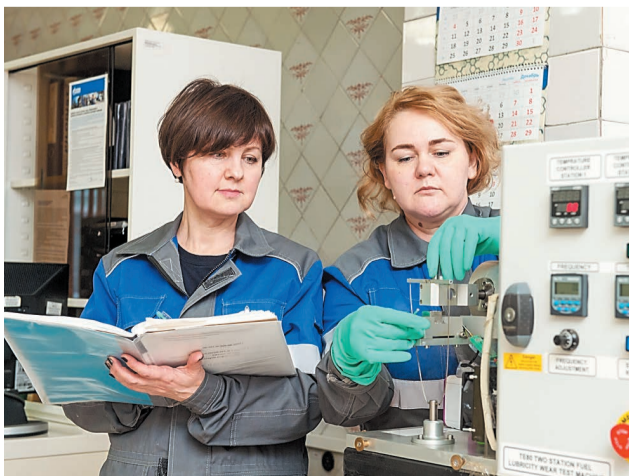
Более 170 методов испытаний нефтехимической продукции применяют в лаборатории ЛАУ

В Лабораторно-аналитическом управлении ООО «Газпром нефтехим Салават» аккредитована и успешно функционирует испытательная лаборатория. Она внесена в Единый реестр органов по оценке соответствия Евразийского экономического союза и имеет право проводить испытания продукции на соответствие требованиям технических регламентов Таможенного союза.