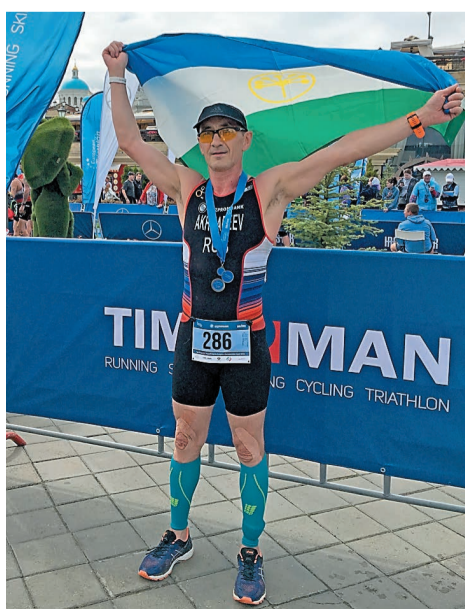
Казань, 2019 год, Чемпионат Европы по триатлону

Начались тренировки в зале, по выходным он стал бегать по улицам города. Установил в телефоне счетчик калорий, начал записывать и контролировать свой вес.