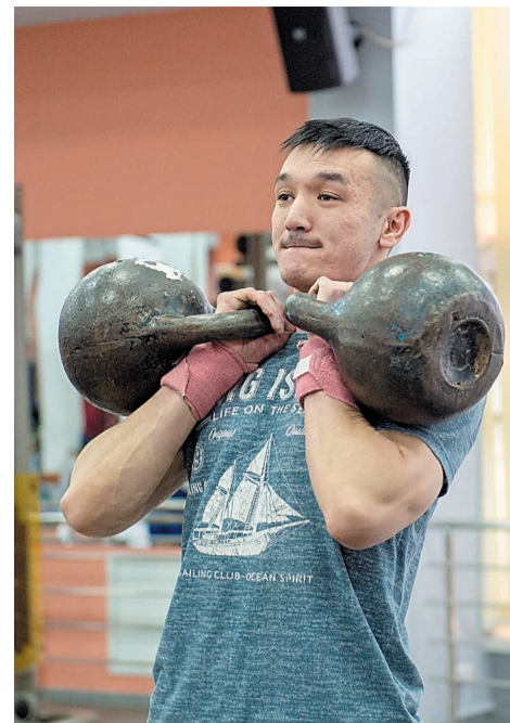
За звание сильнейшего пришлось серьезно потрудиться