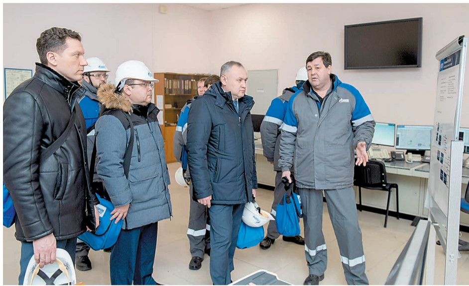
Во время экскурсии первым пунктом посещения стала установка ЭЛОУ АВТ-6

Следующими пунктами посещения стали производство полиэтилена низкого давления и этилен-пропиленовое производство завода «Мономер». На производстве ЭП-355 выпускают этилен и пропилен – востребованное сырье в процессах получения нефтехимической продукции. Они используются как для собственных нужд компании в качестве сырья для производства акриловой кислоты, полипропилена, полиэтилена, так и на промышленных предприятиях республики и страны. В результате модернизации мощность увеличена до 355 тысяч тонн этилена и около 160 тысяч тонн пропилена в год.