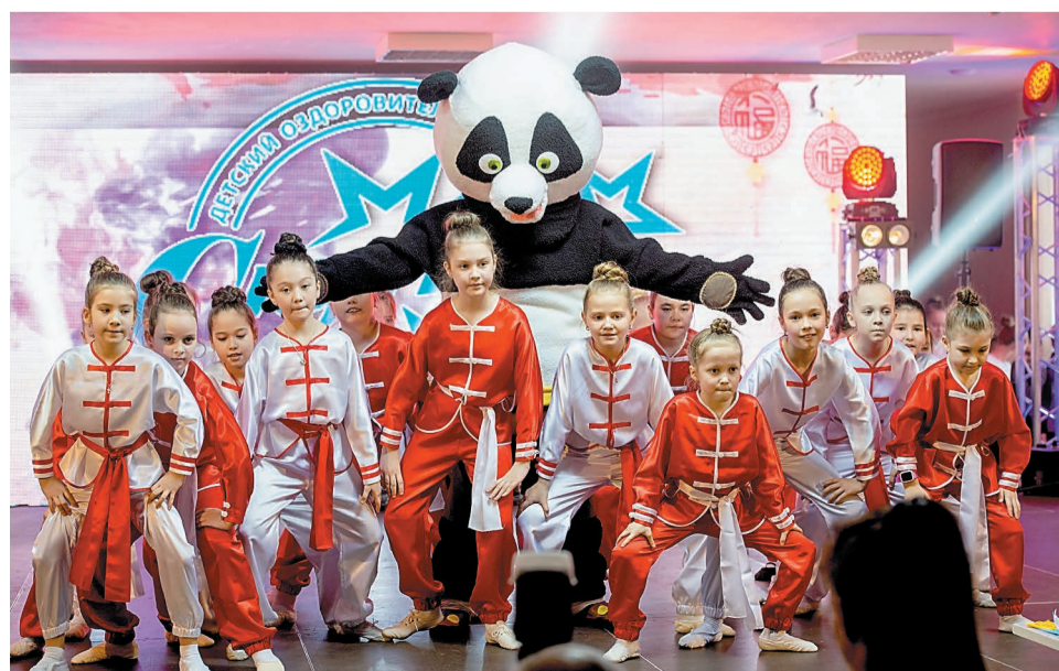
На сцене танцоры детской хореографической школы «Дружба.RU»