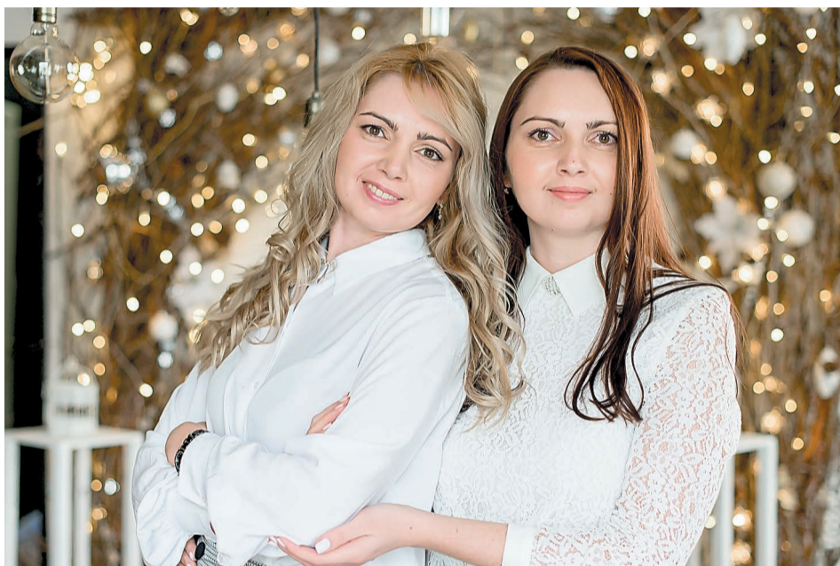
В преддверии 8 Марта сестры желают коллегам здоровья, женского счастья, больше улыбок и доброжелательных людей вокруг

– Со стороны может показаться, что налоговый кодекс – это слишком сложно и скучно, но наша работа охватывает все сферы деятельности Общества, операции бывают разнообразными, с различными активами и обязательствами. И потом, с