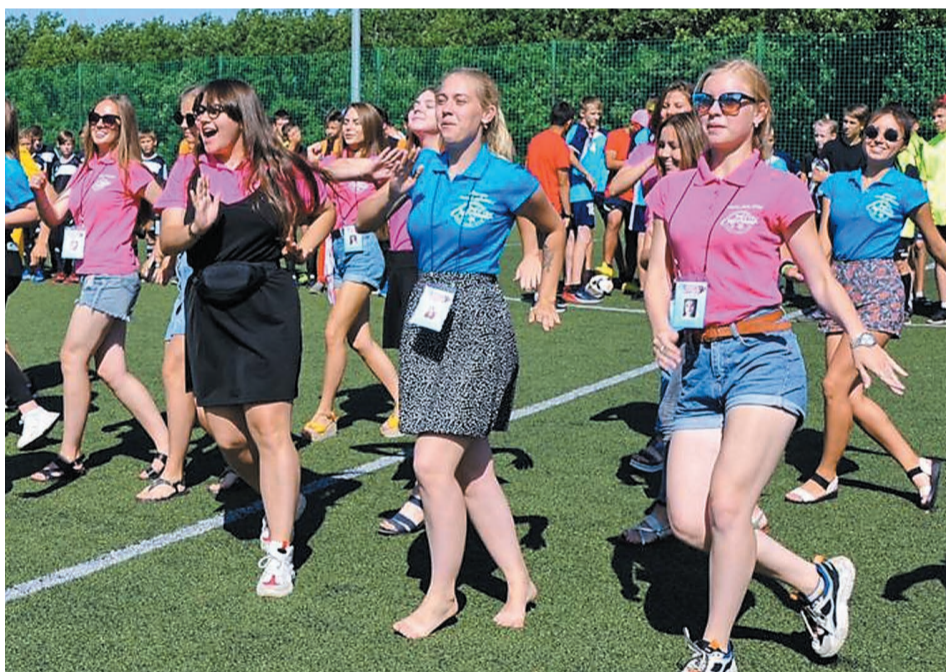
В 2019 году «Спутник» установил новый рекорд: было принято 386 резюме и обучение в академии прошли 240 человек

Второй этап – это прием резюме. Основные требования для будущих вожатых – возраст от 18 лет, спортивный об-