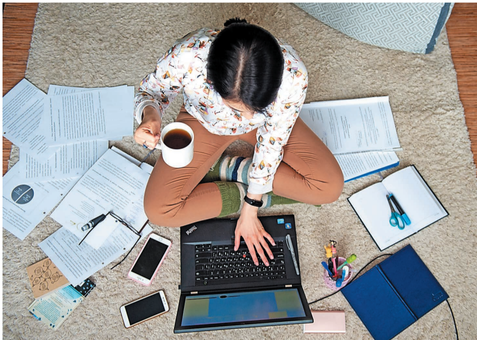
Сам факт нахождения в офисе настраивает на работу. На «удаленке» приходится изобретать собственный ритуал

Специалисты отмечают, организовать дома на «удаленке» труднее, хотя бы пото-