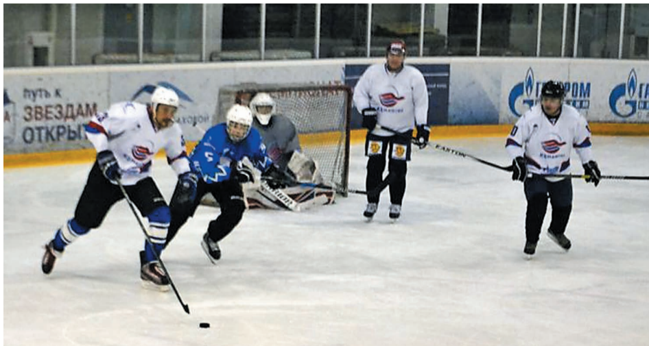
Из-за коронавируса финальные игры перенесены на неопределенный срок