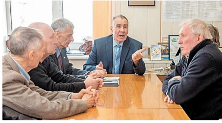
С 26 марта по 15 апреля члены Совета ветеранов отправлены на карантин

Люди «серебряного возраста» (старше 60 лет) – в группе особого риска. Именно у пожилых из-за нагрузки на иммунную систему возможны осложнения, в том числе такие опасные, как вирусная пневмония. Эти осложнения могут привести к самым печальным исходам.