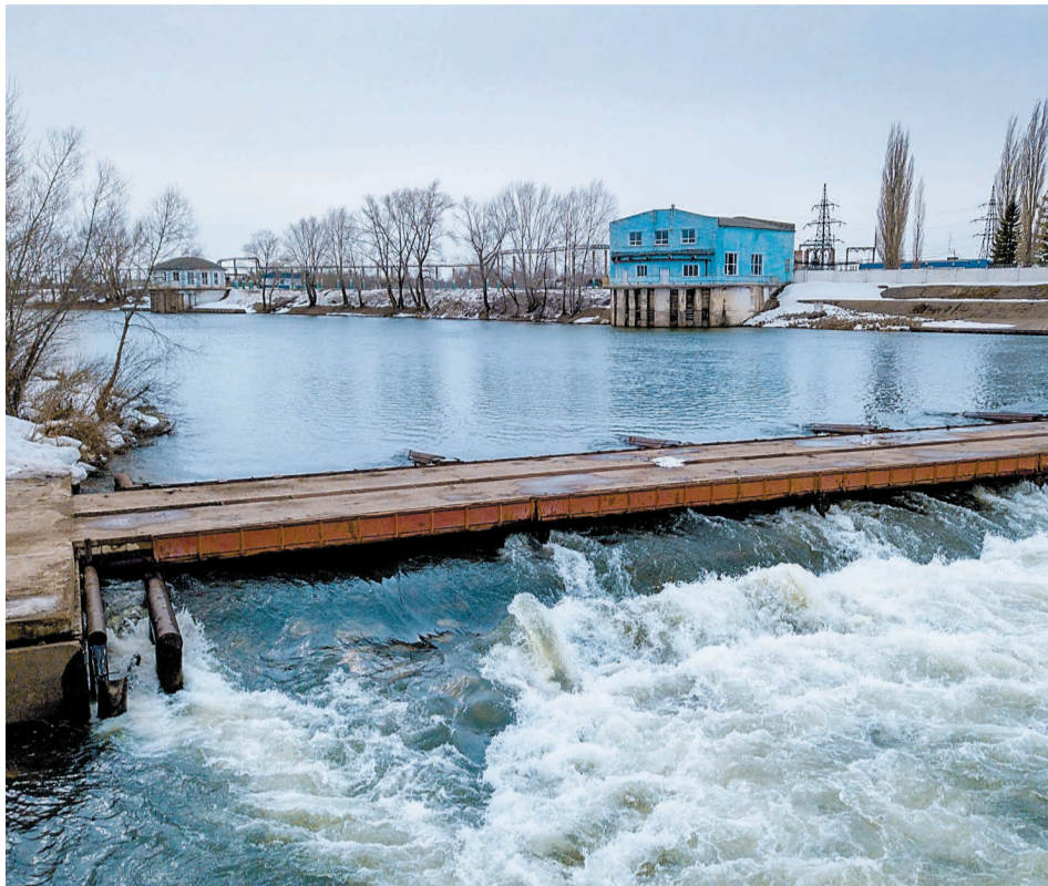
Береговой водозабор речной воды принимает весенние паводки с 1954 года. Надежность работы обеспечивается слаженной работой всех производственных звеньев ООО «ПромВодоКанал»

Как отмечают гидрологи республики, запасов воды в водоемах в норме, но осеннее увлажнение почвы в поймах рек на 50-60 % больше средних значений. При этом эксперты пока не дают точный прогноз по срокам и объемам предстоящего паводка. Для недопущения чрезвычайных ситуаций, связанных с весенней водой, приказом по Обществу была создана противопаводковая комиссия и инициирована работа, в которой задействованы все заводы, управления и службы. Прежде всего, был организован целевой инструктаж для персонала, связанного с подготовкой и проведением работ в период паводка. В целях исключения аварийных ситуаций, нарушений правил по охране труда и промышленной безопасности акцент был сделан на важ-