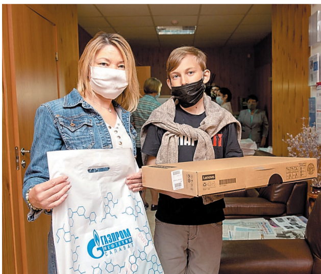
Врученные ноутбуки помогут детям из многодетных семей обучаться дистанционно

Компания «Газпром нефтехим Салават» подарила салаватским школьникам ноутбуки для дистанционного обучения.