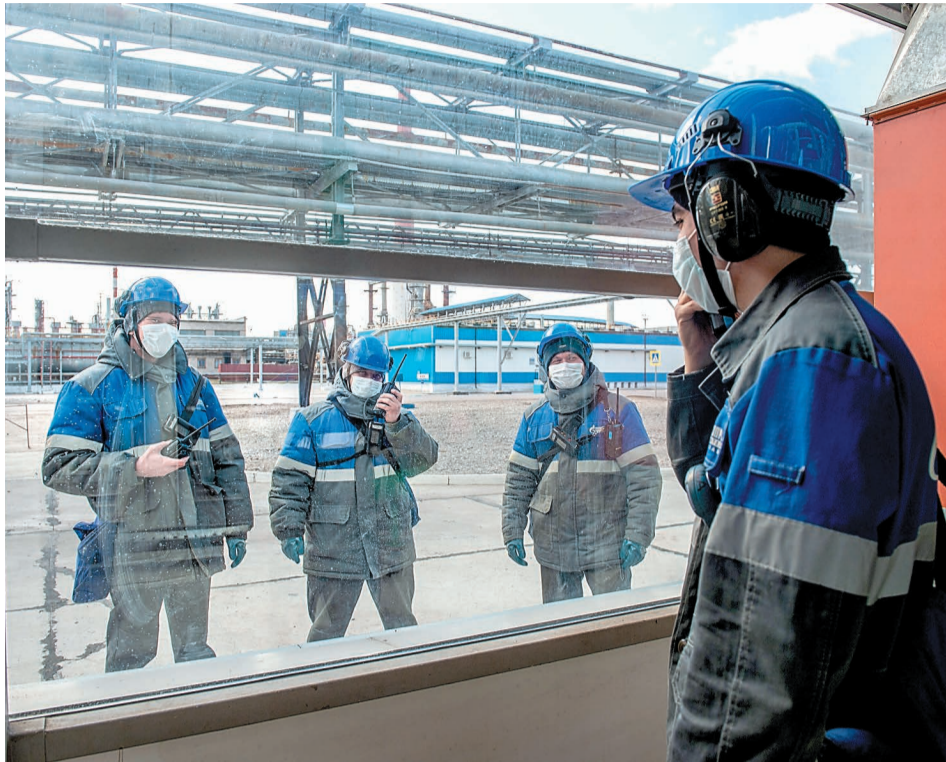
Бесконтактный прием и сдача смены технологическим персоналом установок