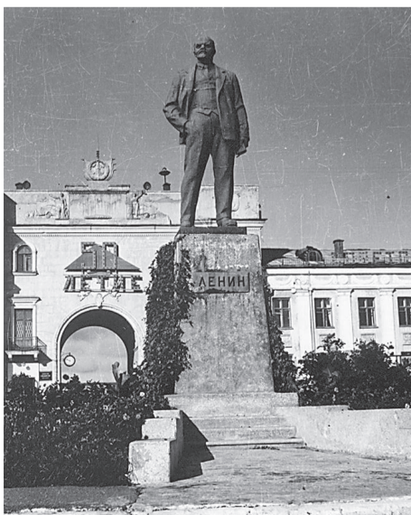
Управление комбината № 18 в 1967 году

– Да, всего на четыре года младше! (улыбается). Поэтому я многие события