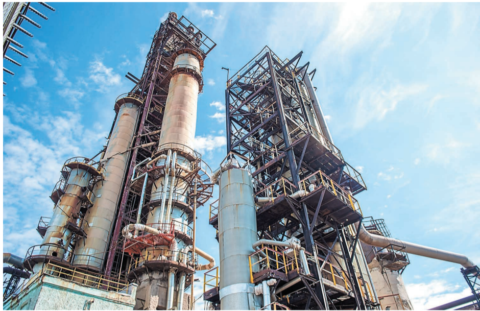
Цех № 10 после ремонта выведен на технологический режим

Осуществлен ремонт насосно-компрессорного оборудования цеха. Проведен ремонт пневмотранспорта в связи с тем, что процесс каталитического крекинга на