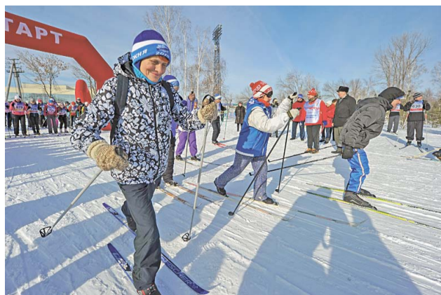
Оптимизму и бодрому настрою ветеранов мог позавидовать каждый