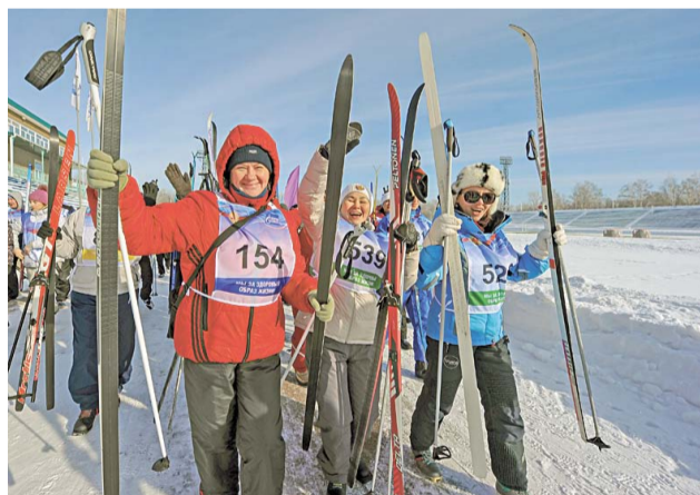
Участники фестиваля признались, что получили большое удовольствие от праздника. Дети смогли порезвиться на свежем воздухе, взрослые – пообщаться в неформальной обстановке