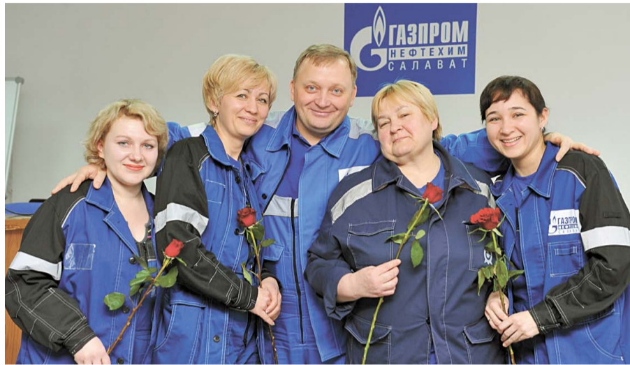
Дружный коллектив цеха № 47

Весенние цветы, «Танго любви» и галантные кавалеры – производственные будни иногда могут быть полны сюрпризов. Мужчины компании «Газпром нефтехим Салават» умеют исполнять самые романтические желания. Именно так поступили накануне 8 Марта сотрудники Пресс-центра, которые решили поздравить работниц предприятия.