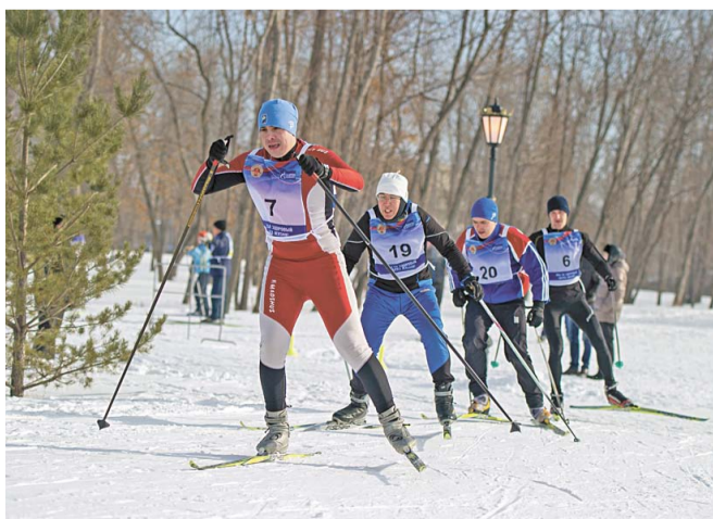
Сотрудники ООО «Салаватспортсервис» заранее подготовили трассу для лыжного забега