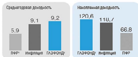
Показатели доходности за период 2005 – 2013 гг., %

1 Доходность от инвестирования средств пенсионных накоплений, начисленных ПФР застрахованным лицам в соответствии с Приказом Минфина РФ от 18.11.2005 №140н.