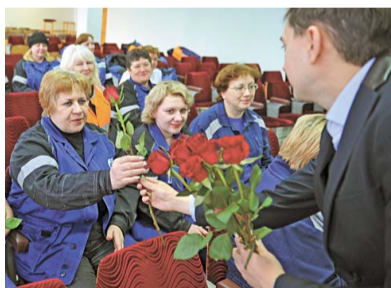
В цехе № 47

– Дорогие женщины! Поздравляю с Женским днем. В этот день желаю прежде всего здоровья и семейного уюта. Вдохновляйте нас! Будьте всегда счастливыми, оставайтесь всегда такими же нежными, добрыми и ласковыми.