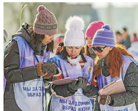
Организаторы признались, что не ожидали такой активности от участников

В рамках зимнего фестиваля «Добавь здоровья!» прошли также состязания VIII комплексной спартакиады среди производственных коллективов и подразделений ОАО «Газпром нефтехим Салават». В командном зачете лучшие результаты показал коллектив Ново-Салаватской ТЭЦ, второе и третье места с разницей в одно очко разделили между собой ОАО «Салаватнефтехимремстрой» и Управления Общества.