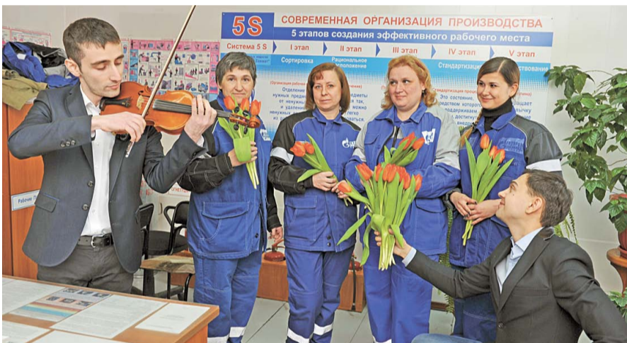
Коллектив цеха № 14

Глаза милых дам блестели, улыбки становились ярче. Вот и пришла весна!