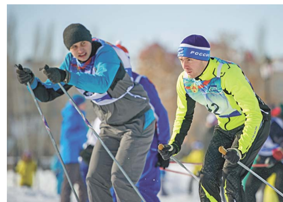
Многие спортсмены-любители финишировали с разницей в доли секунды