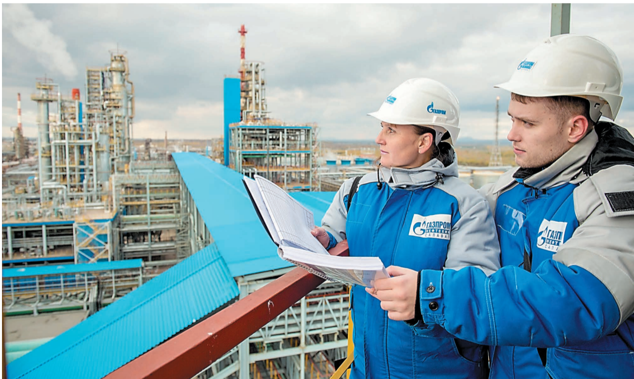
Каждодневные задачи технического отдела касаются всех сторон жизни предприятия

тельного сертификата соответствия на горшки детские туалетные без крышки из полистирола по ГОСТ Р 50962-96 на соответствие требованиям Технического регламента Таможенного союза ТР ТС 007/2011 «О безопасности продукции, предназначенной для детей и подростков». У прежнего документа истек срок действия, нужно получить новый.