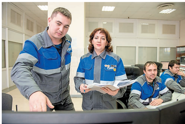
Сотрудники УГТ занимаются стратегией развития компании

В настоящий момент работаем над получением обяза-