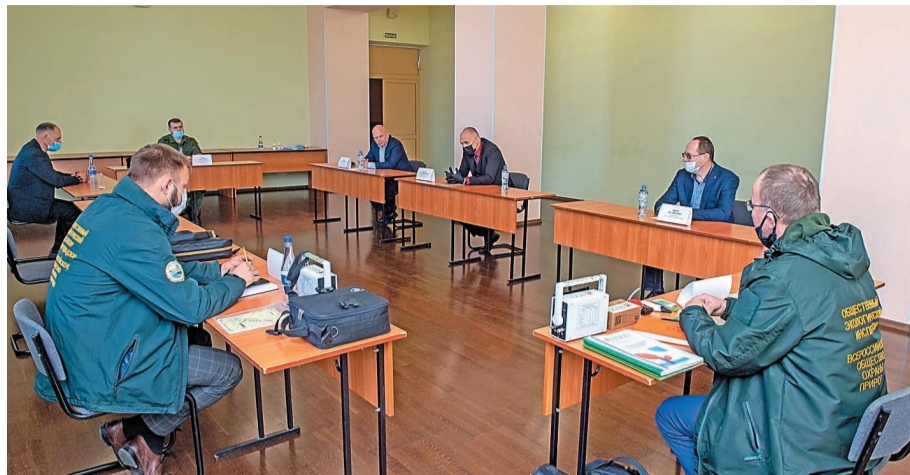
Встреча по экологии проходила в новом, дистанционном формате