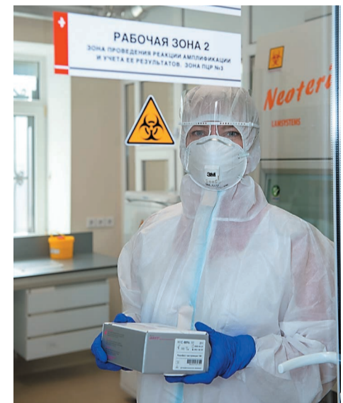
Сдать тест на коронавирус можно в медсанчасти