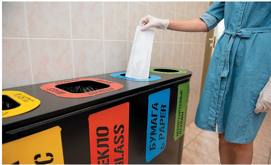
На объектах компании установлены контейнеры для раздельного накопления пластика, стекла, бумаги и несортируемых отходов

✓ Третье правило: после приема пищи необходимо обязательно сполоснуть пластиковую и стеклянную тару от пищевых отходов. В контейнер необходимо выбрасывать только пустые и чистые емкости без пробок и крышек.