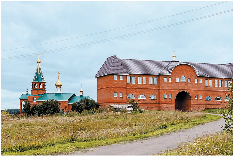
В селе Скворчиха во имя блаженной Варвары Скворчихинской построен Свято-Варваринский женский монастырь

Группа ветеранов УВК и ОСВ посетила Варварин родник, что находится близ села Скворчиха Ишимбайского района. Поездка была организована с соблюдением всех правил профилактики коронавирусной инфекции.