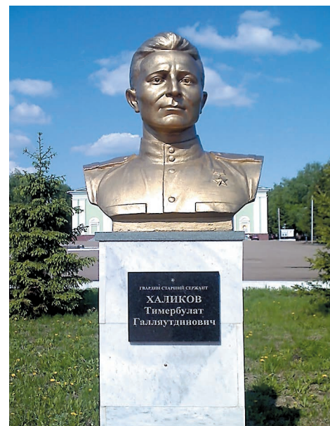
На мемориале «Вечный огонь» в г. Ишимбае