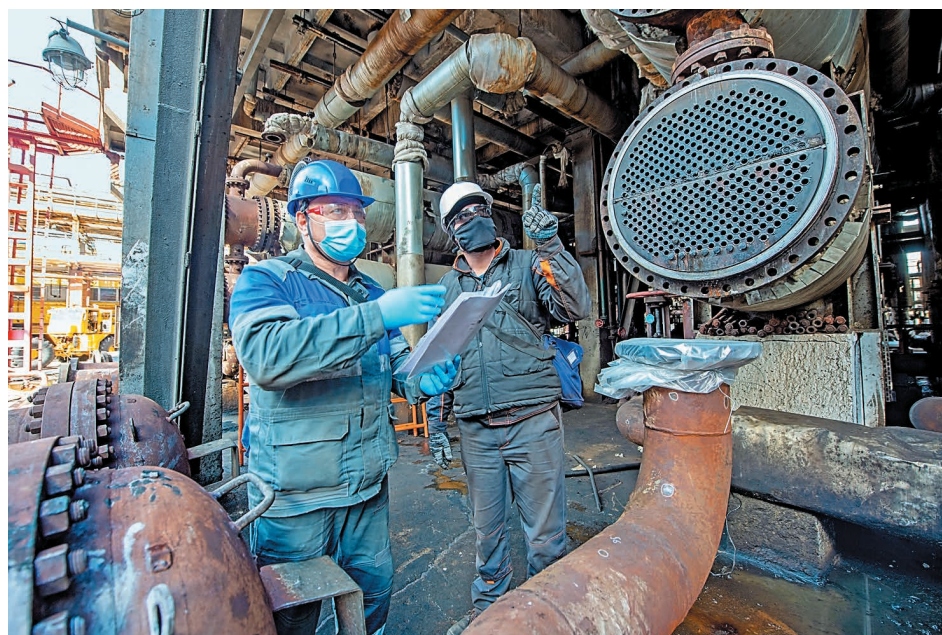
Сборка теплообменника поз. Т-120 установки ЭЛОУ АВТ-4

– В процессе капитального ремонта очень строго соблюдались меры безопасности по недопущению заражения коронавирусной инфекцией. Подрядчики и сотрудники компании работали в масках, перчатках, очках и на отдалении друг от друга. Во избежание пересечения технологического и ремонтного персонала были созданы отдельные зоны для