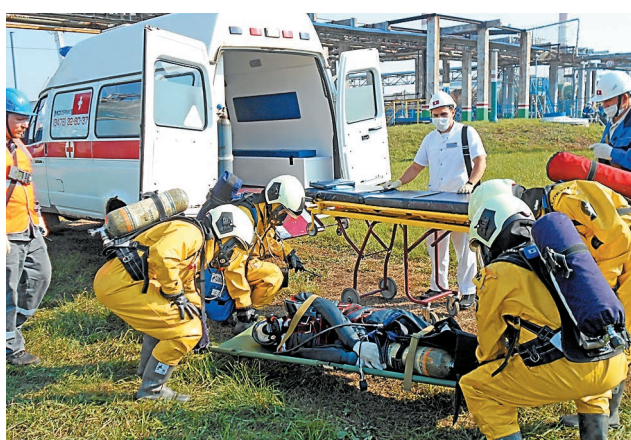
Во время командно-штабной тренировки

Сотрудники «Газпром нефтехим Салават» приняли участие во Всероссийской штабной тренировке по гражданской обороне.