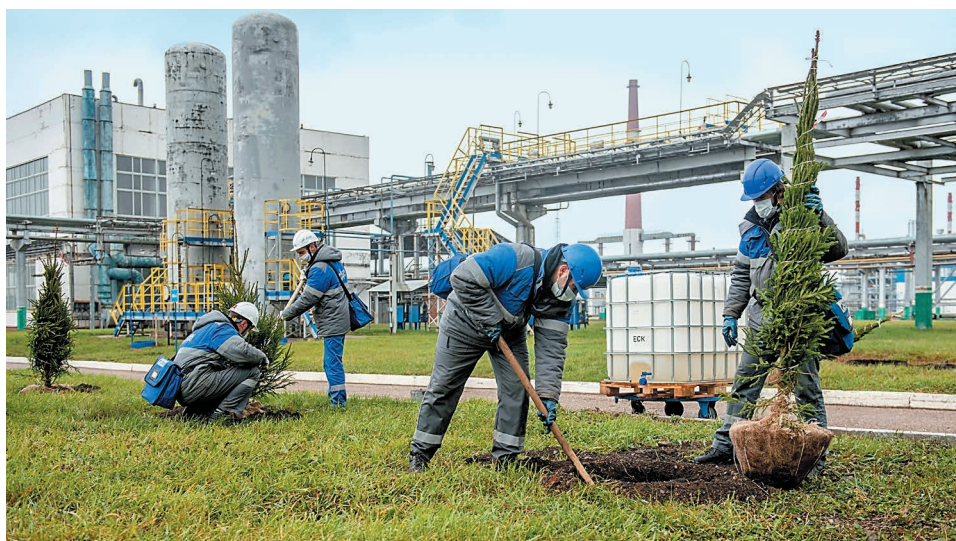
Новые деревца появились и на промышленной площадке