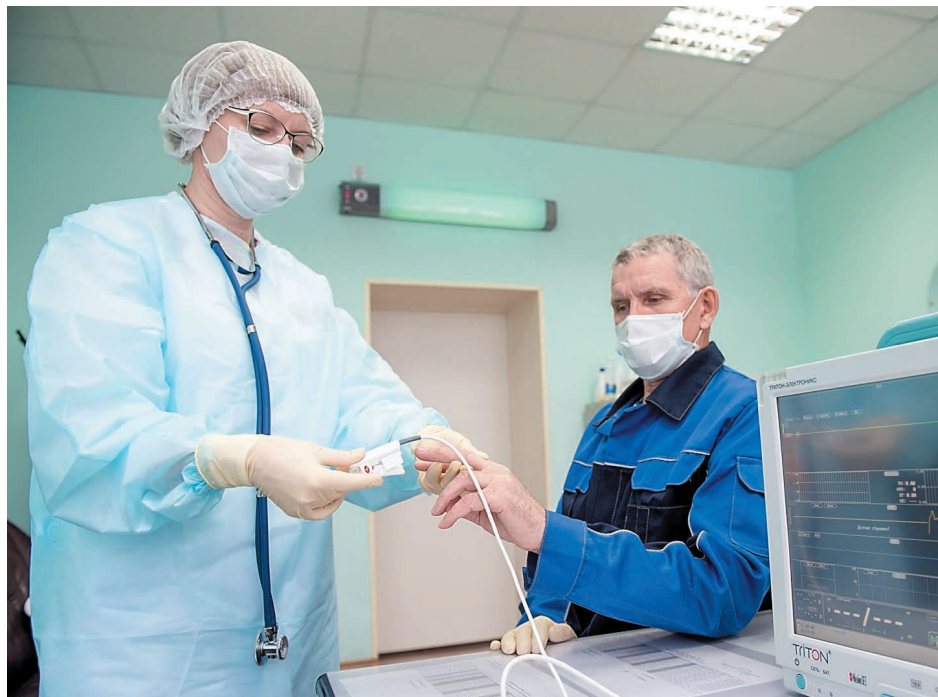
Неотложную помощь в здравпункте оказывают всем работникам компании и дочерних организаций

Вновь пациент, жалобы на остеохондроз. Осмотр, выдача болеутоляющего средства, дается направление на прием к врачу в поликлинику.