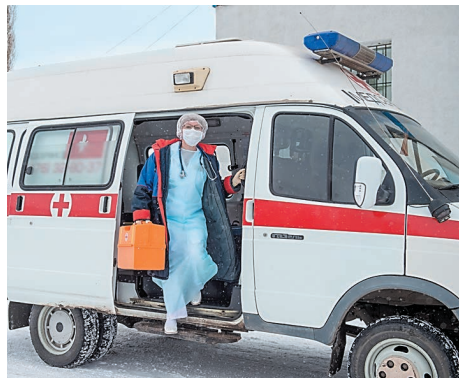
На вызов фельдшер выезжает во всеоружии

Нефтехимики продолжают подходить на экспресс-тестирование. Раздаются звонки: заболел зуб, стреляет ухо... Фельдшеры дают советы, приглашают подойти на место. Обращаются два пациента из одного подразделения. У одного давление за 200 единиц, у второго температура за 38 градусов. Немедленная доставка пациентов в поликлинику. Увозят. Вновь уборка, дезинфекция и смена защитного костюма. Подходят новые пациенты на процедуры и вакцинацию.