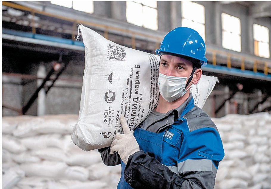
На газохимическом заводе в среднем в сутки вырабатывается 2010 тонн карбамида

Пословица «Готовь сани летом, а телегу – зимой» актуальна, если речь идет об обеспеченности аграриев минеральными удобрениями. Удобрения незаменимы для получения высокого урожая сельскохозяйственных культур и для предотвращения истощения почвы. Их вносят преимущественно весной, а вот об их наличии нужно позаботиться заранее.