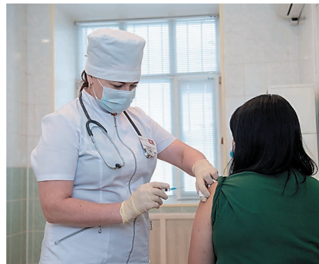
В октябре прививки от гриппа делали по 150 человек в день

В медицинском центре «Медсервис» завершается сезонная вакцинация против гриппа препаратом «Совигрипп». Это отечественная противогриппозная вакцина, в состав которой входят компоненты поверхностной оболочки вирусов гриппа различных штаммов. Вакцинация проводится на здравпункте № 1 в пн-пт с 09.00 до 16.00 или в прививочном каб. № 119 (поликлиника, 1 этаж) в пн, вт, чт, пт с 08.00 до 16.00, в ср – с 10.00 до 18.00.