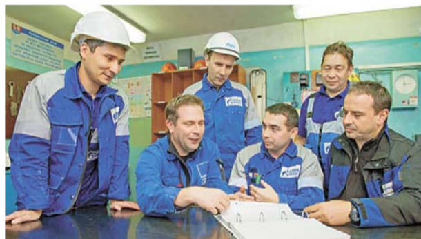
Сотрудники немецкой компании (на снимке крайние среди сидящих за столом) отметили, что им легко работало со специалистами цеха № 24

Н а производстве карбамида насос 12-1 занимает одну из важнейших позиций в технологической цепочке. Он перекачивает поступающее сырье – аммиак – в колонну синтеза, где происходит процесс синтеза карбамида из аммиака и диоксида углерода. Работавший до этого аммиачный насос чехословацкой фирмы «Сигма» эксплуатировался в цехе № 24 более пятидесяти лет – с момента пуска