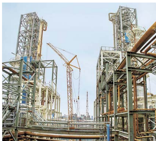
Стройка на установке изомеризации кипит

Оппозитный компрессор с цилиндрами двойного действия установлен на строящемся объекте. Оборудование будет служить для перекачки водородсодержащего газа.