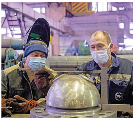
Сварка для компрессора цеха № 51

– К большому счастью, пандемия на нас сильно не повлияла, у нас не было по-настоящему больных. Все серьезные, ответственные люди и понимаем, что если хотя бы кто-то один принесет вирус в рабочий коллектив, то через небольшой срок заболеют все коллеги. Таким образом, работать и зарабатывать прибыль будет некому. Поэтому при первых признаках простуды, кашля, температуре работники уходили на больничные или самоизоляцию. Лечились, после чего возвращались в коллектив. Таким образом, переболели многие, но коллектив остался работоспособным. Надеюсь, что тенденция сохранится.