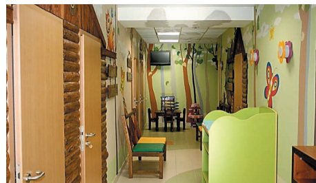
В отделении педиатрии ООО «Медсервис»