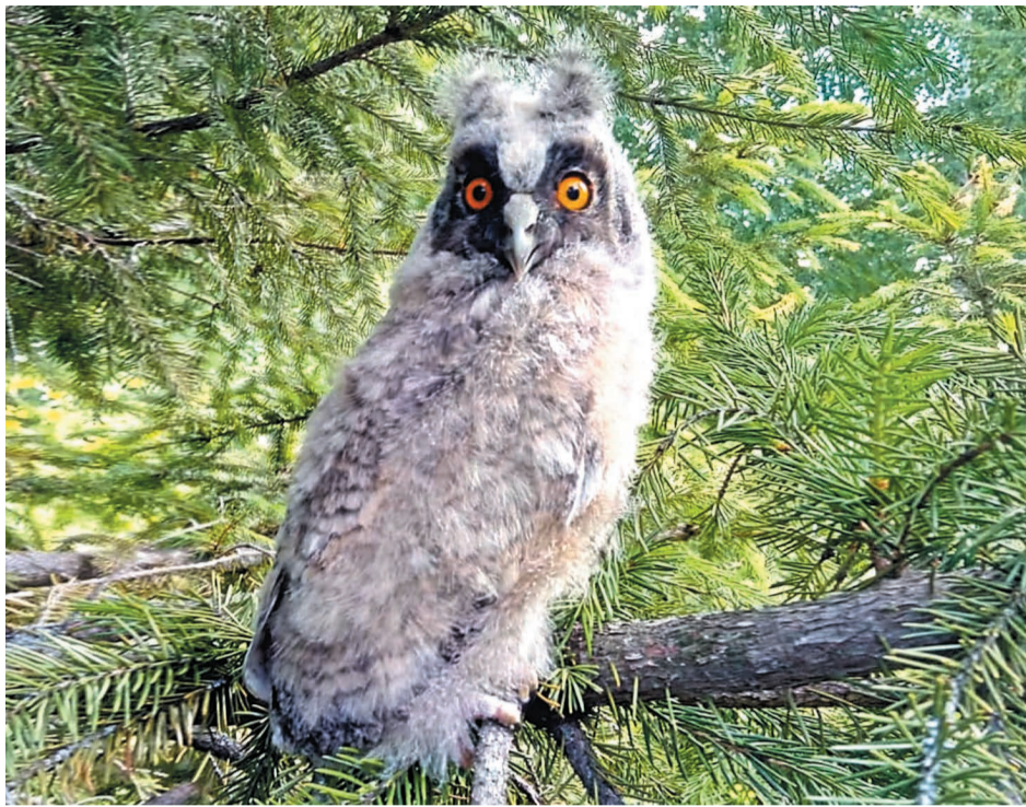
Эту лесную красавицу удалось не только сфотографировать, но и даже погладить