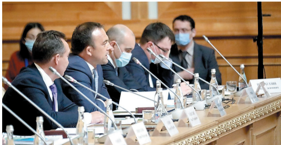
Во время заседания Клуба активных инвесторов «Алга, Башкортостан!»

С 8 по 11 декабря в Уфе прошла Международная неделя бизнеса – 2020, которая объединила спикеров из разных стран и несколько тысяч онлайн-участников. В рамках форума в уфимском Конгресс-холле «Торатау» состоялось заседание Клуба активных инвесторов «Алга, Башкортостан!».