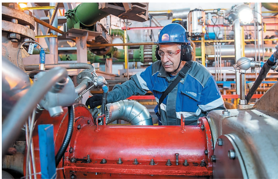
На установке ГО-4 цеха № 11 нефтеперерабатывающего завода

Первый этап фиксированного пробега по увеличению загрузки блока проводился с 1 ноября 2019 по 1 февраля 2020 года. Блок был загружен дополнительно сырьем с ГО-3 на 12 т/ч, при этом загрузка блока увеличилась с 246 т/ч до 258 т/ч. Цель была достигнута 266,169 т/ч. Однако при дальнейшей загрузке блока температура верха колонны К-4 и температура в емкости Е-6 повысились, дальнейшее увеличение загрузки стало невозможным. Первый этап фиксированного пробега был завершен, блок разгружен до первоначальной загрузки 246 т/ч.