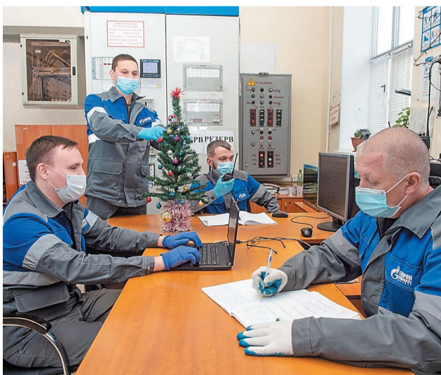
Коллектив установки ОГ и КГ желает, чтобы все забыли про COVID, были здоровы и счастливы