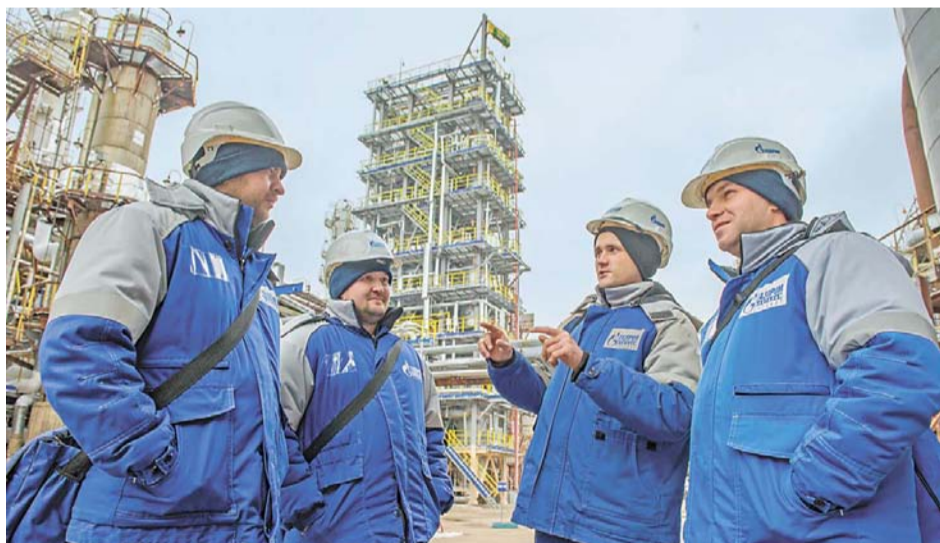
Реакторный блок гидрирования – особая гордость завода «Мономер»