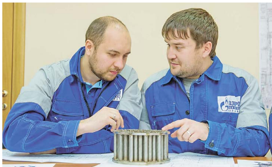
Поиск истины продолжается