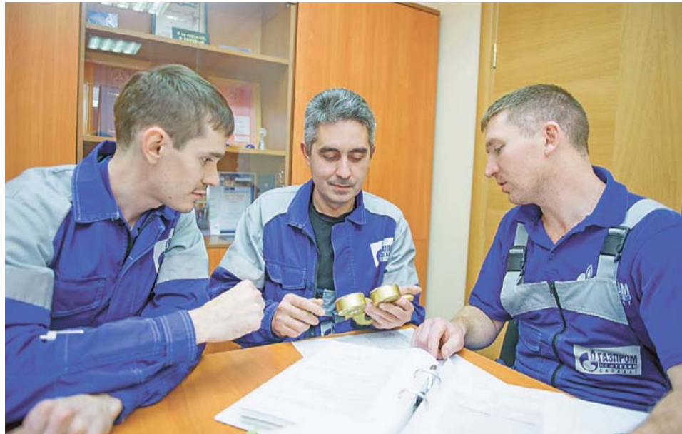
Совет по улучшению технологии