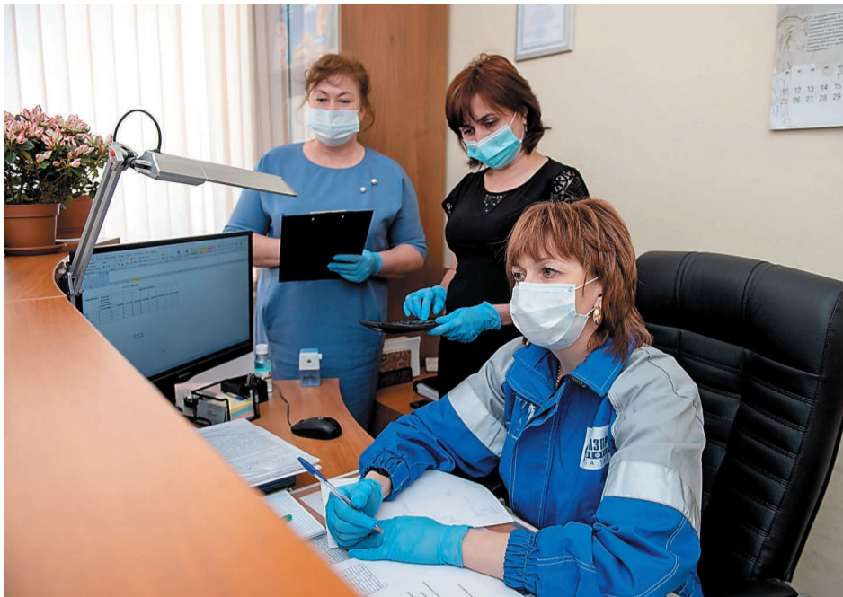
На рабочих местах продолжаем соблюдать все профилактические меры

ровать количество обращений в скорую медицинскую помощь, в лечебные учреждения, вести термометрический контроль, на заводах проводятся проверки установленных требований (законодательных и корпоративных) по предотвращению распространения НКВИ. Продолжаются проверки соблюдения масочно-перчаточного режима на территории и в общественном