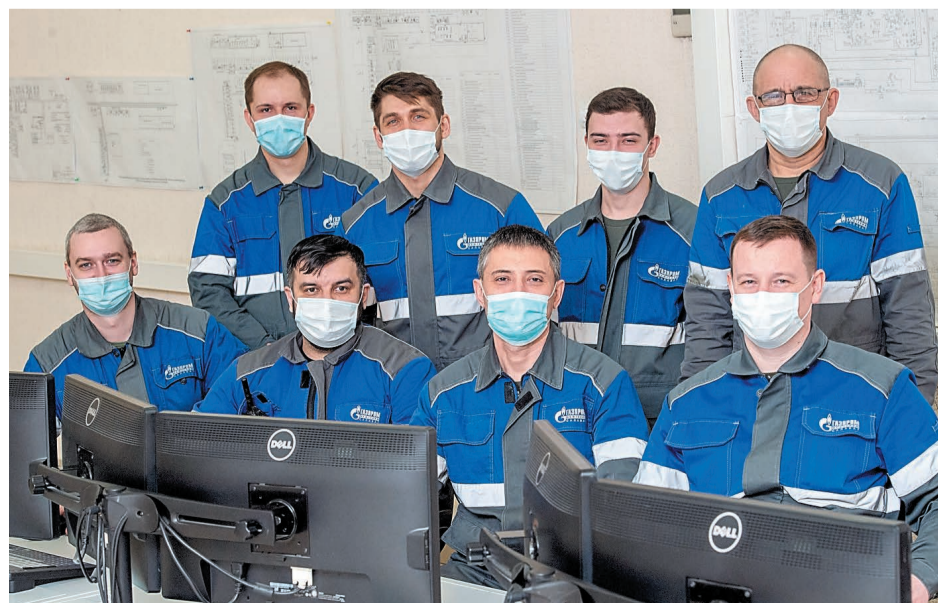
Поддержка и взаимовыручка – отличительные черты бригады № 3

Бригада № 3 динамична, активна и работоспособна в любое время дня и ночи. Коллектив установки работает с самого пуска, знает специфику работы, для них непрерывный производственный процесс всегда стоит на первом месте. Один в поле не воин! – считают в бригаде и всегда