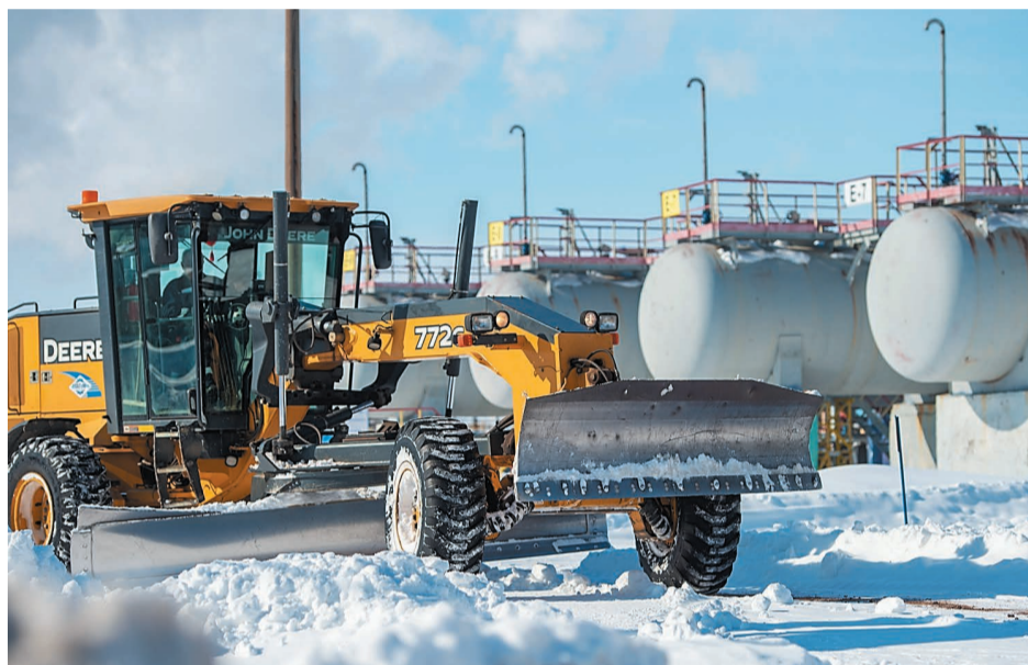
За сутки с территории установки налива автомобильных цистерн было вывезено 39 КамАЗов со снегом

Технологический персонал установки также задействован в борьбе со снегом, при сдаче-приеме смены и через каждые 2 часа 3 товарных оператора и 1 машинист технологических насосов очищают все важные точки: пожарные гидранты, лафетные