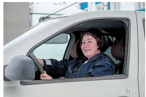
Такси пользуется популярностью у нефтехимиков

Сегодня по территории курсируют 4 автомобиля такси. Водители в основном женщины. Сами дамы объясняют это просто: на территории нужно выдерживать скорость до 30 км/ч, да и ездить приходится по одному и тому же маршруту изо дня в день. Оба эти обстоятельства обычно не по духу мужчинам.