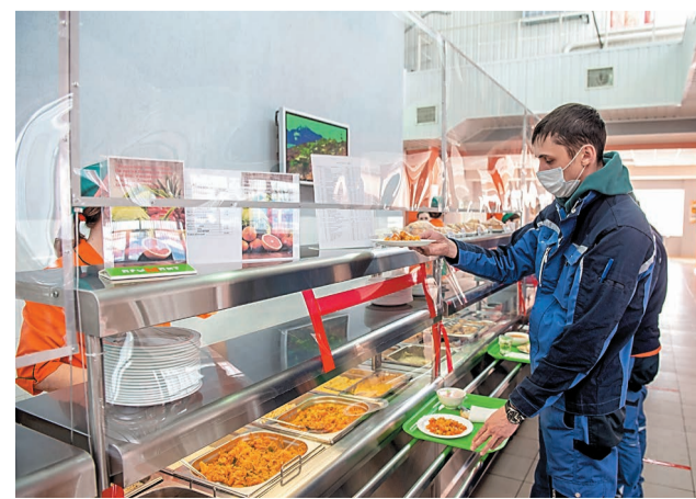
Постные блюда радуют разнообразием