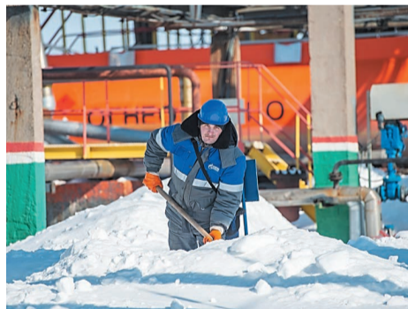
Снегопад всем добавил работы

Технологический персонал установки также задействован в борьбе со снегом, при сдаче-приеме смены и через каждые 2 часа 3 товарных оператора и 1 машинист технологических насосов очищают все важные точки: пожарные гидранты, лафетные