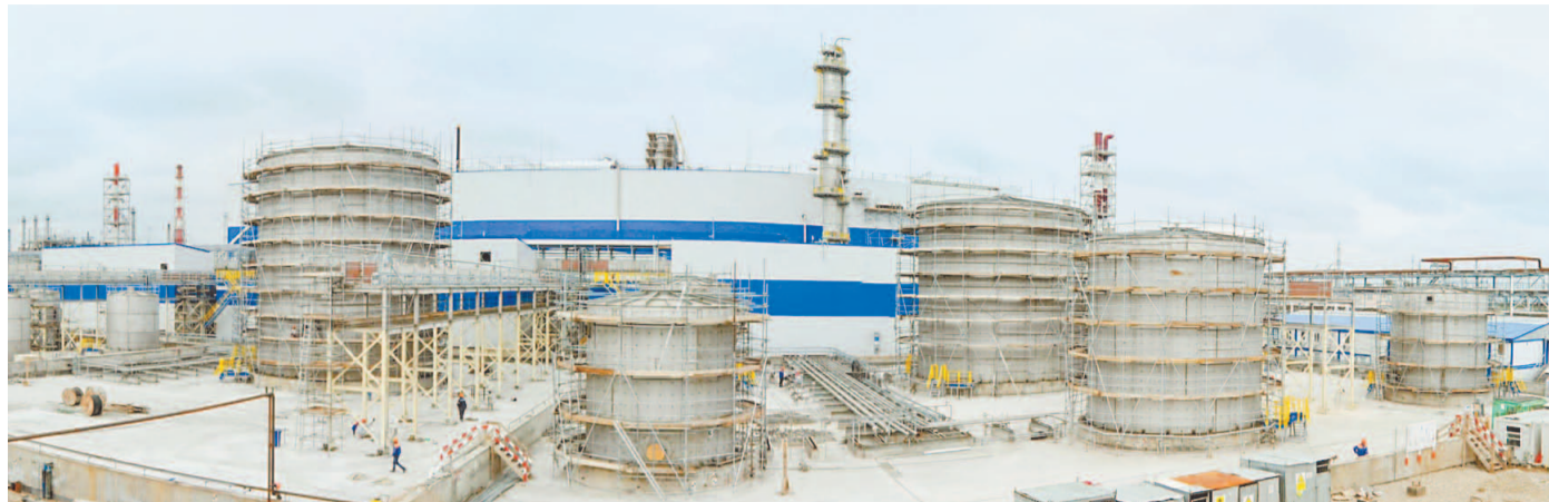
Строительство производства акриловой кислоты завершается, а в это время прорабатываются вопросы сбыта будущей продукции

Строительство завода акриловой кислоты находится в фазе завершения. Параллельно здесь ведутся работы по оформлению документации в европейской системе.