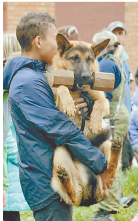
«Хозяин, я подержу гантелю, а ты меня»

– Цифрам пока ее не научили, вот и проскочила табличку с номером снаря-