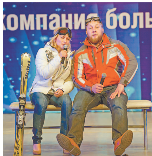
Спортивный нефтехимик, он и в КВНе в образе