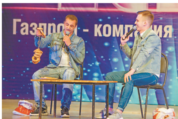
Сборная «Дружбы заводов» – поклонники корпоративного проекта «Баранки»