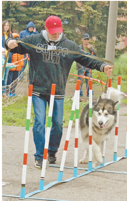
Маламут играючи преодолел все препятствия