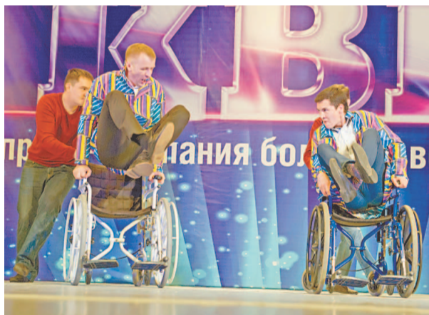
Экстрим от команды «Медсервис»