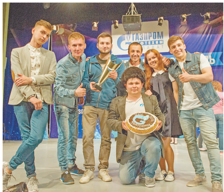
Каждая сборная получила сладкий приз. Торты для фестиваля от ООО «Промышленное питание»