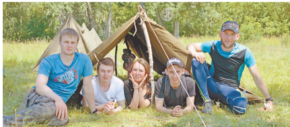
Сотрудники Управления Общества мастерски справились с испытаниями

По сумме двух испытаний победителем второго этапа спортивно-прикладного марафона корпоративного проекта ГТО «Герои нашей компании» стала команда «Управление-1», второе место у участников команды «Управление-2», третье – команды ООО «ПВК».