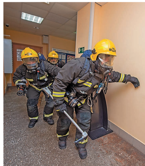
Идет поиск пострадавших в задымленном здании

– В ходе занятий отрабатывались действия дежурной смены аварийных служб по тушению условного пожара со спасе-