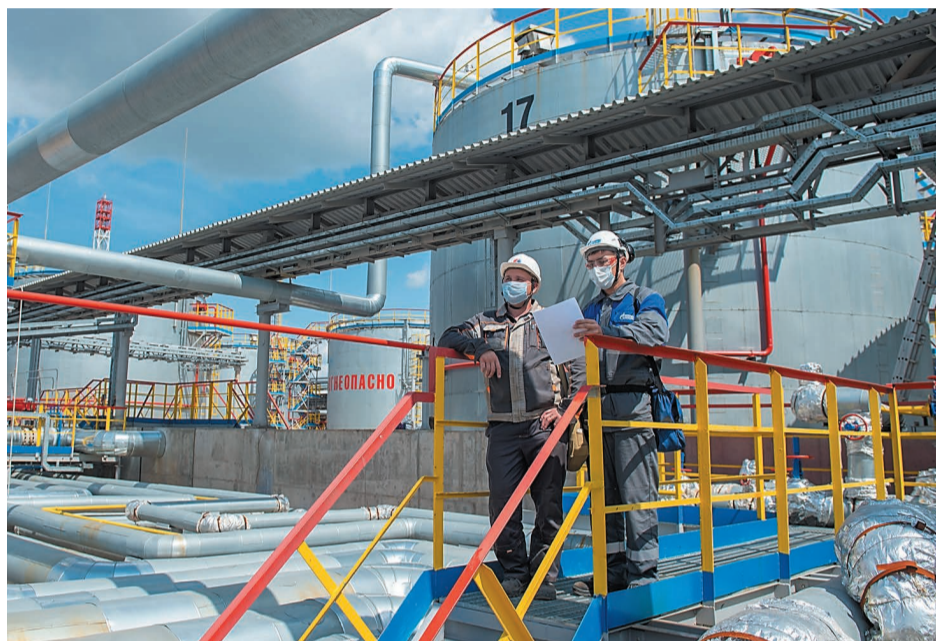
Новые резервуары НПЗ оснащены новейшими приборами автоматики

Во время строительства в парке выполнены работы по обвязке резервуаров и технологических трубопроводов, антикоррозийной защите, устройству обваловки, обвязка насосов. Построена контроллер-