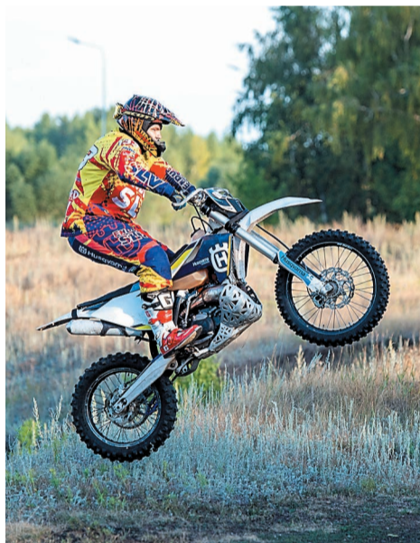
На таком мотоцикле можно тренироваться круглый год