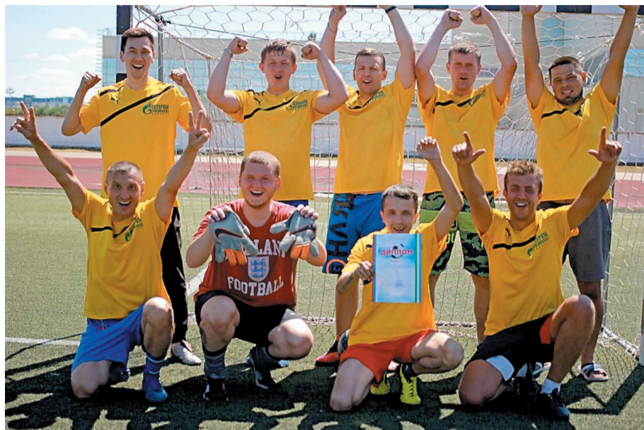
Команда цеха № 9, занявшая второе место, от души радовалась победе