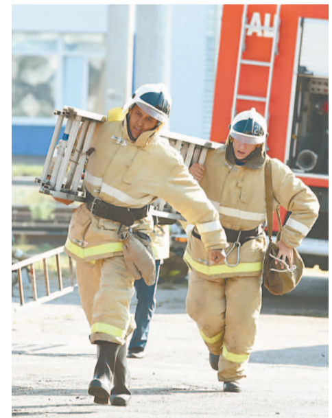
В 35-градусную жару в боевой одежде не каждый сможет двигаться, не только бежать