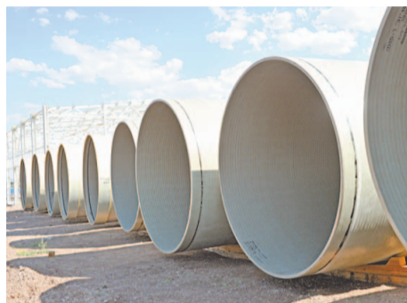
Стеклопластиковые трубы подземного резервуара впервые будут применяться в России

Новая технологическая схема очистных сооружений предусматривает использование технологий, позволяющих снизить показатели по содержанию в сточной воде хлорорганических соединений и тяжелых металлов. Эффективное функционирование обеспечивается также благодаря применению высокотехнологичного и энергоэффективного оборудования от ведущих мировых производителей, специализирующихся в области очистки сточных вод.