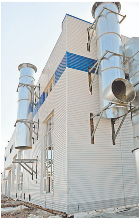
В здании «Вемко» обновлены все фундаменты, оборудование и прилегающие коммуникации

Общий объем подземного резервуара составит 20000 кубических метров.