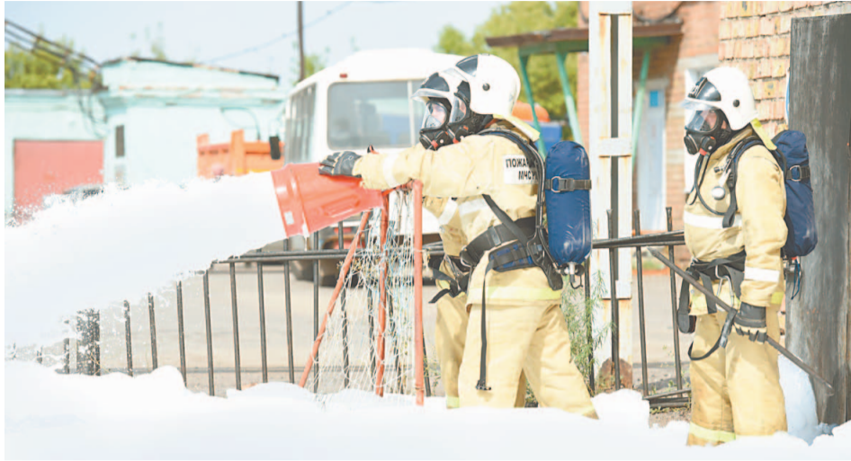
В соревнованиях на лучшее звено газодымозащитной службы сильнейшими признаны коллективы 4 караула ПСЧ-25, на второе место вышел 3 караул ПСЧ-21, на третье – 4 караул ПСЧ-22

Четыре дня подряд на территории пожарно-спасательных частей № 22 и № 23 разворачивались настоящие спортивно-боевые баталии. Личный состав караулов пожарно-спасательных частей второго отряда состязался в силе, выдержке, быстроте, умении. В соревнованиях принимало участие двадцать команд из пяти пожарно-спасательных частей отряда.