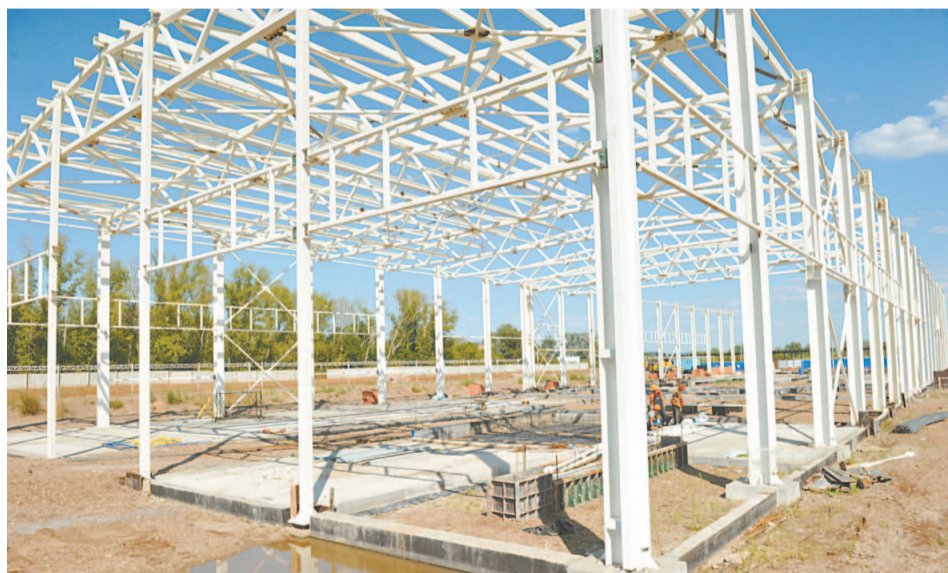
На месте пруда-усреднителя смонтирован блок по обработке осадков