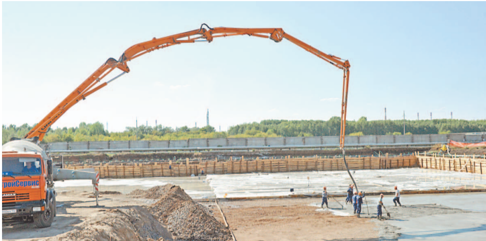
В результате реконструкции территория очистных сооружений уменьшится вдвое – с 400 до 200 га. Это позволит улучшить экологию на промплощадке