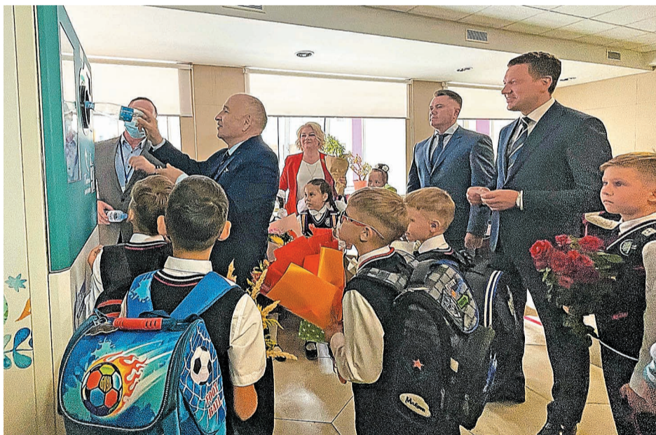
Гости мероприятия отправили несколько пластиковых бутылок на переработку

В рамках программы «Ты + Я = Земля» компания «Газпром нефтехим Салават» инициировала экологический проект «Фандоматы. Разумный сбор». Цель – научить детей разделению мусора. В фойе лицея установили первый фандомат – это устройство по приему пластиковых и алюминиевых бутылок, которые затем отправляются на переработку. Презентация проекта состоялась 1 сентября.