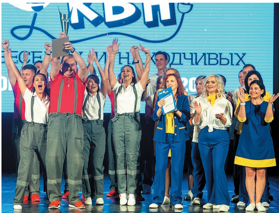
Команда-победительница Кубка КВН «Пятая бригада»

2 место у колоритной и интеллигентной команды «ЛЮДИиКС», представляющей