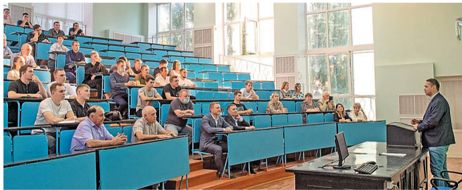
В корпоративных группах будут учиться только сотрудники комбината

В Салаватском филиале Уфимского государственного нефтяного технического университета (УГНТУ) впервые созданы корпоративные группы для работников «Газпром нефтехим Салават». Студенты будут обучаться по индивидуальной образовательной траектории. По окончании обучения они получат дипломы о высшем образовании государственного образца.