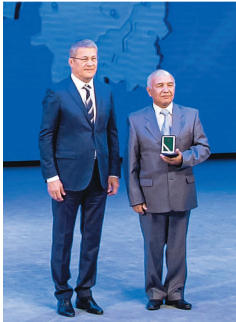
Радий Хабиров вручил награды нефтехимикам

3 сентября во Дворце культуры «Нефтехимик» прошло торжественное собрание, посвященное Дню работников нефтяной и газовой промышленности. Героями этого дня стали аппаратчики, операторы технологических установок, операторы товарные, инженеры-механики, лаборанты химического анализа, машинисты компрессорных установок, инженеры-технологи, газоспасатели и представители многих других профессий. Каждый из награжденных – это часть сильного и профессионального коллектива компании. Изюминка дня в том, что они создают настоящее и будущее комбината.