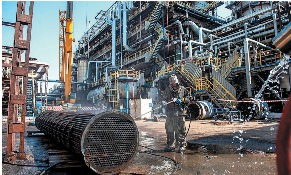
Во время капитального ремонта на заводе «Мономер»

Проведенные работы требовали от работников компании и привлеченных подрядных организаций предельной аккуратности и осторожности. В том числе сложность заключалась в замене контактных устройств в ограниченном пространстве внутри технологического оборудования. Несмотря на сложность