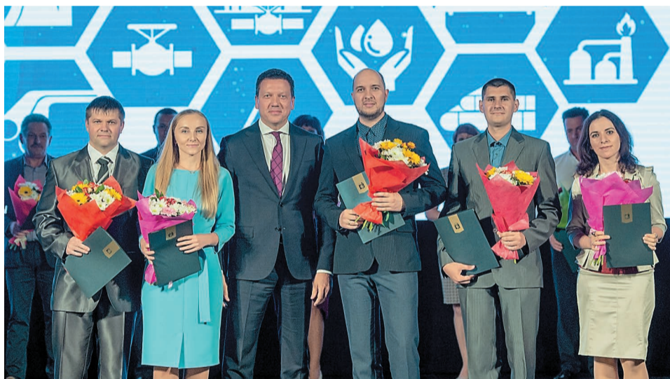
Традиционное чествование сотрудников комбината

В тот же день сотрудников ООО «Газпром нефтехим Салават» чествовали в уфимском Конгресс-холле «Торатау». Здесь прошло торжественное собрание с участием первых лиц республики, руководителей, работников и ветеранов предприятий ассоциации «Газпром» в Башкортостане». Глава республики Радий Хабиров в своей поздравительной речи отметил: «Вы – гордость и опора Башкортостана. Именно с развитием газовой отрасли во многом связано активное создание у нас крупных мощностей по нефтепереработке, нефтехимии и энергетике. Ваши предприятия многие десятилетия являются локомотивом республиканской экономики, источником доходов бюджета, основой реализации важных социальных программ. Ваша профессия – дарить людям тепло. Пусть и ваши дома всегда будут согреты теплом родного очага, вниманием и заботой близких».