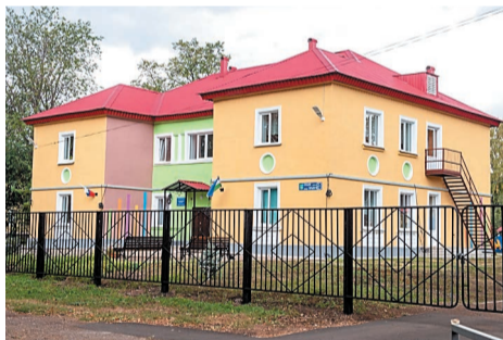
...и после работ по благоустройству