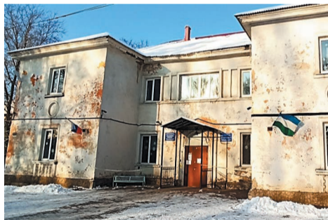
Так выглядел детский сад до ремонта...