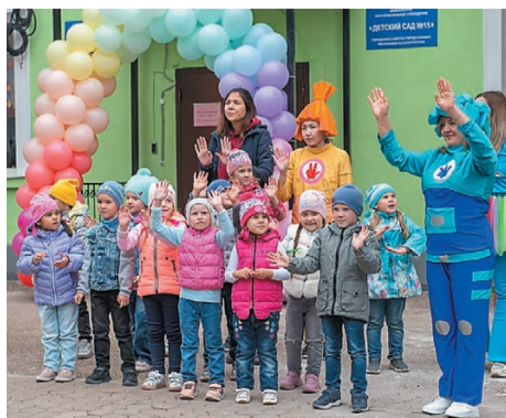
Воспитанники детского сада на церемонии открытия

После ремонта открылся детский сад № 15. Все работы по благоустройству здесь выполнили сотрудники градообразующего предприятия – компании «Газпром нефтехим Салават».