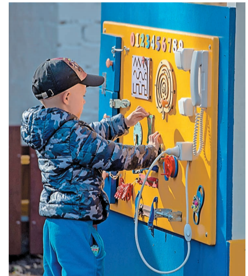
Бизборды популярны у детей