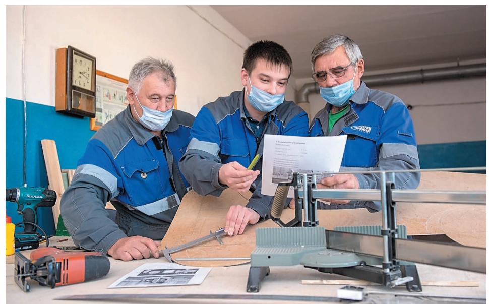
Сотрудники РМЦ за работой