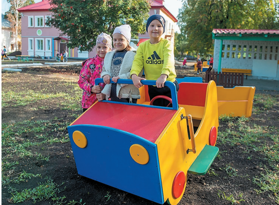
Дети играют на обновленной детской площадке