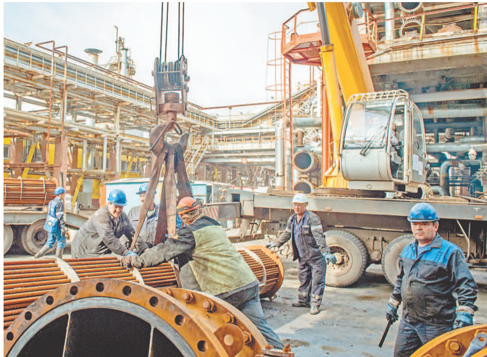
Строповка трубного пучка для последующей сборки теплообменника на установке ЭЛОУ АВТ-4 цеха № 18

Ремонт проходит в рабочем режиме. В целом должна быть проведена ревизия