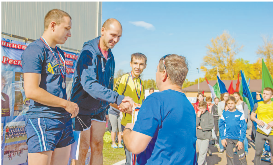
Победители были отмечены грамотами и памятным призами