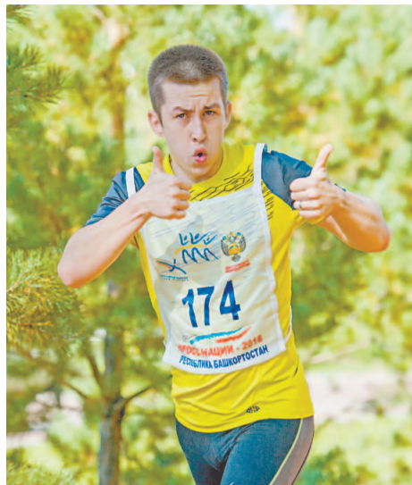
Среди любителей бега много молодых людей

в стороне, когда вся Россия выходит на старт Кросса наций. Бег – самый демократичный и самый доступный вид спорта. Радует, что среди нефтехимиков немало победителей, в этом, кстати, хорошо помогает корпоративный проект сдачи норм комплекса ГТО.