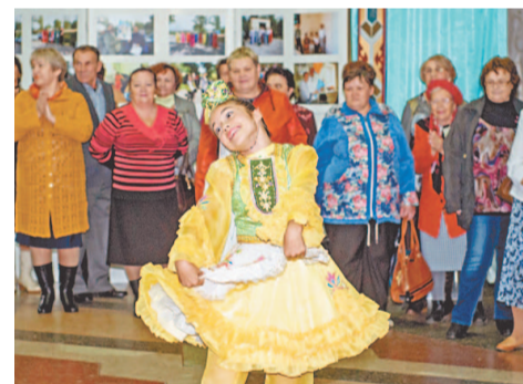
Яркие поздравления от солистов и творческих коллективов Дворца культуры