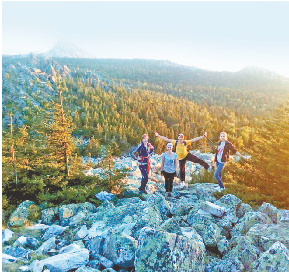
Вид с вершины горы завораживает