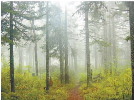
Заповедник богат елями, пихтами и стелющимися можжевельниками. На небольших полянах, под деревьями растут брусника и голубика

Каждый человек отдыхает по-своему: кому-то хочется понежиться на песочке у моря, а нам нравятся походы. Любим природу, запах леса, посиделки у костра. Одно из наших любимых мест — «Таганай», заповедник в Челябинской области, недалеко от города Златоуста. Сюда хочется возвращаться снова и снова. Наверное, потому, что он всегда разный и в нем много еще неизведанного. В этом году мы отправились туда в августе. Погода порадовала (часто в это время на Тагане дожди). До места остановки на ночлег шли 15 км, долгая дорога в гору с рюкзаком за плечами, но это испытание только на пользу. Вокруг — красота! Лес пестрит красками. На пеньках незнакомые растения, похожие на лишайники, рассматриваешь их — они как будто гости из другого мира. Воздух