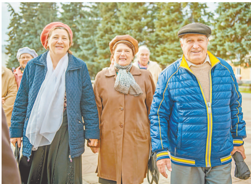
С приподнятым и лирическим настроением или на праздник герои вечера