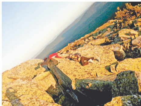
Добраться до вершины было непросто

прозрачный, влажный и «вкусный». Все здесь особенное.