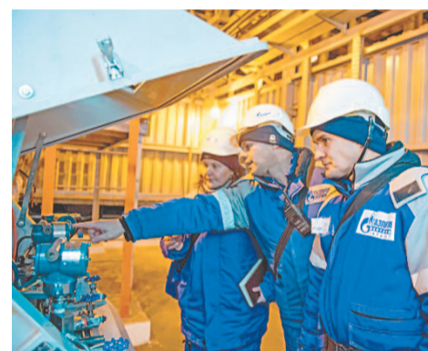
Механизм должен работать как часы