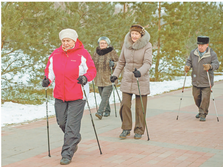
Скандинавскую ходьбу специалисты ценят выше, чем любой другой спорт. Ее три кита: простота, доступность, эффективность

Сегодня человек, идущий с двумя палками по улице, у большинства салаватцев уже не вызывает недоумения. Все потому, что скандинавская ходьба завоевывает все большую популярность среди горожан. С огромным желанием присоединяются к ходокам и ветераны ООО «Газпром нефтехим Салават».