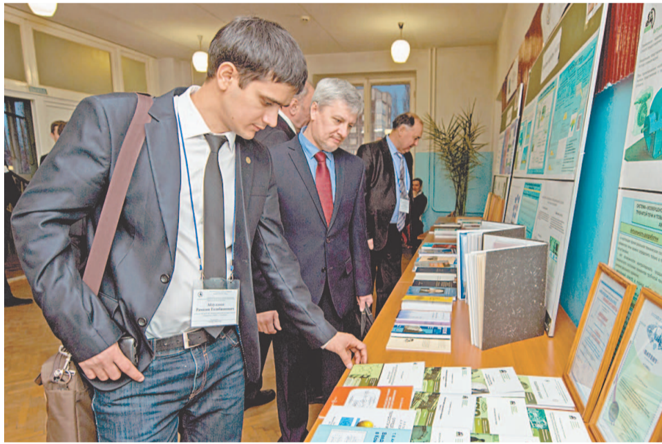
До начала основного торжества на нескольких площадках вуза проходили выставки, были организованы фотоз экспозиции

– Салаватский филиал Уфимского государственного нефтяного технического университета является важнейшим звеном в системе подготовки наших технических специалистов. Сегодня это один из ведущих вузов страны, который готовит студентов к работе в одной из крупнейших в России компаний – ООО «Газпром нефтехим Салават». Мы предоставляем выпускникам возможность начать свою трудовую деятельность в компании и развиваться вместе с ней. Сегодня наша система подготовки кадров имеет понятные критерии и правила игры (программы непрерывного развития профессиональных компетенций, кадровый комитет), и примеров успешного трудового пути перед глазами молодых нефтехимиков достаточно, ведь практически все высшие ИТР-должности в компании занимают бывшие студенты СФ УГНТУ. Мы активно строим новые производства и реконструируем существующие мощности, планируем предоставлять рабочие места здесь в первую очередь для выпускников нашего профильного вуза. Поэтому у молодых нефтехимиков есть прекрасная возможность реализовывать себя в родном городе и на родном предприятии, благо для этого есть сегодня все возможности.