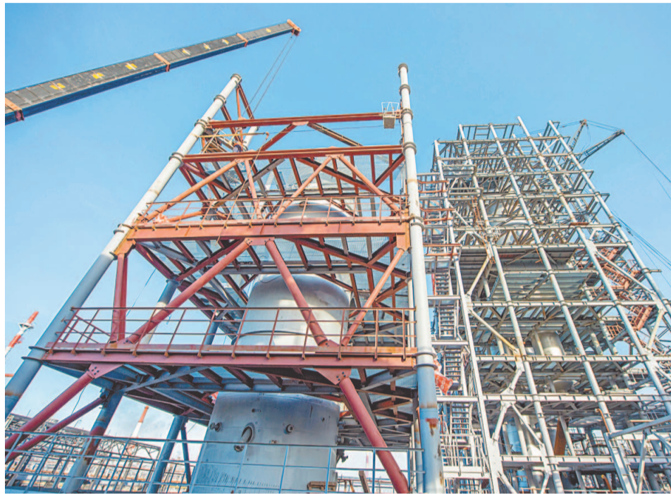
На площадке продолжается монтаж металлоконструкций и трубопроводов. Начался монтаж осадительной и коронирующей систем электрофильтра

На установке гидроочистки проводятся испытания змеевика печи этиленгликолем. В парке сжиженных углеводородов осуществляется монтаж арматуры и подземного противопожарного трубопровода