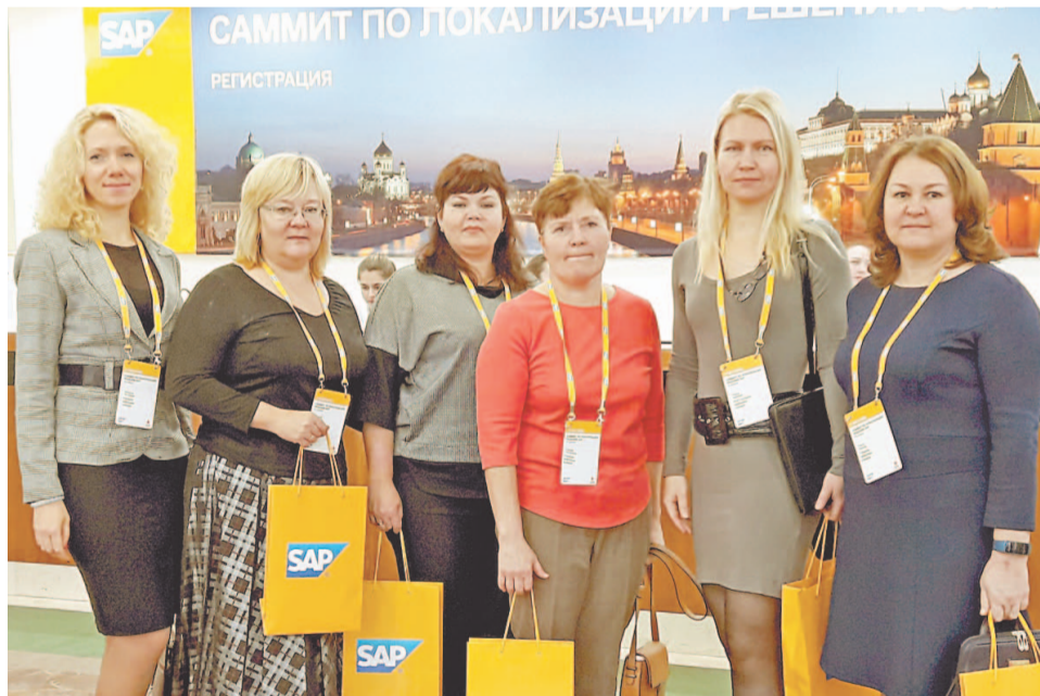
Участники саммита обменялись опытом с коллегами, обсудили с партнерами интересные вопросы

– Для нашей службы, которая занимается сопровождением и развитием решений предприятия в системах SAP ERP, очень важно быть в курсе всех нов-