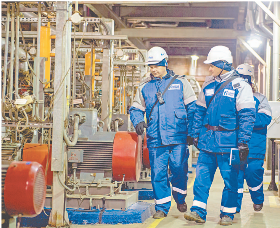
Оборудование под надежным присмотром