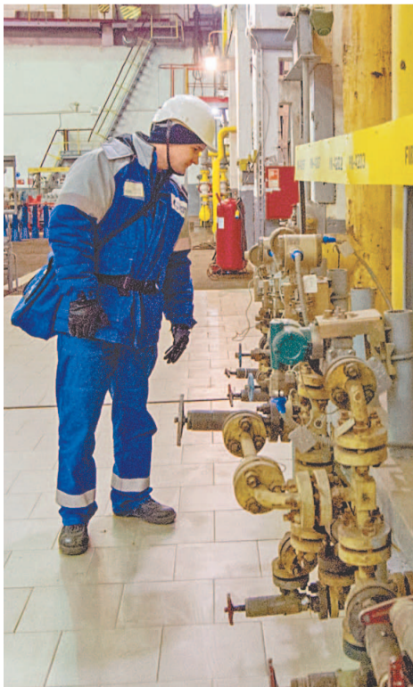
Визуальный контроль обязателен