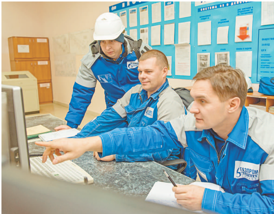
Разбор технологии – очень увлекательный процесс