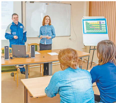
Проект «Учебный полигон»