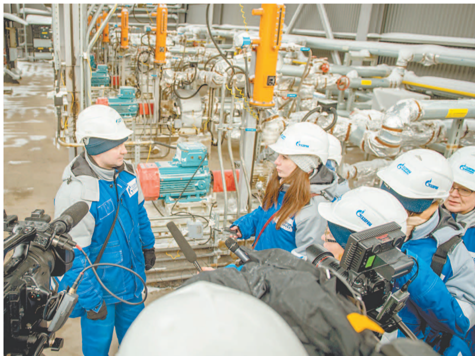
Главные специалисты компании ответили на все интересующие вопросы

– Ранее на подобных установках АВТ и ЭЛОУ, построенных в начале 50-х годов прошлого века, использовались шатровые печи, которые потребляли намного больше топлива при более низком КПД и имели низкие источники выбросов – дымовые трубы, – отметил он. – Современные печи ЭЛОУ АВТ-6 имеют датчики контроля выбросов, работающие в автоматическом режиме, что помимо оптимизации про-