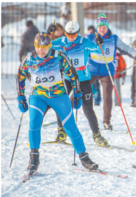
Среди сотрудников компании немало любителей побегать на лыжах