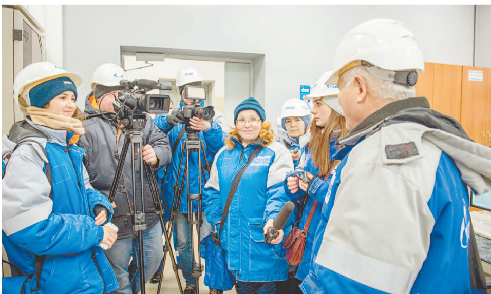
На установке СЩС гостей встретил начальник цеха № 8

■ В Управлении главного механика полным ходом идет планирование работ на 2019 год. Готовятся и прорабатываются ведомости работ по ремонту технологического оборудования. Далее они будут представлены на защиту комиссии Общества, по результатам которой будут определены необходимые и приоритетные объемы работ для их выполнения.