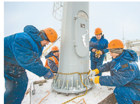
Всего на очистных сооружениях запланировано установить более 20 осветительных мачт

емкость в случае остановки очистных сооружений рассчитана на прием всех промышленных стоков в течение как минимум 8 часов. Она позволит в случае необходимости выполнять остановку, вывод в резерв и ремонт оборудования без нарушения показателей на сбросе стоков, а в случае превышения нагрузок послужит буфером. Ведутся работы по обратной засыпке емкости.