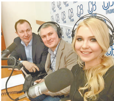
Во время музыкальных пауз ведущие успевали сделать несколько селфи

На заданное: «Как выходить из конфликта?» – тренеры посоветовали прежде всего ответить самому себе на ряд вопросов. Например: «Хотите ли вы сесть за стол переговоров?», «Готовы ли вы уступить?». А вообще, ведущие подчеркнули, что в произошедшем конфликте главное – желание обеих сторон пойти на примирение.