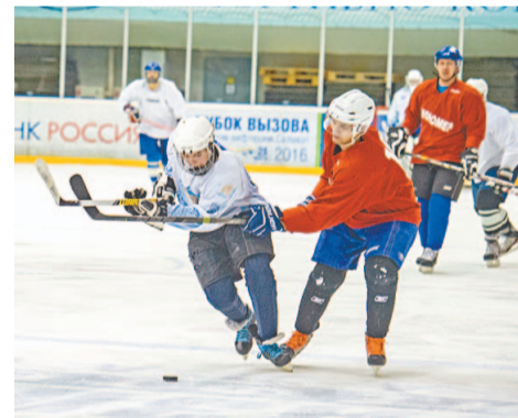
С первых минут мономеровцы взяли инициативу в свои руки