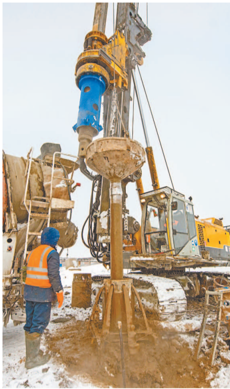
Сваи устанавливаются на 8-метровой глубине

В настоящий момент на очистных сооружениях полностью смонтирована подземная аварийная емкость ОС-259/P-1 объемом 20 000 м 3 . Она не имеет аналогов по конструкции, изготовлена из стеклопластиковых труб диаметром 2400 мм. Данная