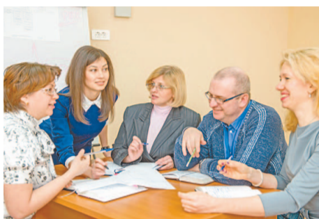
Отдел организационного развития

Два года, как успешно работает кадровый комитет. Да, мы оцениваем квалификацию – работники тянут билеты, отвечают по технологии. Но половину времени это вопросы о себе. Чего достигли в жизни? К чему стремитесь? Чем гордитесь? Какие планы на будущее? И при выборе кандидата его внутреннее стремление развиваться