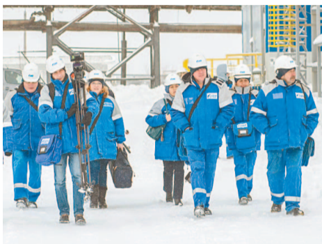
Пресс-тур начался с экскурсии

В ООО «Газпром нефтехим Салават» состоялась выездная пресс-конференция, посвященная реализации масштабного проекта по очистке сточных вод. На объектах Общества побывали журналисты печатных и телевизионных средств массовой информации.