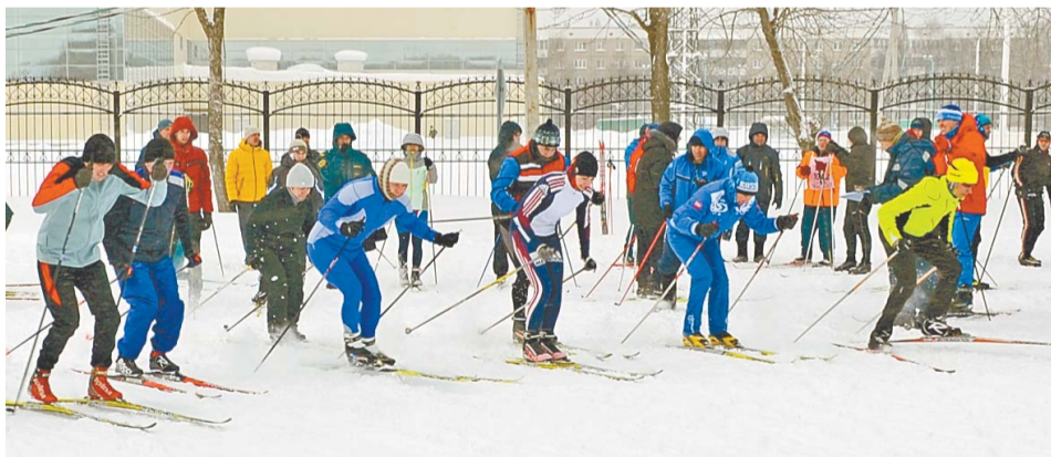
Лыжные старты собрали сильнейших

ным гонкам – 5 человек, из них 1 женщина, в составе офицерской эстафеты – 4 участника. Женщинам предстояло пройти дистанцию в 2300 м, мужчинам – 4600 м. Право стартовать первыми получили представительницы прекрасного пола.