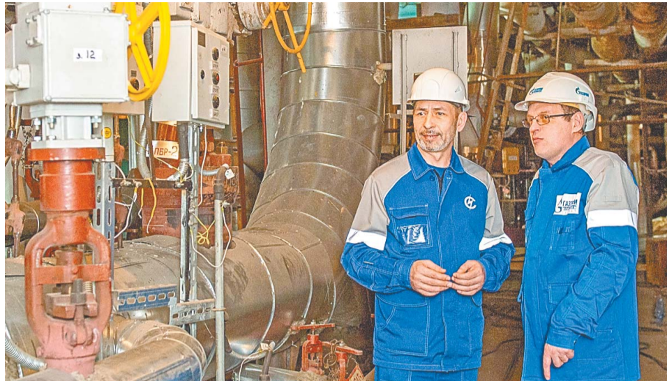
Реализация проекта обеспечит резервирование коллекторов пара 35 ата и надежное пароснабжение Общества даже при повышенном потреблении

По состоянию на сегодняшний день монтаж самого БРОУ-140/35, а также всего