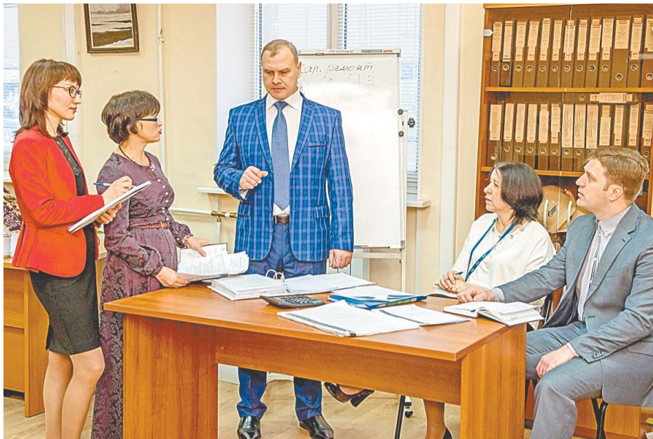
Организационная независимость отдела обеспечивается тем обстоятельством, что начальник ОВА является участником проекта «Внутренний аудит» в структуре ООО «Газпром персонал» – дочерней компании ПАО «Газпром»

В соответствии с требованиями ПАО «Газпром» отдел участвует в договорной работе: осуществляет согласование всех без исключения договоров, контрактов и дополнительных соглашений, заключаемых в Обществе. Кроме того, сотруд-