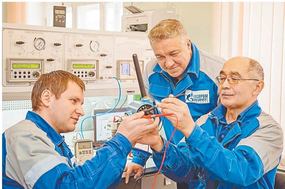
Работники УГМетр обслуживают свыше 83 тысяч средств измерений