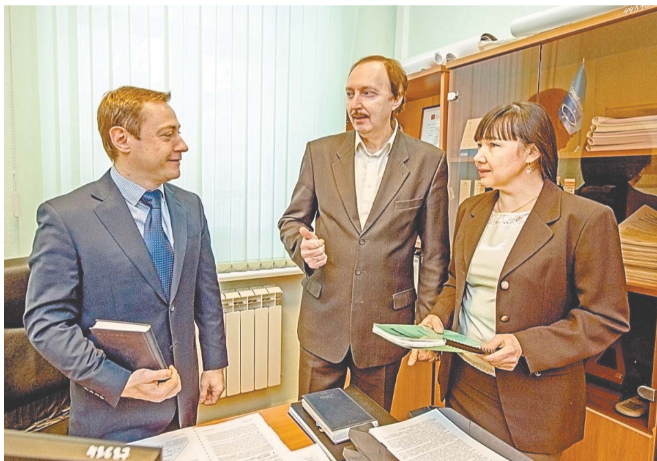
Внутренние аудиторы призваны выявлять скрытые резервы для повышения эффективности работы всего предприятия

во многих случаях играл роль ревизора. Постепенно это отношение изменилось. Сейчас перед внутренним аудитом ставятся все более масштабные задачи, повышаются требования к нему. К внутреннему аудиту начинают относиться как к помощнику, который помогает наладить работу, оказать содействие. Важность поставленных перед нашим отделом задач подчеркивает непосредственное его подчинение генеральному директору компании. Здесь необходимо отметить наличие понимания работы отдела руководством Общества и его поддержка, что является существенным фактором повышения эффективности внутреннего аудита и, соответственно, повышения эффективности бизнес-процессов. Наш отдел также координирует свою деятельность с департаментом ПАО «Газпром» по внутреннему аудиту, который согласовывает годовые планы проверок отдела, определяет тематику проверок и в соответствии с регламентом координации деятельности подразделений внутреннего аудита дочерних обществ и организаций ПАО «Газпром» запрашивает отчеты.