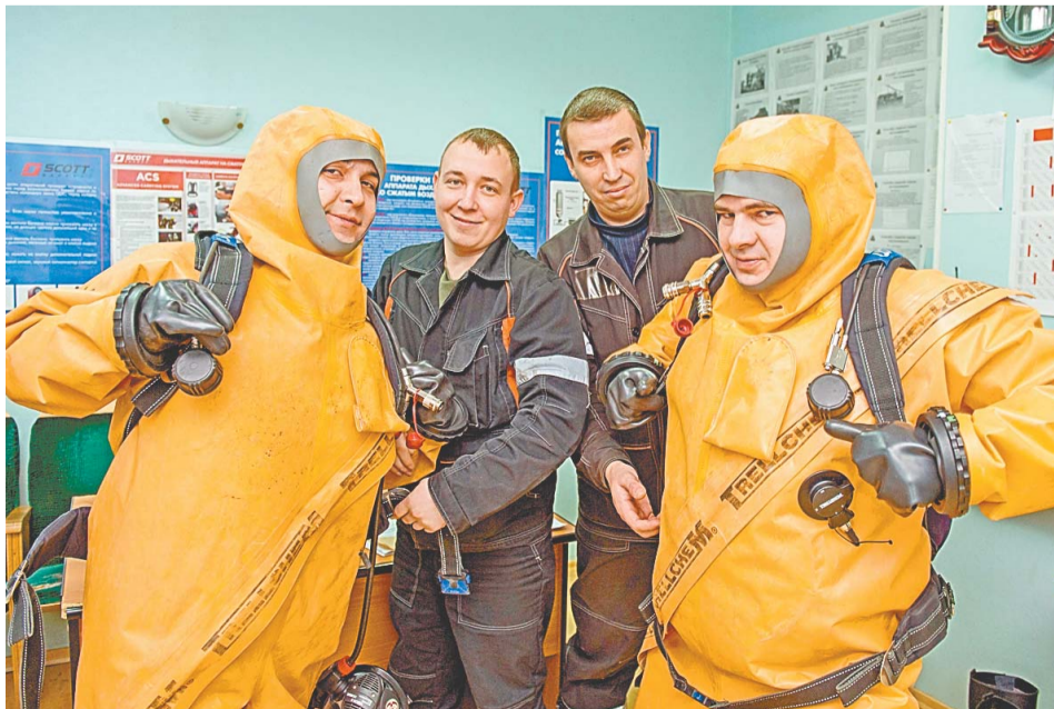
Вес обмундирования и оснащения может достигать 50 кг

Всего в штате военизированной газоспасательной части работает 140 человек. На работу сюда примут кандидата, имеющего техническое, медицинское или физкультурное образование.