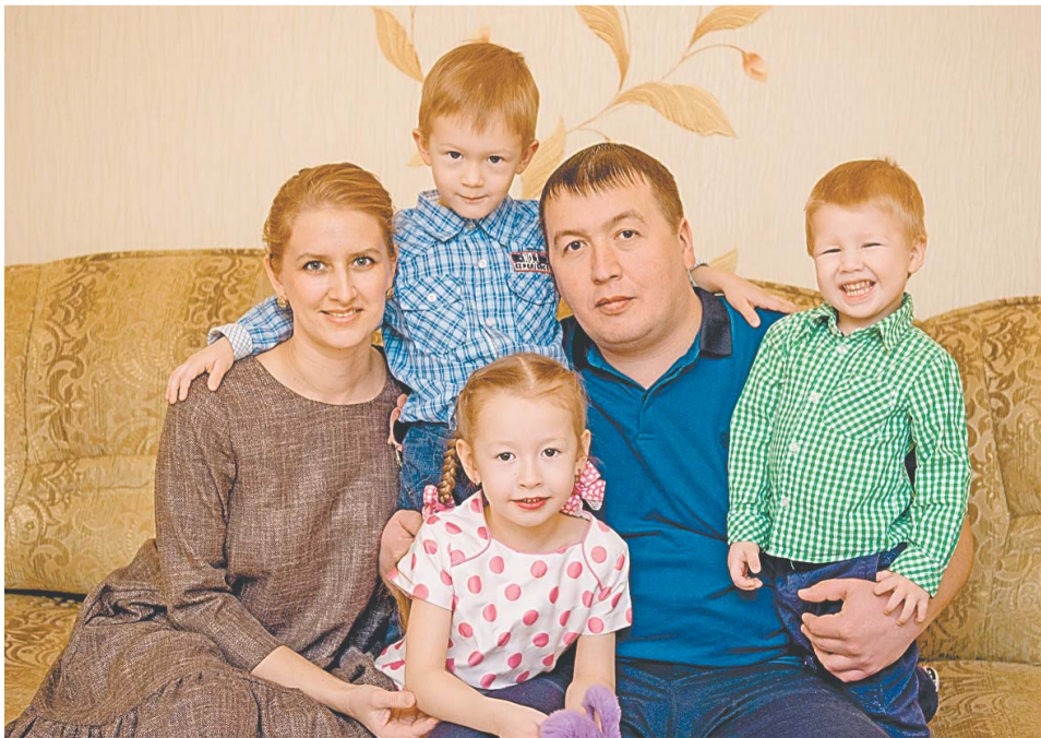
Любимыми рождаются и становятся