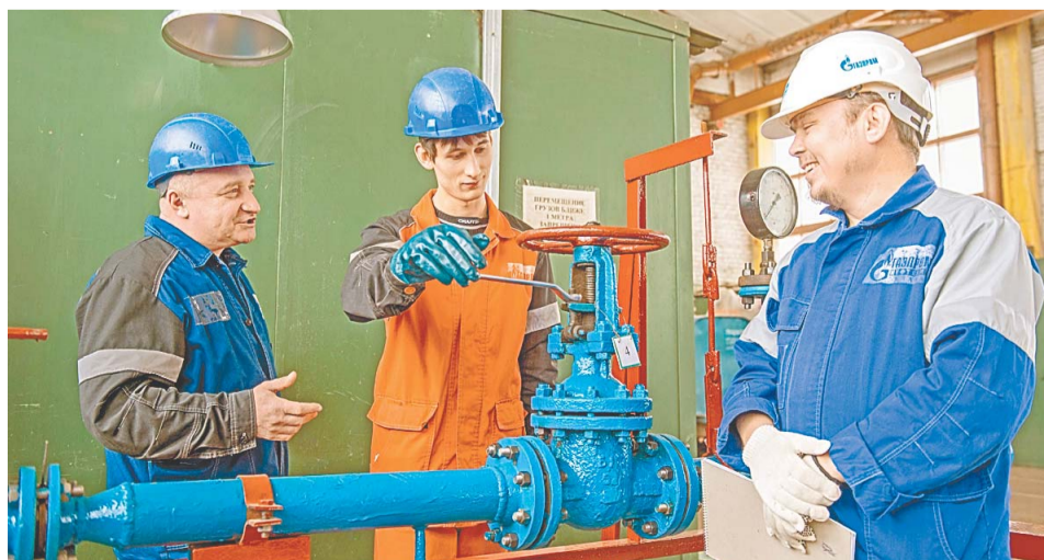
После практического обучения новичков на действующих производственных объектах будет чувствовать себя увереннее