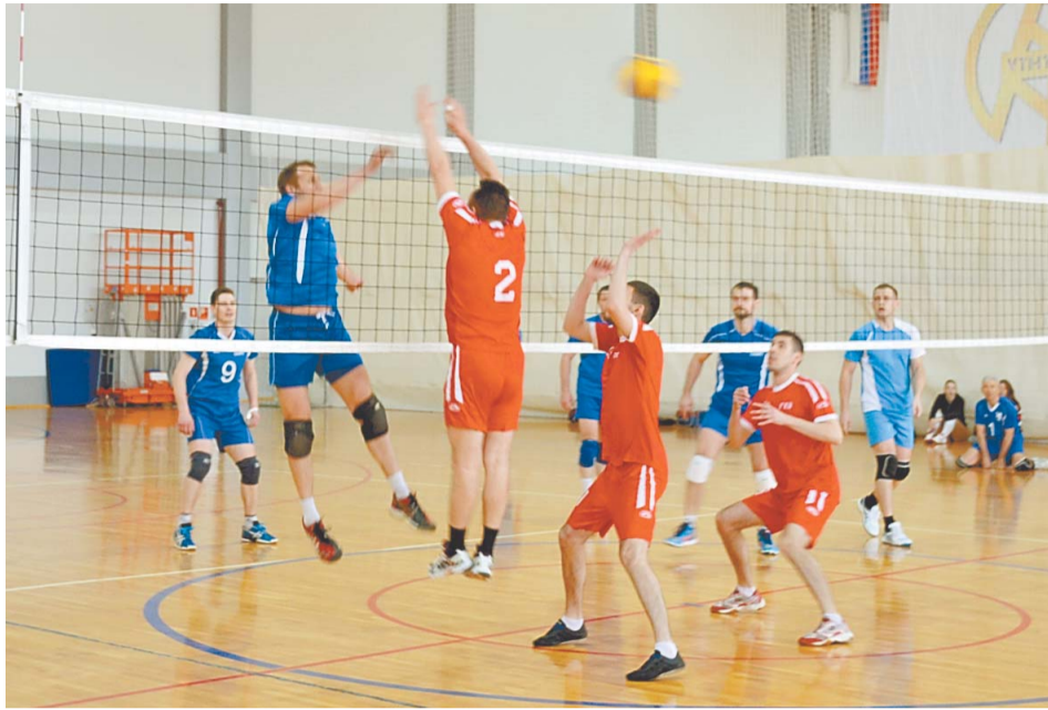
В волейбольном турнире участвовало двенадцать команд

В финальной серии стыковых матчей команды показали высокий уровень игры и упорство в достижении победы. Четыре сильнейшие команды – «НС ТЭЦ», «ПАТиМ», «Мономер» и «Управление» – вышли в полуфинал турнира, чтобы доказать друг другу и в первую очередь себе, что готовы бороться за звание чемпиона и находятся в отличной спортивной форме. В первом полуфинальном поединке между командами «ПАТиМ» и «Мономер» транспортники были более удачливы при атаках и очень грамотно блокировали атакующие удары соперников, счет 3:0 говорит сам за себя. Во втором полуфинальном матче команда «НС ТЭЦ» с таким же счетом выиграла у команды «Управление».