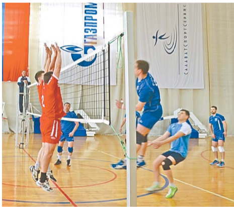
Никто не желал уступить соперникам

В первой группе не всем командам удалось составить достойную конкуренцию фавориту турнира команде ООО «НС ТЭЦ», которая довольно уверенно обыграла своих соперников по группе. Во второй группе явный лидер был один – это команда ООО «ПАТиМ», которая без проблем обеспечила себе выход в следующий круг. В третьей группе команда завода «Мономер» убедительно взяла старт, выиграв обе игры предварительного этапа.