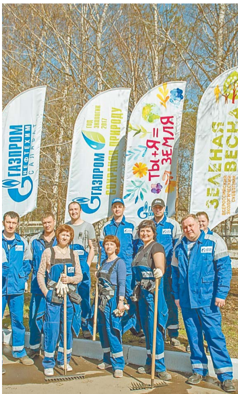
Участовать в общегородском субботнике стало доброй традицией нефтехимиков

Сотрудники компании приняли активное участие в общегородском субботнике