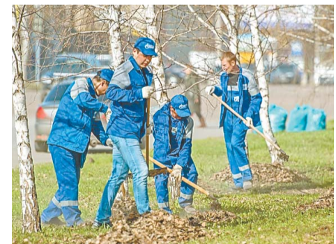
За несколько часов собраны десятки тонн сухой листвы и мусора