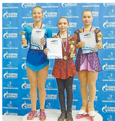
Салаватским фигуристам за победу пришлось серьезно побороться

– Каждый раз, приезжая сюда, от души говорим добрые слова в адрес организаторов, – говорит судья соревнований, технический специалист из города Пензы