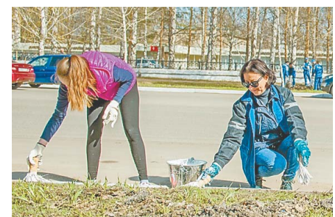
Наводить порядок вышли сотрудники разных подразделений