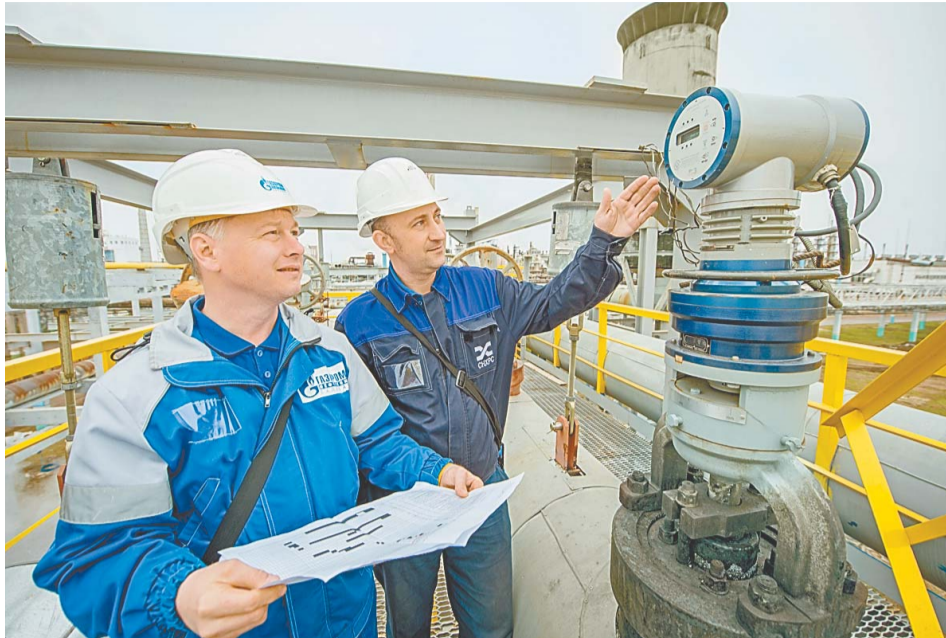
Реализован важный проект для нашей компании

– Наименование проекта обусловлено техническими характеристиками трубопровода, – сказал главный специалист