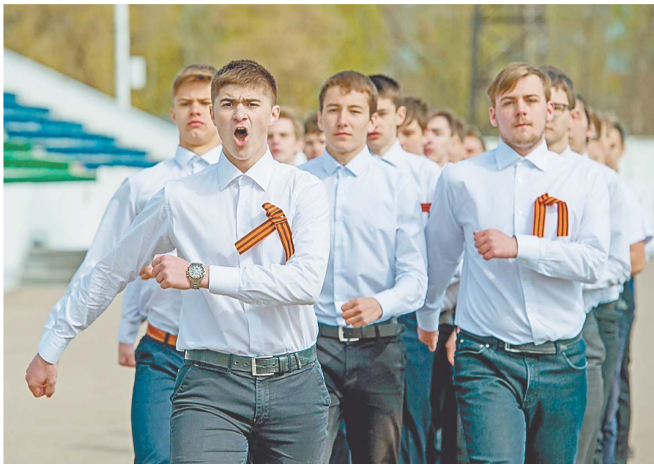
Школьники маршировали и пели в рамках военно-патриотической акции «Сохраним весну человечества»

Все было по-настоящему, молодежи пришлось демонстрировать строевые приемы с элементами строевого устава Вооруженных сил Российской Федерации. Например, за секунды построиться в одну шеренгу, приветствовать руководителя: «Здравия желаю товарищ капитан!», дружно кричать: «Ура, ура, ура!». Каждый из участников четко освоил команды «Становись!», «Равняйся!», «Смирно!», «Вольно!», «Разойдись!», «В одну шеренгу становись!», «Смирно!», повороты на месте, перестроение в две шеренги и обратно и