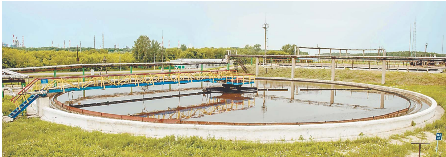
Проектная мощность наших очистных сооружений – 8 тыс. 333 кубометра в час

– На сегодняшний день к нам поступает в среднем около 5 тыс. кубометров стоков в час. Поток идет постоянно, в ночное время он несколько снижается, а в дневное увеличивается. Половина стоков принимается с территории жилой застройки Салавата, другая половина – от северной промышленной зоны. ООО «Газпром нефтехим Салават», ООО «Ново-Салаватская ТЭЦ», ОАО «Салаватнефтемаш», Салаватский филиал ООО «Башкирская генерирующая компания», ООО «Салаватский катализаторный завод», ООО «ПАТиМ», АО «Салаватнефтехимремстрой» и все остальные фирмы и компании, находящиеся на промышленной площадке. Так вот, в стоки попадает практически весь спектр остатков продукции, которые производятся предприятиями. Значительную долю составляют загрязнители, присущие бытовой деятельности населения, например фосфаты, образующиеся при использовании моющих и стиральных средств. Очищаются на специальных со-