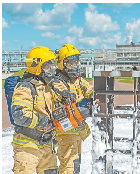
Учения – лучший способ повысить профессиональное мастерство огнеборцев и проверить их готовность противостоять чрезвычайным ситуациям