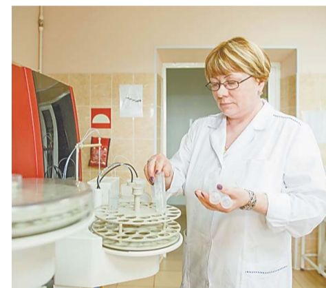
Контроль на страже качества

лават». Совместными усилиями качество сбросов промышленных стоков поддерживается на допустимом уровне для биологических очистных сооружений.