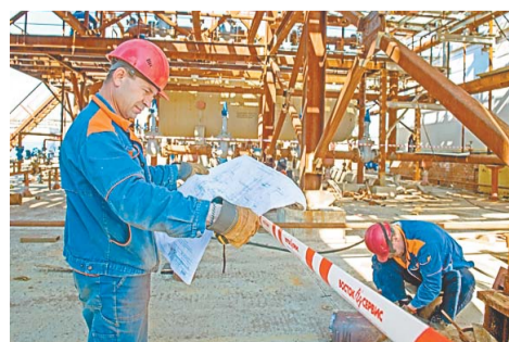
На установке гидроочистки ГО-2 в рамках проекта по модернизации продолжается монтаж нового оборудования