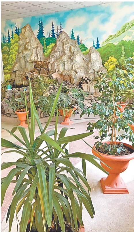
Цеховики гордятся зеленым садом, сделанным своими силами

Диапазон корпоративного конкурса «Цветик-кабинетик» расширяется. Свои истории о зеленых любимцах на конкурс все чаще сейчас присылают не отдельные сотрудники компании, а трудовые коллективы. Одна из них поступила из цеха № 51. Многие нефтехимики знают, что этот цех завода «Мономер» славится своим зеленым уголком. Здесь есть пальмы, цветы, фонтаны. Аквариумные рыбки и попугаи тоже уже много лет живут в цехе.