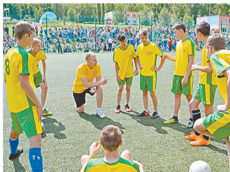
Футболисты получают наставления перед игрой

Во вторую смену в детский оздоровительный центр «Спутник» на целый день приехали гости – отдыхающие из других лагерей Башкирии. Мальчишки и девчонки соревновались в пятом Кубке лагерей республики по футболу и пионерболу.