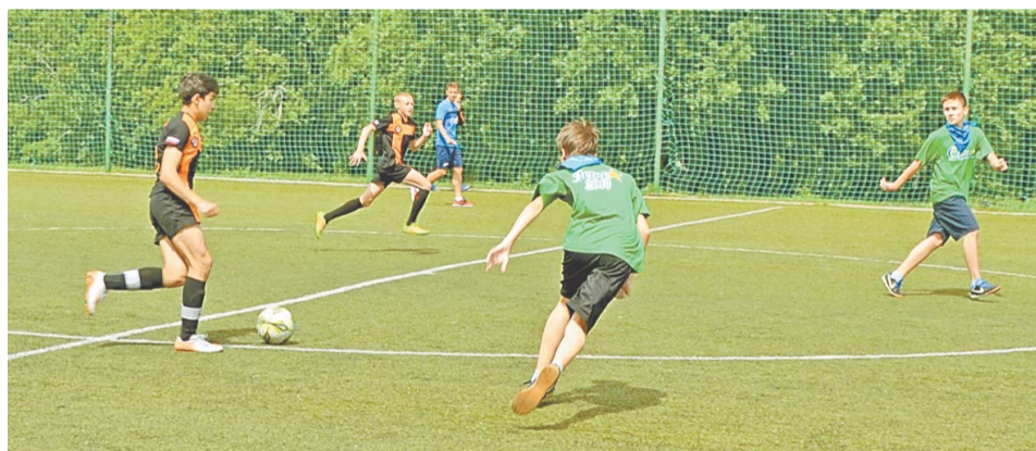
Почти два часа команды боролись за кубок

болу пошло полное погружение в футбол. Шесть команд встретились на просторном футбольном поле.