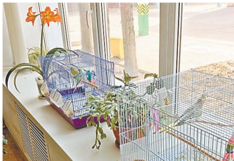
Пернатые удачно прижились в операторной

Чтобы еще лучше украсить свой уголок, работники цеха развели здесь живые цветы. Вначале росли здесь только гибискус и хлорофитум. С годами зеленых любимцев становилось все больше и больше. Тут замечательно прижились амариллис, монстера, калатея, драцена, фикус обыкновенный и фикус бенджамина, декабрист, финиковая пальма.