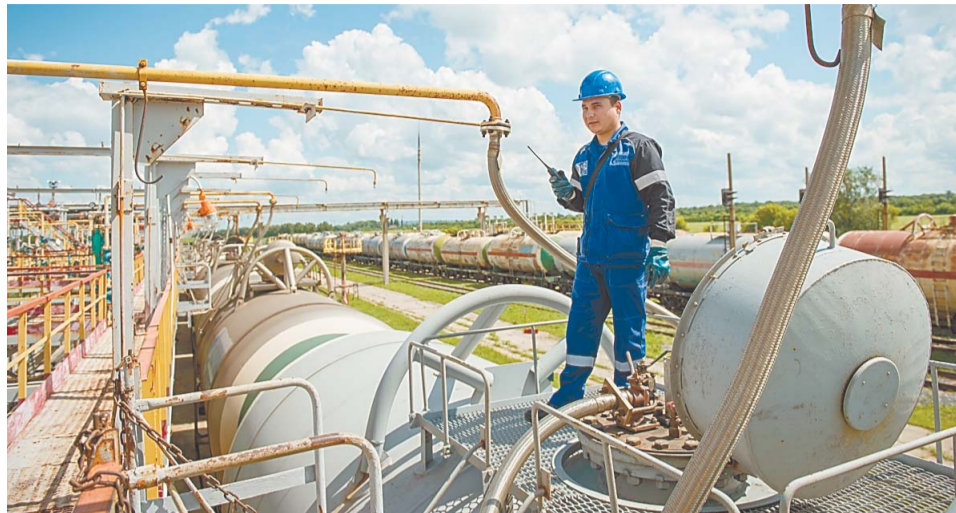
Отгрузка ШФЛУ осуществляется по новому специальному трубопроводу

В период с 1 по 14 июня на площадке Е установки жидких газов ТЭС завода «Мономер» между трубопроводами очищенного ШФЛУ и откочки ШФЛУ с парка на сливноналивную эстакаду был смонтирован