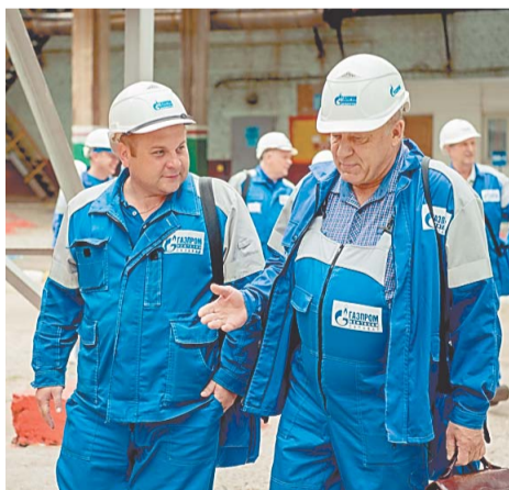
Два поколения начальников цеха № 52