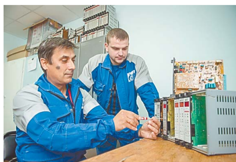
Квалификация сотрудников позволяет заводу повышать эффективность переработки