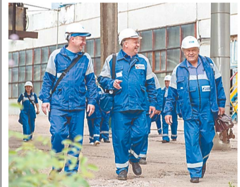
С улыбкой – на экскурсию по цеху