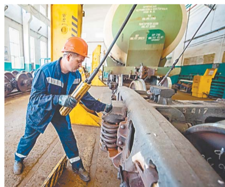
9 тепловозов ежедневно выходят на линию, и еще 2 находятся в резерве