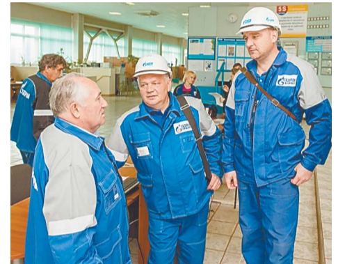
В центральной операторной: вопросы здесь задают все!

Пока в комнате приема пищи представительницы прекрасной половины цеха разливают чай, ветераны интересуются жизнью сотрудников: как работает в цехе, чем дышит коллектив, и показывают фотографии давно прошедших лет из своих семейных альбомов.