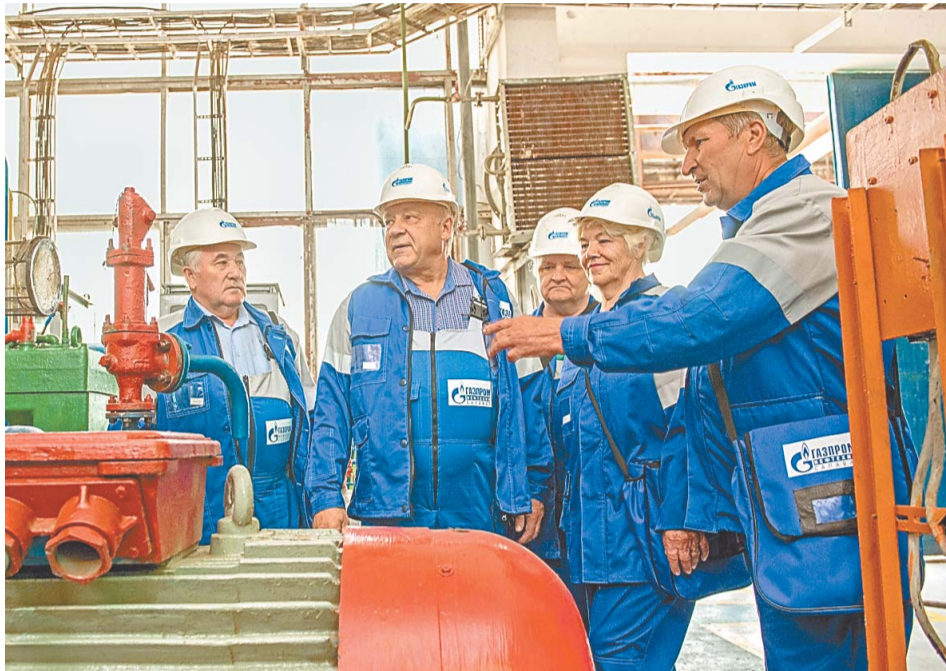
Ветераны inspectируют установки

Праздничный проект «Чак-чак», посвященный грядущему 70-летию юбилею компании, набирает обороты. У него разные участники и места проведения. На этот раз ветераны предприятия посетили родной для них цех № 52 завода «Мономер». Правда, в проекте есть и составляющие, которые всегда остаются неизменными — это вкуснейший чак-чак и эмоции участников долгожданных встреч.