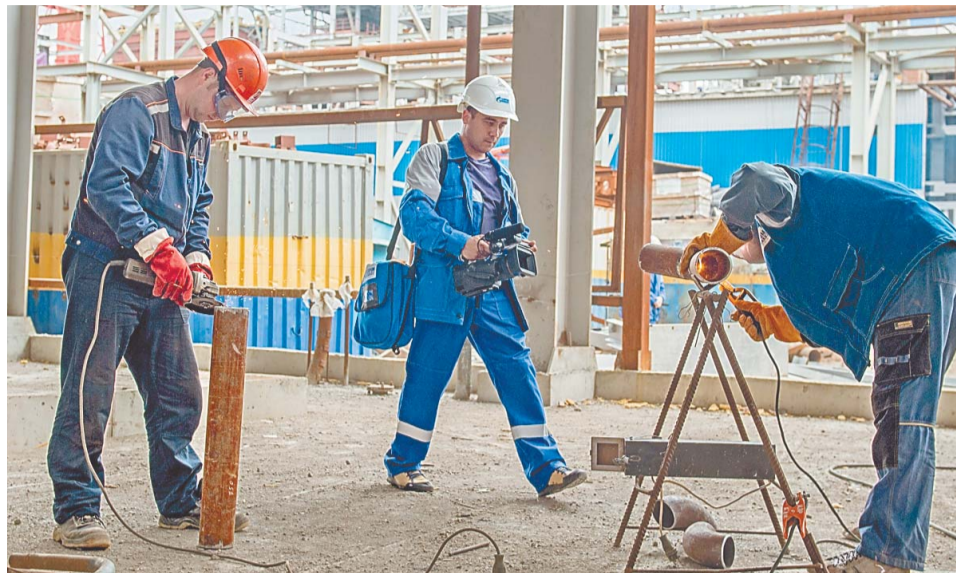
Тележурналисты БСТ на комплексе каталитического крекинга

рудования, – отметил он. – Ведутся механомонтажные работы по трубопроводной обвязке, в ближайшее время планируется приступить к работам по монтажу поршневых компрессоров установки селективной гидроочистки и компрессора жирного газа установки каталитического крекинга.