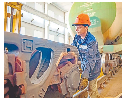
Каждый сотрудник вносит вклад в круглосуточную работу предприятия

775 тысяч тонн в месяц — такой объем грузоперевозок обеспечивают и осуществляют работники ООО «ППЖТ».