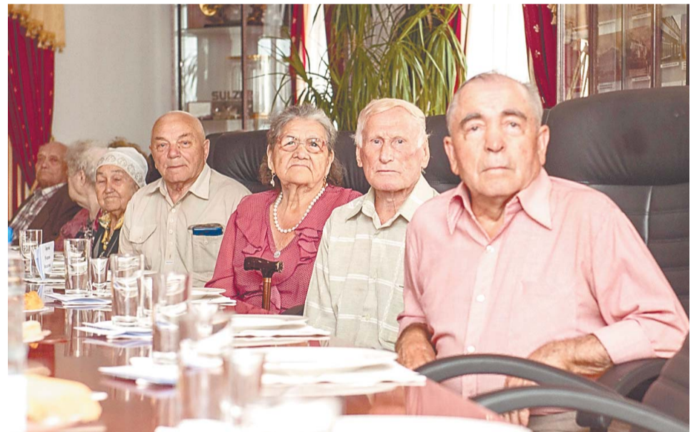
Все участники встречи отработали на комбинате № 18 более 25 лет