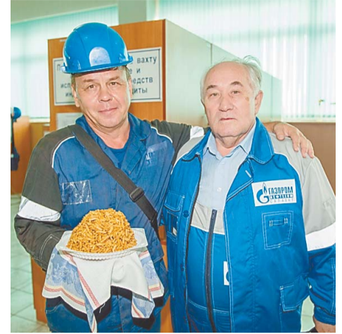
Современность и опыт — плечом к плечу