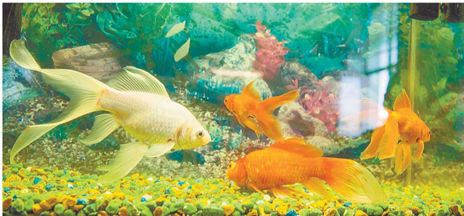
Золотые рыбки – на удачу!