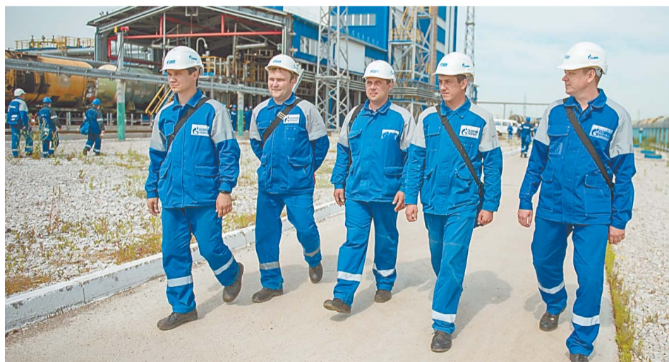
Работники ТСЦ знают историю своего завода