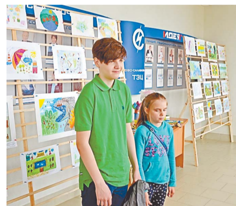
В выставке приняли участие полсотни ребят

Все участники выставки получили дипломы, фирменные сувениры и памятные подарки за праздничными столами, наполненными сладостями. Радостные крики ребят, звонкий смех и довольные улыбки сделали этот праздник незабываемым.