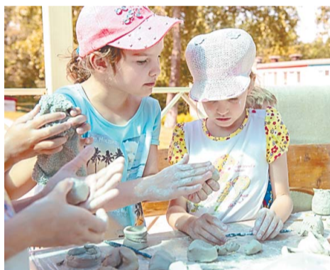
Каждый ребенок чувствовал себя настоящим мастером