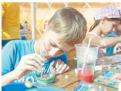
Слепленный сосуд нужно было разукрасить