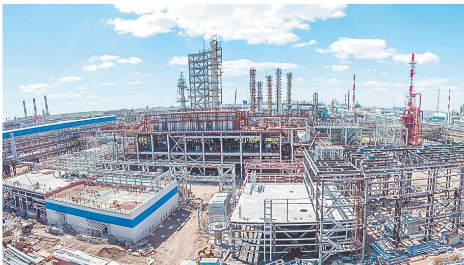
Комплекс каталитического крекинга – самое крупное из строящихся производств за последние годы