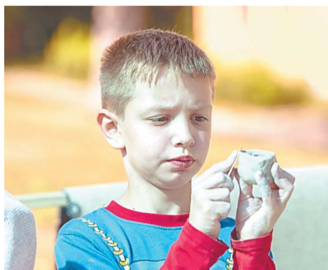
Гончарство требует сосредоточенности