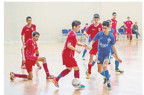
Принцип «от массовости – к мастерству» реализуется в компании «Агидель-Спутник» в полной мере