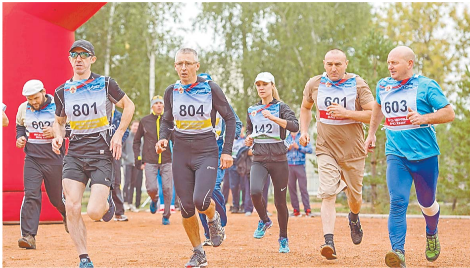
Спортивные сооружения компании являются великолепными тренировочными площадками, ежедневно на беговые и плавательные дорожки, футбольные поля, ледовую арену, в фитнес-залы приходит более тысячи человек

Уж сколько гневных тирад было высказано в адрес российских футболистов после Кубка конфедераций, мол, нет у нас футбола, а мы вот думаем, что есть. Как пример – салаватский «Зенит». Да, пока они юны, им всего по 10 лет, но в минувшем 2016-м году в клубном зачете по результатам выступлений команд всех возрастов