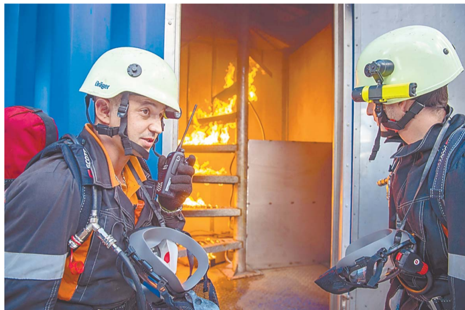
Занятия на огневых тренажерах