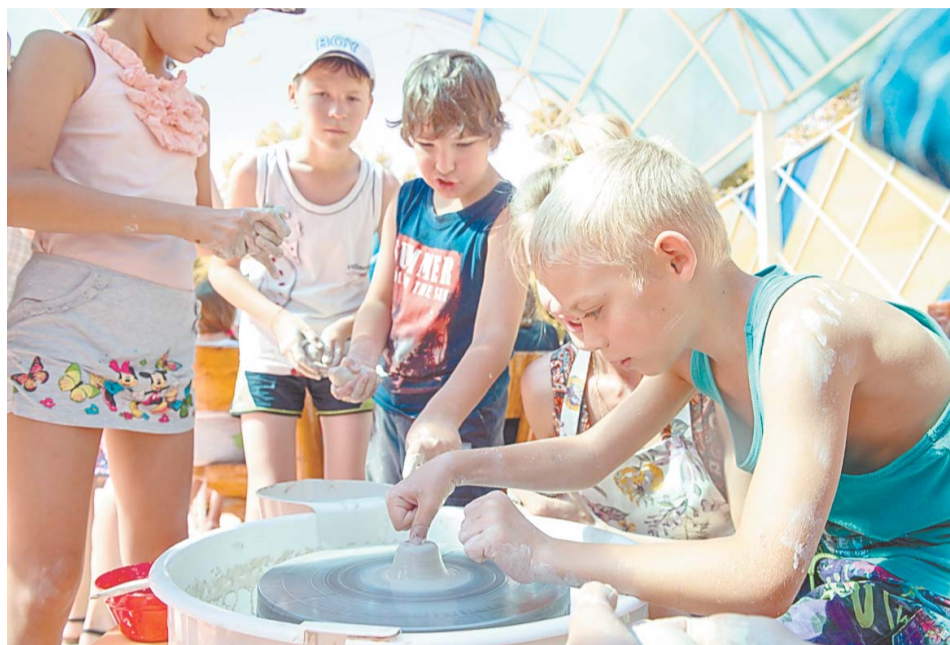
В глине – руки, щеки и даже волосы, но это не останавливает, наоборот, процесс становится все интереснее

Гончарное ремесло – увлечение нынче модное. Говорят, оно отвлекает от повседневной суеты. И это действительно так. Первое время мы смотрели, как замороженно и заинтересованно дети вылепливали из комочков природного материала свои задумки. А потом, жажда умиротворения, и сами взялись за глиняные кусочки и начали творить. Руки здесь – главный инструмент мастера.