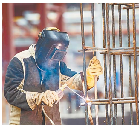
На стройплощадках задействованы сотрудники АО «СНХРС» и других подрядных организаций