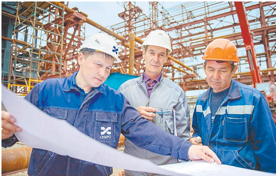
Планов – громадье!

– Количество реализованных проектов за последние 5 лет невозможно посчитать. Это десятки крупных и сотни небольших объектов. В денежном выражении это введенные в эксплуатацию производственные объекты на десятки миллиардов рублей. Из крупных производств могу назвать строительство ЭЛОУ АВТ-6, установки грануляции карбамида, производства акриловой кислоты и акрилатов, ПГУ-410, установки изомеризации пентан-гексановой фракции, реконструкцию установки гидроочистки дизельного топлива ГО-2, модернизацию производства этилена ЭП-340. Это наша гордость, все проекты на слуху, и вы все о них, конечно же, прекрасно знаете!