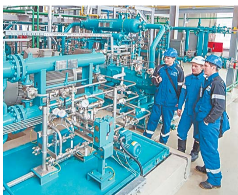
Ввод новых объектов улучшит качество продукции

– На протяжении последних лет мы все наблюдаем за бурным строительством в компании. Какие проекты уже можно считать реализованными?