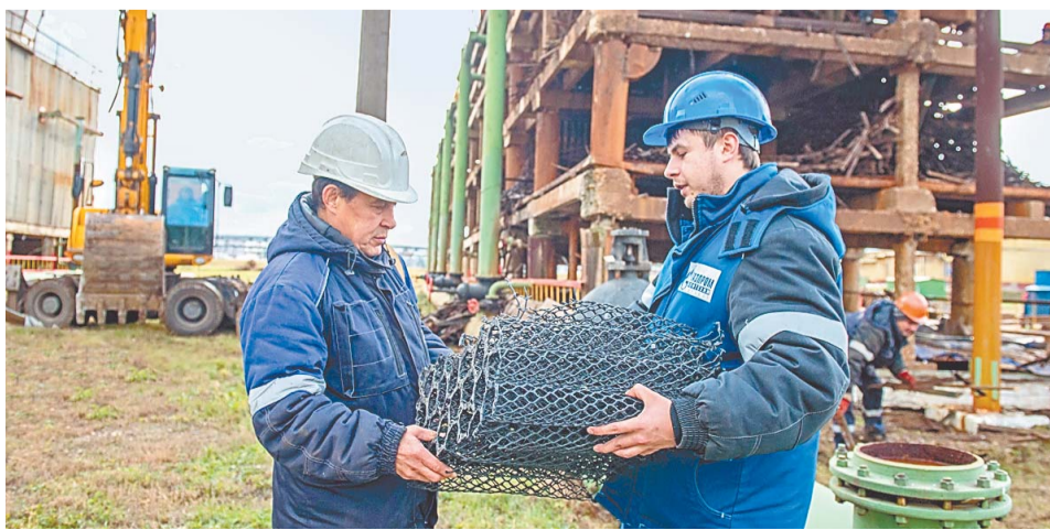
Демонтаж блоков оросителей