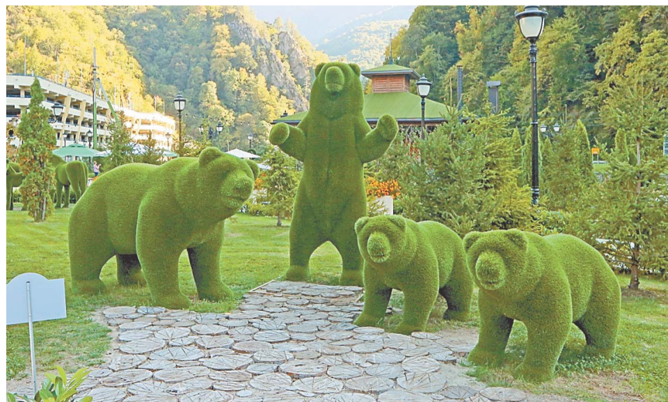
Парк на курорте «Газпром»

На конгрессе лагерей проводилось много лекций и мастер-классов от ведущих специалистов в области лагерного движения. Мы узнали новые методики общения с ребенком, которые проводятся в форме досуговых образовательных и воспитательных мероприятий в детских лагерях за рубежом. И это лишь малая часть того, о чем нам рассказали на мастер-классах. Планируем применить полученный опыт в ДОЦ «Спутник».