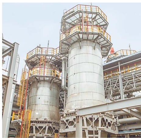
Реактор P-2 установки ГО-2 цеха № 9