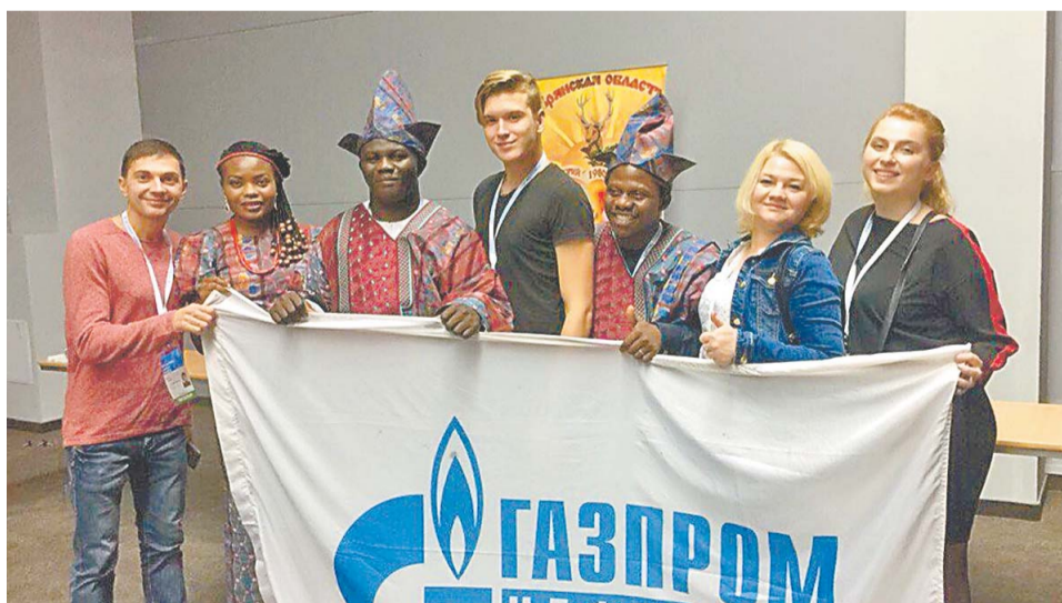
С представителями делегации из Нигерии

После мероприятия нас ждал еще один сюрприз. ДОЦ «Спутник» пригласили в Международное содружество лагерей (ICF). Стать его участником очень почетно. Это признание международного сообщества, которое дает возможность участвовать в различных престижных форумах и конкурсах. Теперь мы можем рассчитывать на помощь со стороны других участников содружества в решении ряда вопросов, касающихся организации детского отдыха.