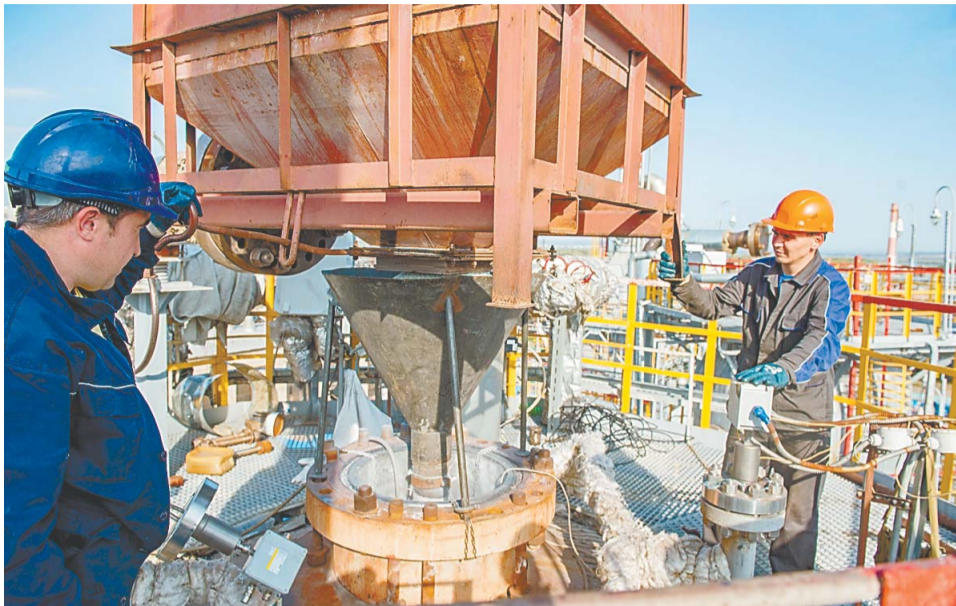
Загрузка катализатора из бункера в реактор

В КОМПАНИИ «ГАЗПРОМ НЕФТЕХИМ САЛАВАТ» ВПЕРВЫЕ ПРОВЕЛИ РЕГЕНЕРАЦИЮ КАТАЛИЗАТОРА ДЕПАРАФИНИЗАЦИИ