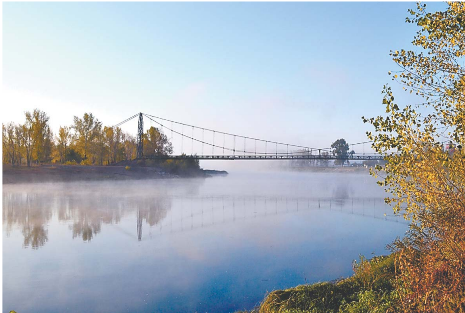
Мост в утреннем тумане глазами Сергея Леонова