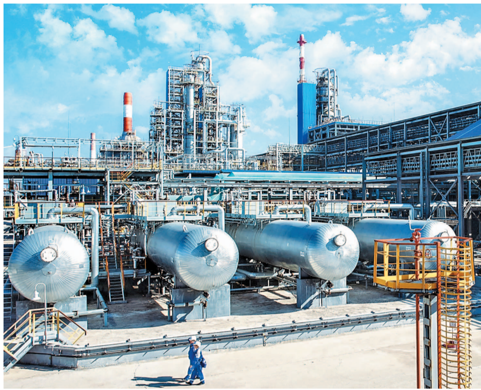
Установка ЭЛОУ АВТ-6

Основной объем газового конденсата получают из газоконденсатных и газоконденсатно-нефтяных месторождений. Меньше – из попутного нефтяного газа в процессе промышленной подготовки нефти (при ее сепарации). Некоторое количество газового конденсата может находиться и в чисто газовых залежах.