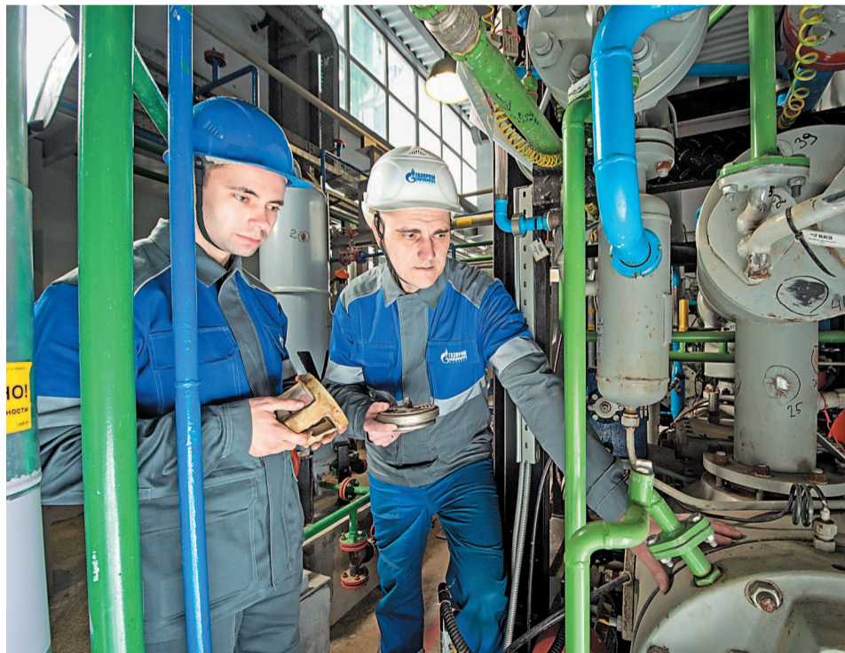
Коллектив установки досконально изучил новое оборудование

Предусматривается возможность совместного приема СЦС с НПЗ и медьсодержащего стока с ООО «Акрил Салават». Необходимость процесса продиктована требованиями по сырью для процессов десорбции азота аммонийного и сульфидов, а также биологической доочистки от фенолсодержащих соединений с целью получения очищенного стока для его откачки на очистные сооружения ООО «ПромВодоКанал». Ввод в эксплуатацию новой установки