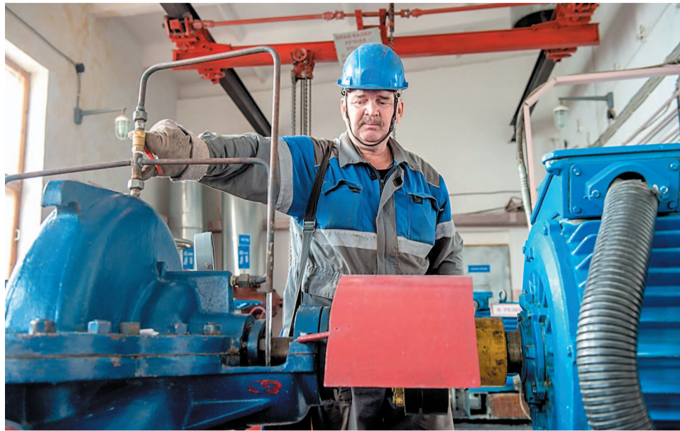
Ведется техническое обслуживание насосного оборудования

1 65 382 погонных метра трубопроводов пара и отопительной воды отремонтировано с начала весенне-летнего периода.