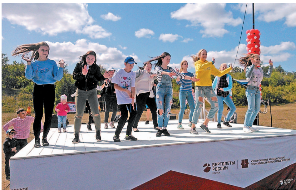
Ребята из «Спутника» исполнили зажигательный танец