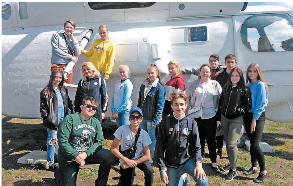
Поездка на вертолетный завод стала подарком для детей от ООО «Агидель-Спутник»