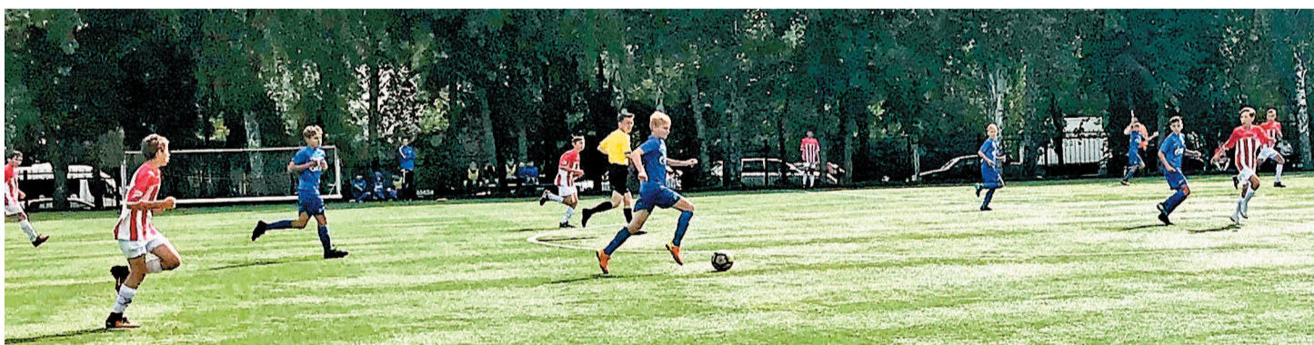
Зенитовцы провели в Тюмени пять игр

Во втором матче салаватцы играли с хозяевами тура – командой «МФК». Весь первый тайм соперник навязывал свой стиль игры за счет длинных передач и борьбы за него на всех участках поля. В итоге «Зенит» не успел перестроиться и стал играть так же. Этот тайм был похож на битву двух гладиаторов, а не на игру в футбол. В перерыве воспитанники компании «Агидель-Спутник» успокоились, вспомнили свои