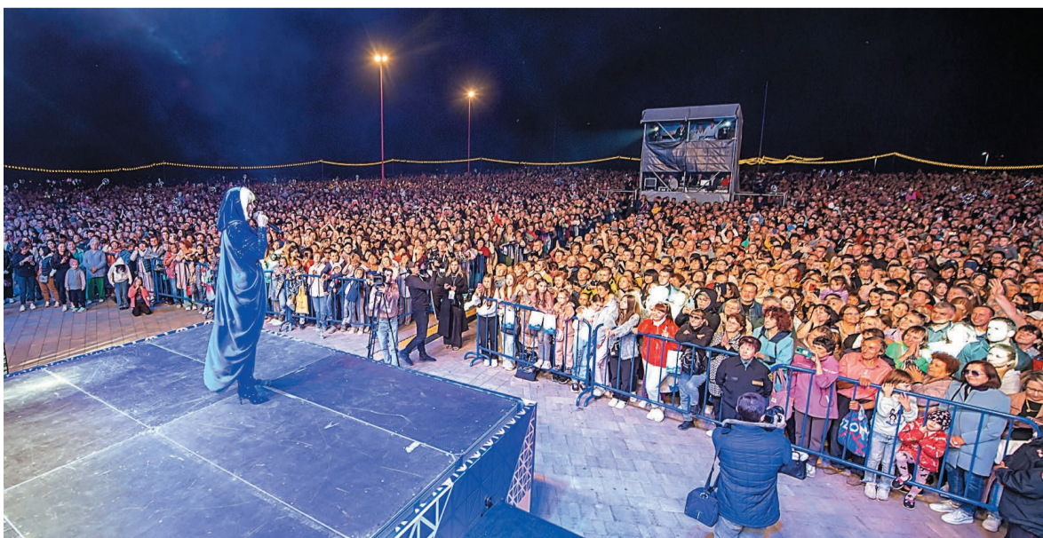
На праздник пришли тысячи салаватцев

Материал подготовили Элина УСМАНОВА, Марина НЕСТЕРОВА