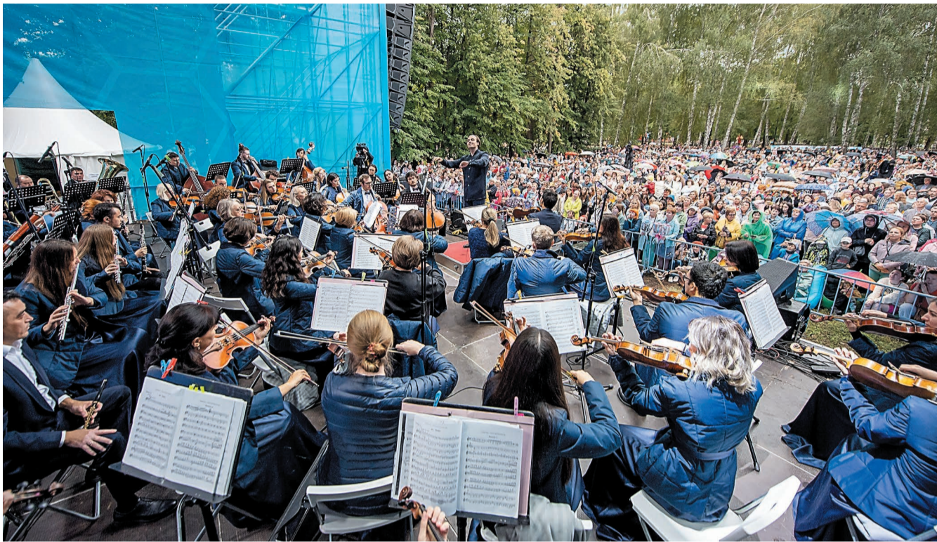
Праздничный концерт в парке госоркестр открыл увертюрой к опере «Салават Юлаев»

24 августа в городском парке культуры стартовало масштабное торжество, посвященное 75-летию Салавата и ООО «Газпром нефтехим Салават». Несмотря на пасмурную погоду, дети, взрослые, вооружившись зонтиками и дождевиками, пришли на праздник задолго до его начала. Вечер подарил всем незабываемые эмоции.