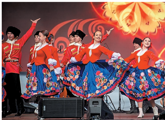
Яркие номера подарили участники фестиваля «Факел» из Оренбурга и Уфы