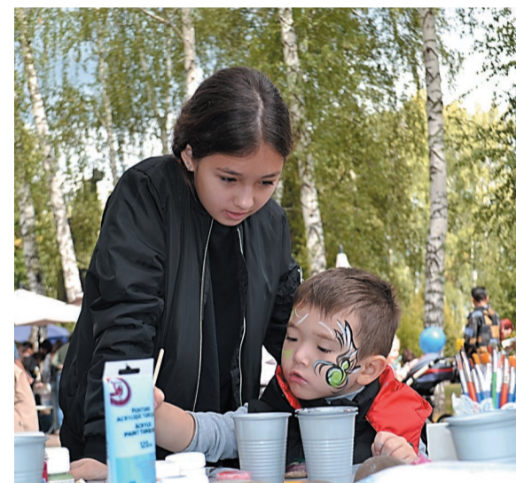
Дети с удовольствием участвовали в мастер-классах