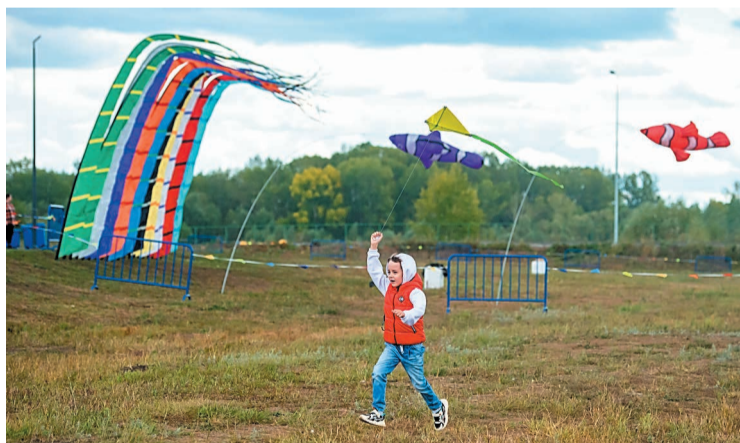
Фестиваль воздушных змеев прошел на набережной