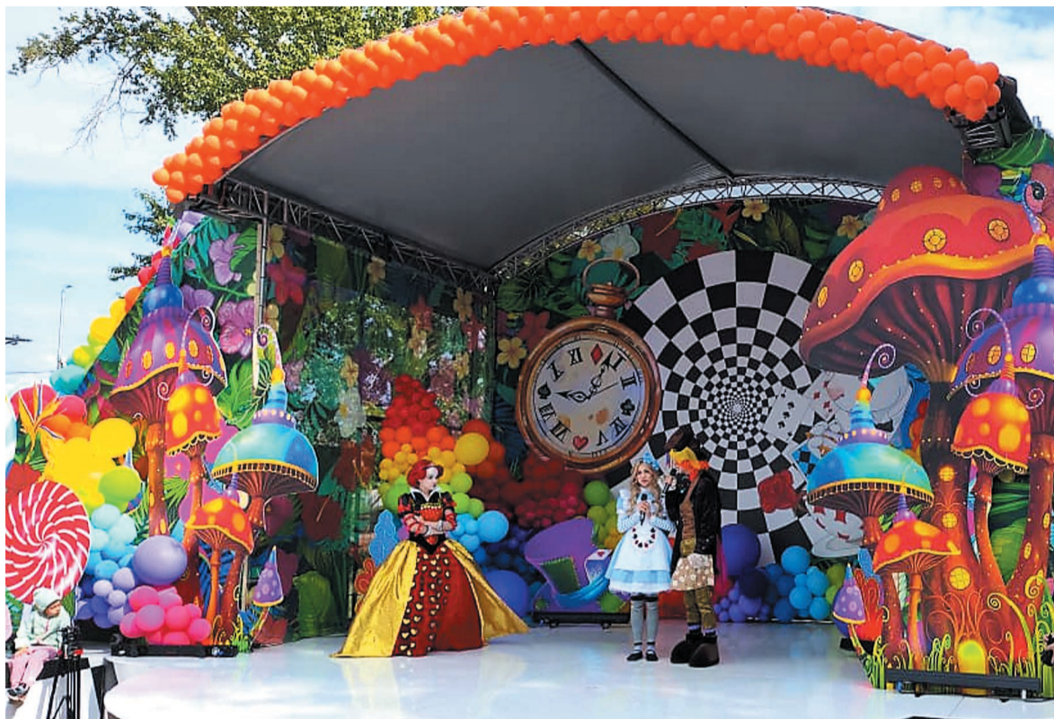
Для маленьких зрителей рядом с озером была сооружена красивая детская сцена