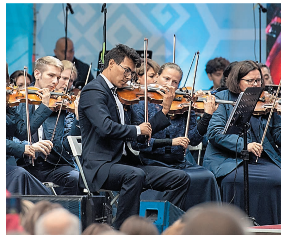
После каждой композиции звучали овации и крики «Браво!»