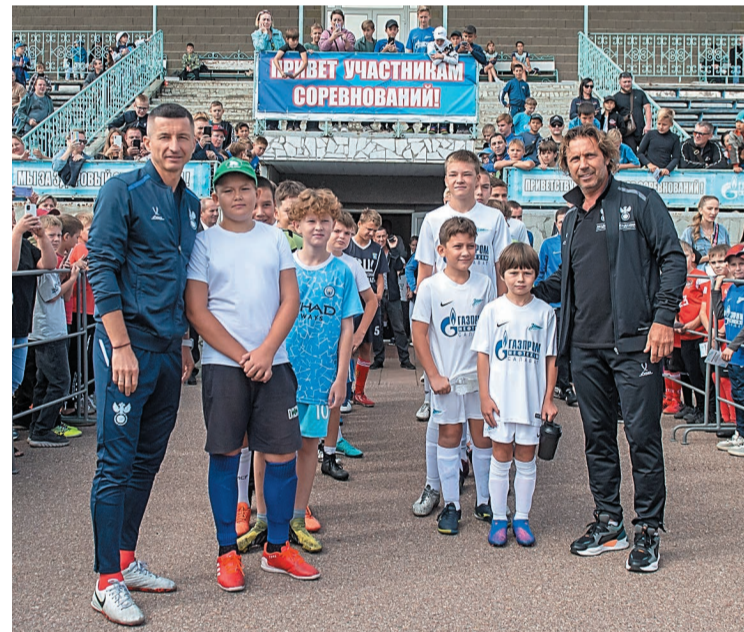
Евгений Алдонин и Александр Мостовой с юными салаватскими футболистами

Евгения Медведева оценила показательное выступление воспитанниц отделения фигурного катания компании «Салаватинвест».