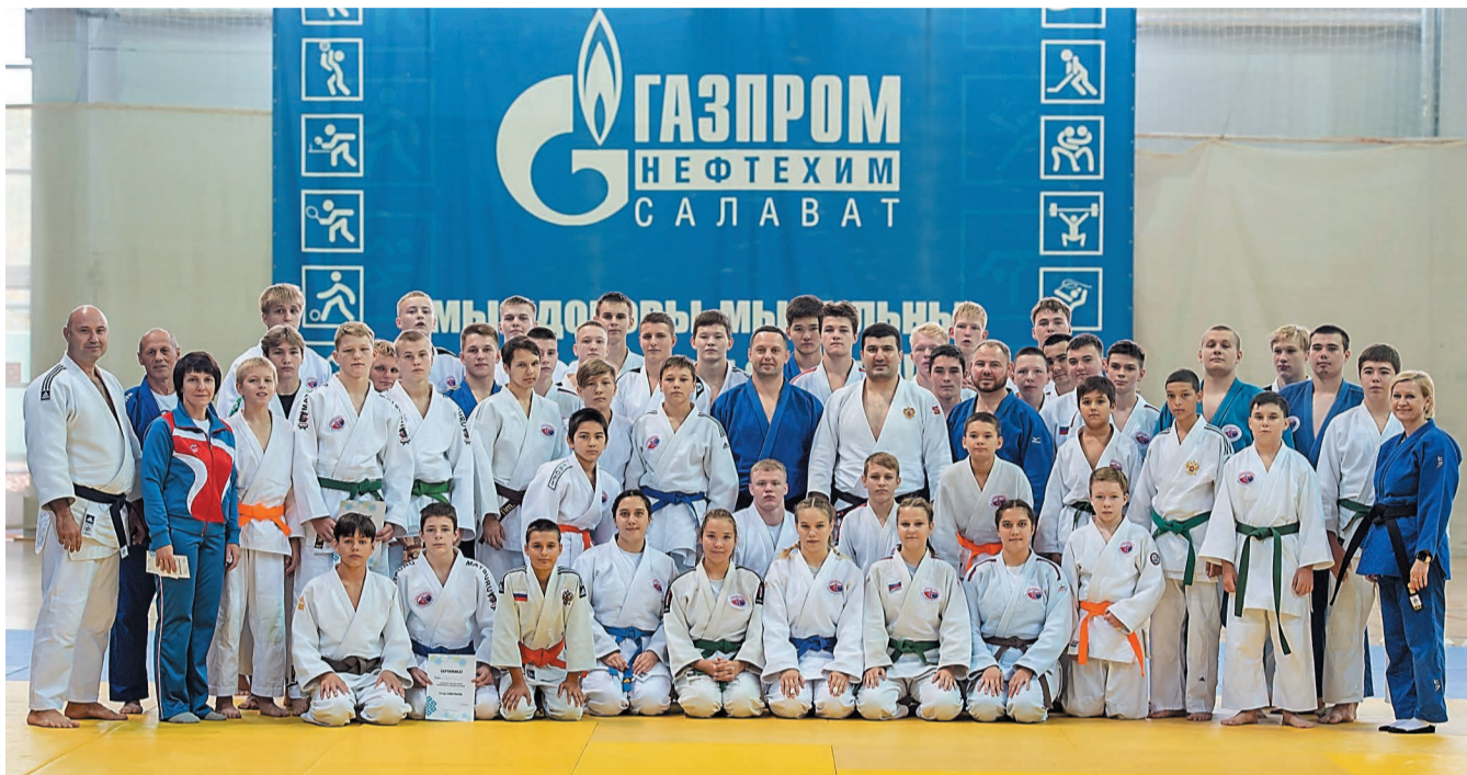
Фото на память с олимпийским чемпионом по дзюдо Тагиром Хайбулаевым

– Мы старались, чтобы детям было интересно – и разминочная часть, и сама игра. Чтобы они макси-