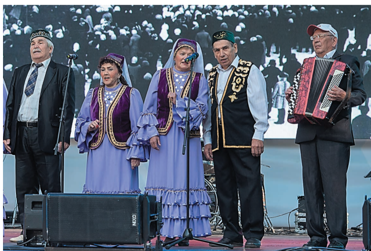
Ветераны компании подготовили к празднику свои творческие подарки