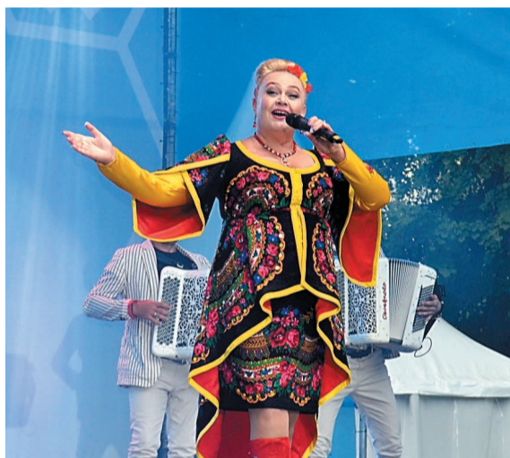
На сцене – заслуженная артистка РФ, прима Оренбургской филармонии Юлия Учватова