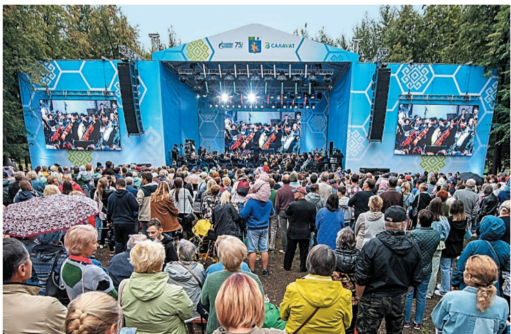
К юбилею в парке была установлена современная сцена с большими экранами