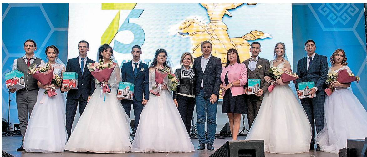
На главной сцене парка чествовали молодоженов