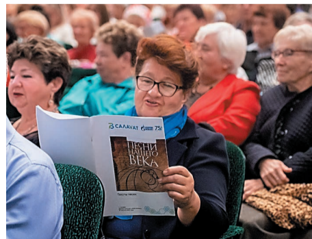
Зрители с удовольствием подпевают исполнителям