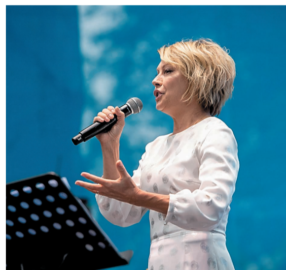
Салаватцы с радостью встречали Алену Бабенко