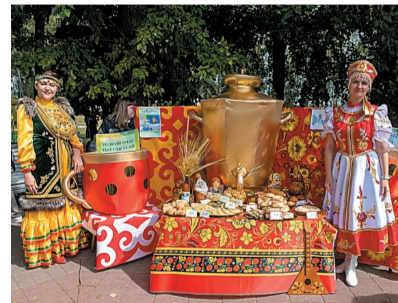
Праздник цветов в этом году был посвящен юбилею