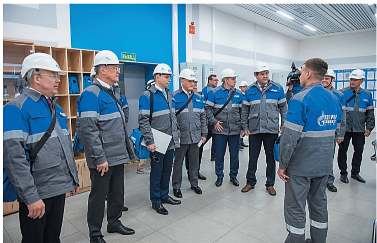
Почетные гости в операторной комплекса каталитического крекинга