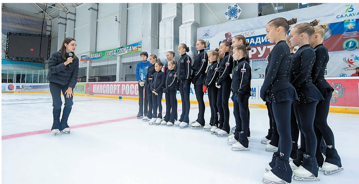
Наставником маленьких фигуристок в этот день стала Евгения Медведева