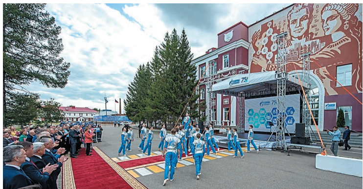
Выступает заслуженный коллектив народного творчества РФ ансамбль танца «Агидель»