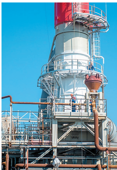
На печи строящейся установки производства водорода идут антикоррозионные работы