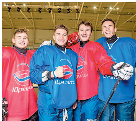
«Юрматы-СКА» впервые выступят в ЮХЛ

В этом сезоне команда «Юрматы-СКА» наделала шуму в хоккейной жизни города и республики. Подопечные ООО «Агидель-Спутник» впервые выступят в юниорской хоккейной лиге (ЮХЛ). Юрматинцам 2001-2002 годов рождения выпал шанс, которого не было у их предшественников.