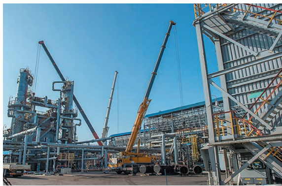
На ГО-2 идет разборка теплообменного оборудования