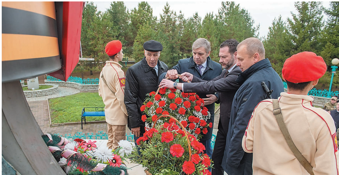
Почетные гости возложили цветы к мемориалу воинов, погибших в период Великой Отечественной войны

На территории комплекса «Земля Юрматы» прошло торжественное мероприятие, посвященное 20-летию юбилею мемориала. Аналогов этого уникального места в Башкортостане нет.