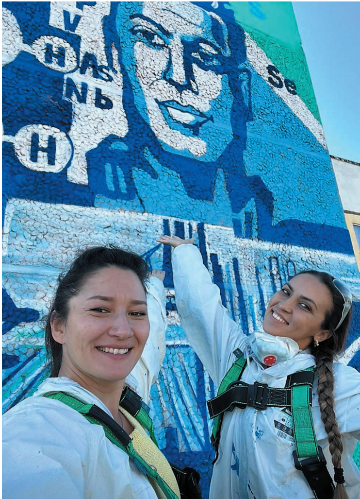
Чтобы художницы могли нарисовать огромный мурал, автовышка поднимала их на почти 30-метровую высоту.