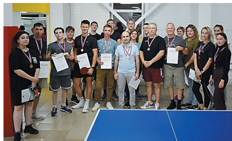
Команда Управления главного метролога

В компании прошли соревнования по настольному теннису между работниками газохимического завода и Управления главного метролога.