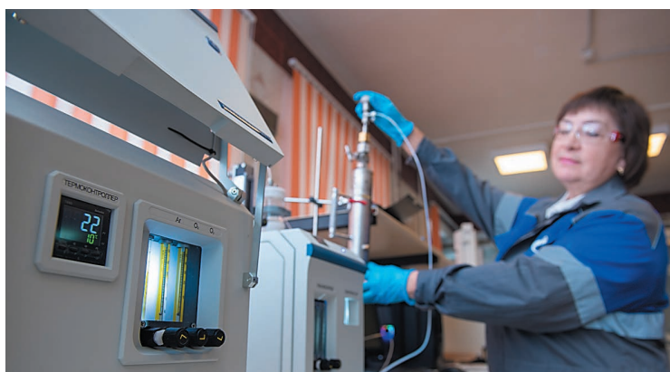
Исследования проводятся на анализаторе для определения содержания серы СПЕКТРОСКАН (г. Санкт-Петербург)