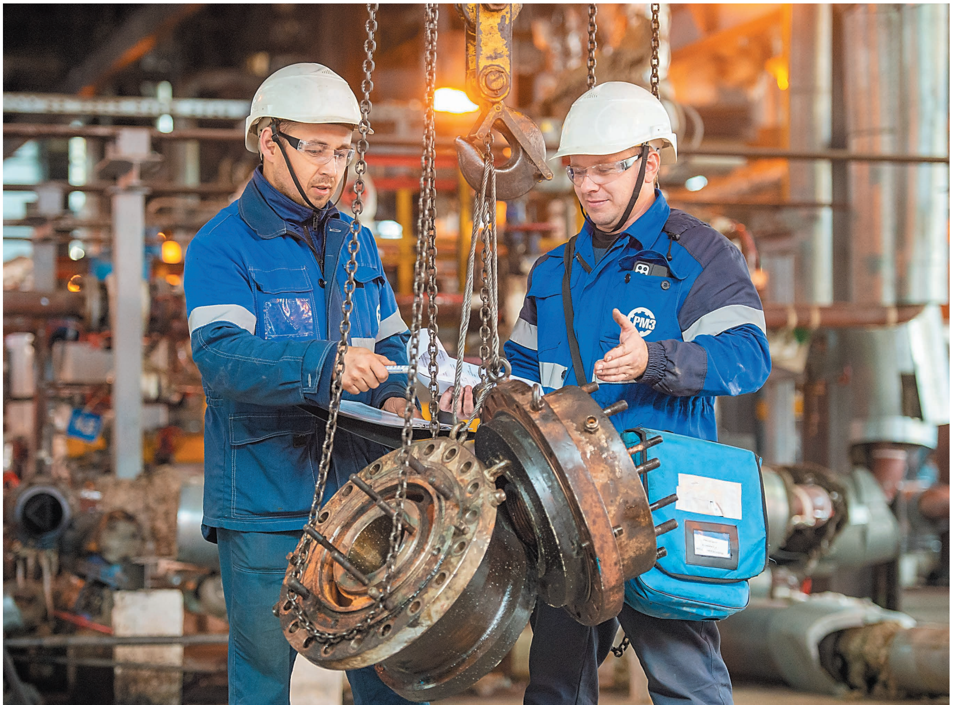
На установке ЭЛОУ АВТ-6. Идет погрузка насосов для отправки на ремонтно-механический завод

НА НЕФТЕПЕРЕРАБАТЫВАЮЩЕМ ЗАВОДЕ ЧЕТЫРЕ УСТАНОВКИ ОСТАНОВИЛИСЬ НА КАПИТАЛЬНЫЙ РЕМОНТ