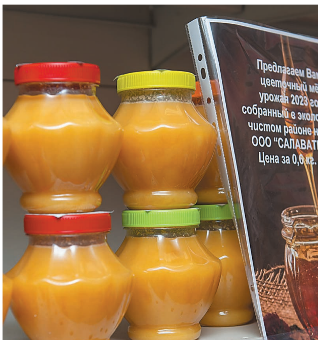
Цветочный мед обладает полезными свойствами

Осень – самое время побаловать себя вкусными продуктами. Ароматный, тягучий и невероятно вкусный башкирский мед – визитная карточка нашей республики. Туристы, приезжающие в Башкирию, стараются увезти с собой это сладкое угощение. ООО «Салаватинвест» получает на собственной пасеке натуральный цветочный мед. Пчеловодное хозяйство расположено в экологически чистом месте – в Ишимбайском районе. На вкус мед очень нежный, послевкусие – продолжительное, чувствуется приятный травяной привкус. Дегустация про-