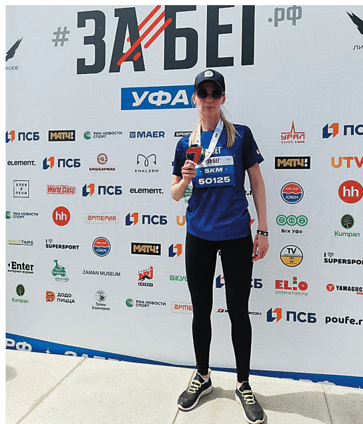
Врач и сама занимается спортом, регулярно тренируется, участвует в соревнованиях бегунов

Бег – это популярная и удобная форма физической активности, которая существенно влияет на долголетие человека. Регулярные занятия бегом укрепляют стенки сердечных сосудов, нормализуют уровень артериального давления, делают легкие сильнее. Таким образом, риск возникновения заболеваний, связанных с сердцем, заметно снижается. За счет тренировок на открытом воздухе происходит закаливание организма, укрепление иммунитета. Бег активизирует все группы мышц, развивает мускулатуру ног, рук, ягодиц и пр. Считается, что бег на регулярной основе способен укрепить мышечный скелет, сделать человека более сильным и выносливым.