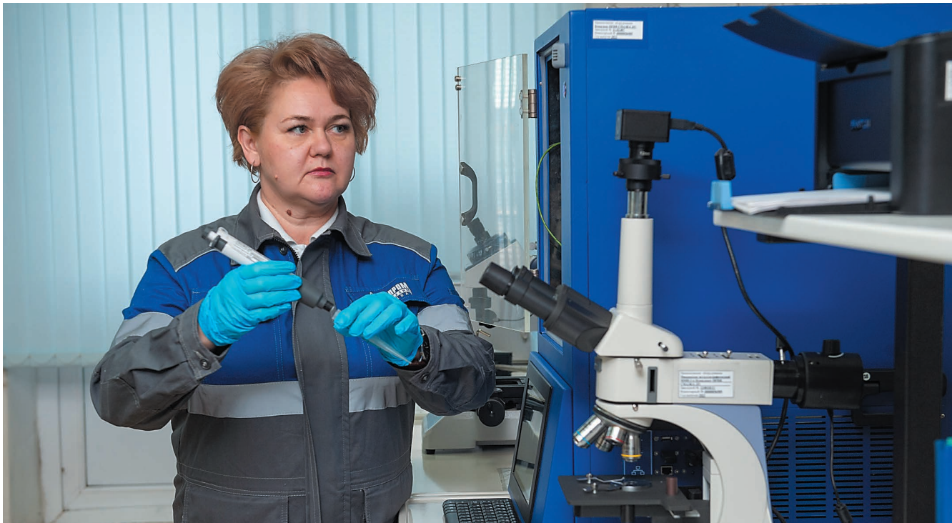
На балансе ЛАУ – Комплекс для определения смазывающей способности дизельных топлив (Республика Беларусь)

От расходных материалов до сложного аналитического оборудования – таков диапазон работы сотрудников Лабораторно-аналитического управления (ЛАУ) по подбору российских аналогов в рамках программы по импортозамещению.