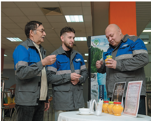
Нефтехимики оценили вкус ароматного меда

В столовой №12 прошла дегустация цветочного меда. Вкусное лакомство собрано с пасеки ООО «Салаватинвест». Можно было попробовать и заодно приобрести баночку меда.