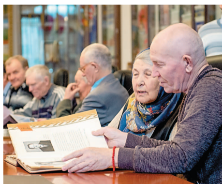
Более десятка встреч ветеранов НПЗ прошло в музее трудовой славы