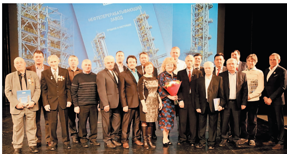
Над книгой работала большая команда единомышленников, тех, кому есть что вспомнить и чем гордиться