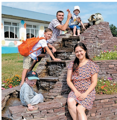
В «Спутник» — всей семьей!