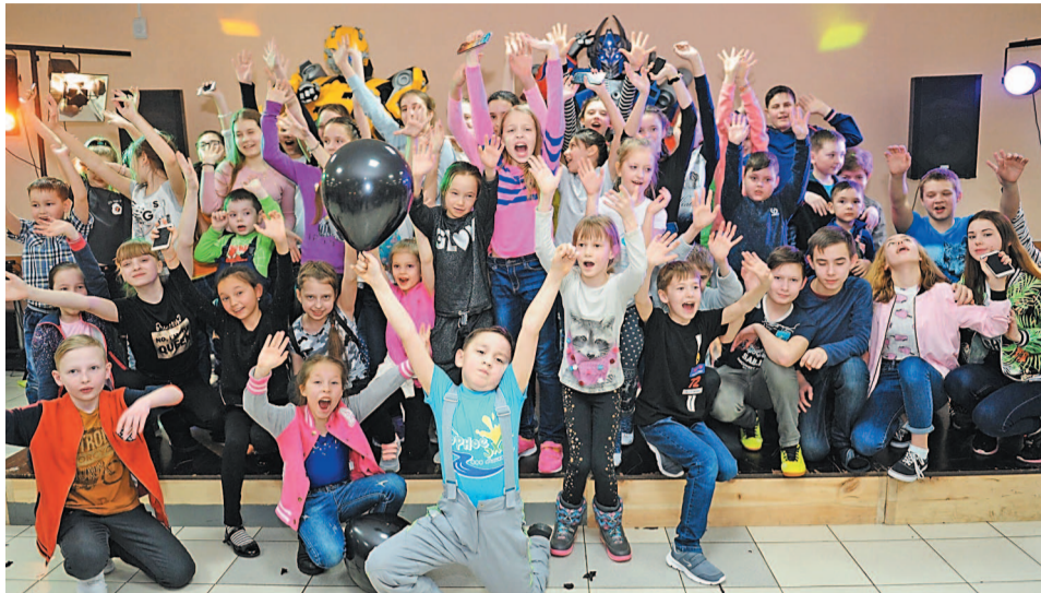
Яркие эмоции останутся в памяти надолго

— Было очень много просьб и заявок провести заезд такого характера. И мы, естественно, сразу откликнулись. Данная семейная смена будет проводиться по окончании третьей летней детской смены с 15 по 21 августа, целую неделю. Мы уже разработали программу отдыха и развлечений специально для этого заезда. Параллельно хотим запустить четвертую детскую смену «Спутник» — детский отель 5 звезд, которая будет длиться 10 дней. Я думаю, название говорит за себя, какой сервис и какие программы ожидают детей.