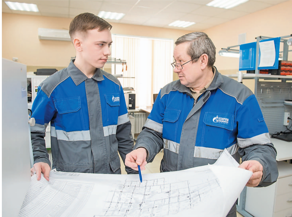
Перед обходом территории следует изучить схему расположения беспроводных датчиков

В компании «Газпром нефтехим Салават» смонтированы 140 преобразователей давления, температуры и дискретного сигнала. Особенностью нового метрологического оборудования является то, что оно беспроводное. Передача технологических параметров происходит посредством ряда сложных и уникальных процедур на экраны рабочих станций клиентов PI-system.