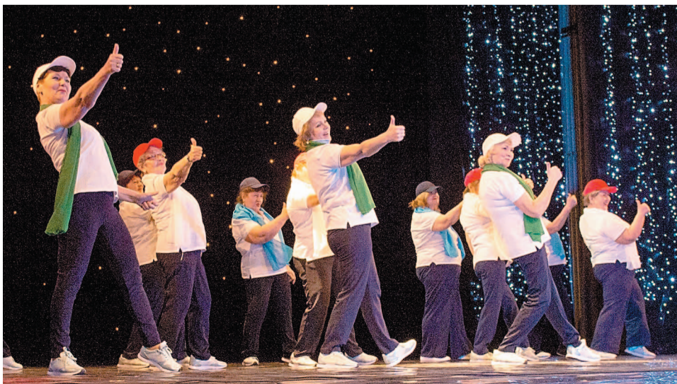
Старания популярного ансамбля «Зажигалочки» увенчались успехом, их танец зрители встретили овациями

100-летию образования Республики Башкортостан посвятили праздничный концерт участники художественной самодеятельности Совета ветеранов войны и труда компании. Более 400 зрителей подпевали артистам.