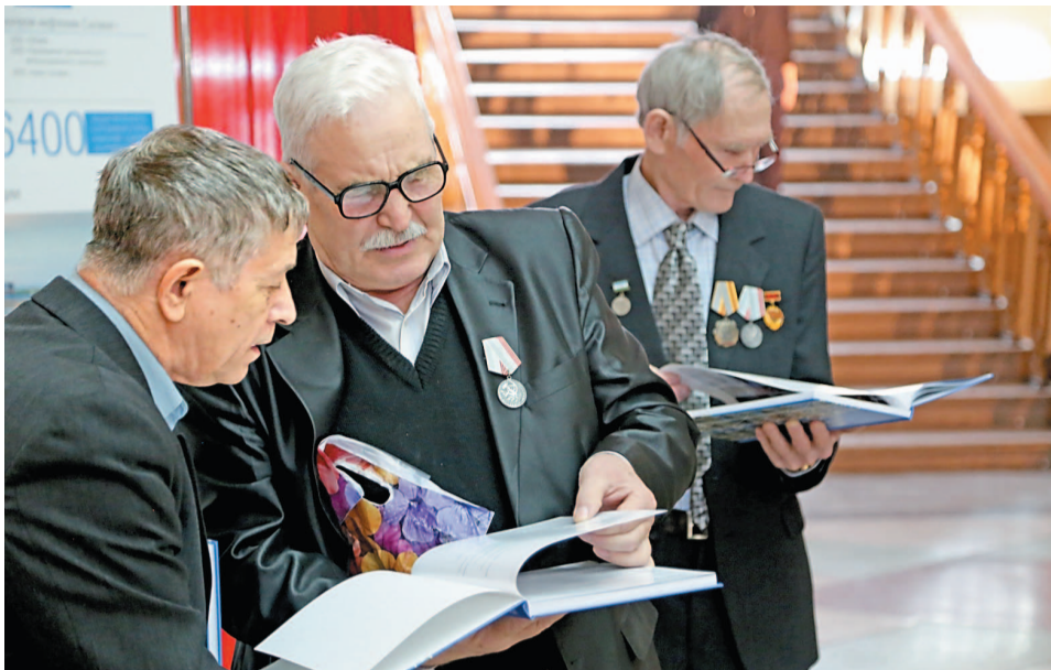
Получив в подарок книгу, ветераны и сотрудники тут же с интересом просматривали ее