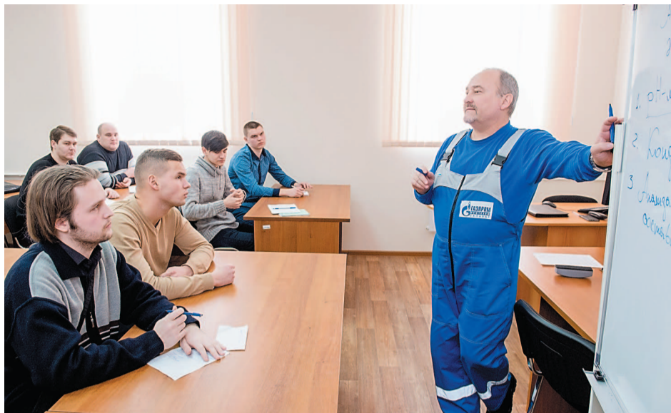
Сотрудников обучают опытные работники компании, прошедшие педагогическую подготовку