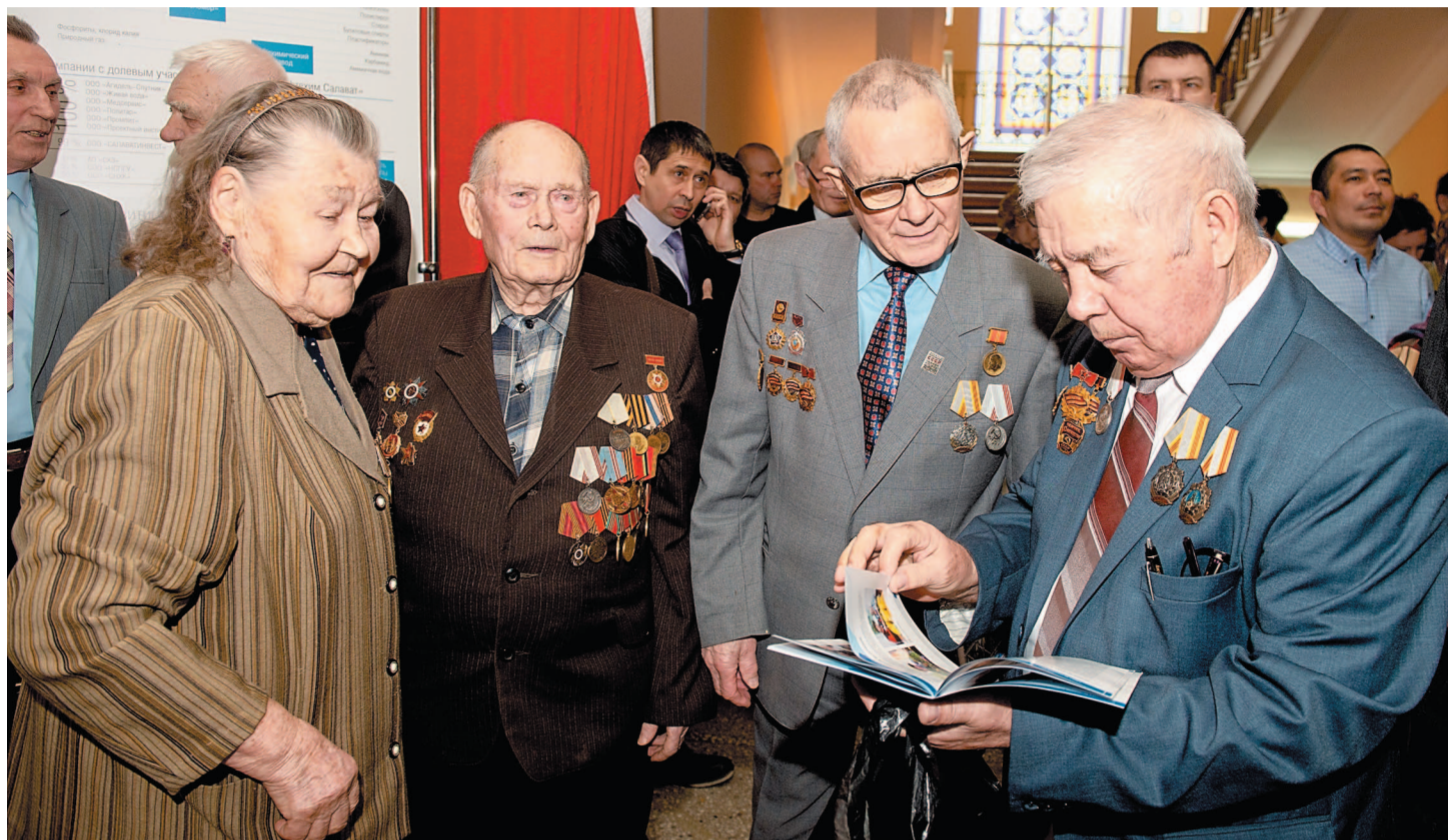
Среди приглашенных на презентацию было немало орденосцев. На НПЗ их 92. Намного больше, чем на других заводах