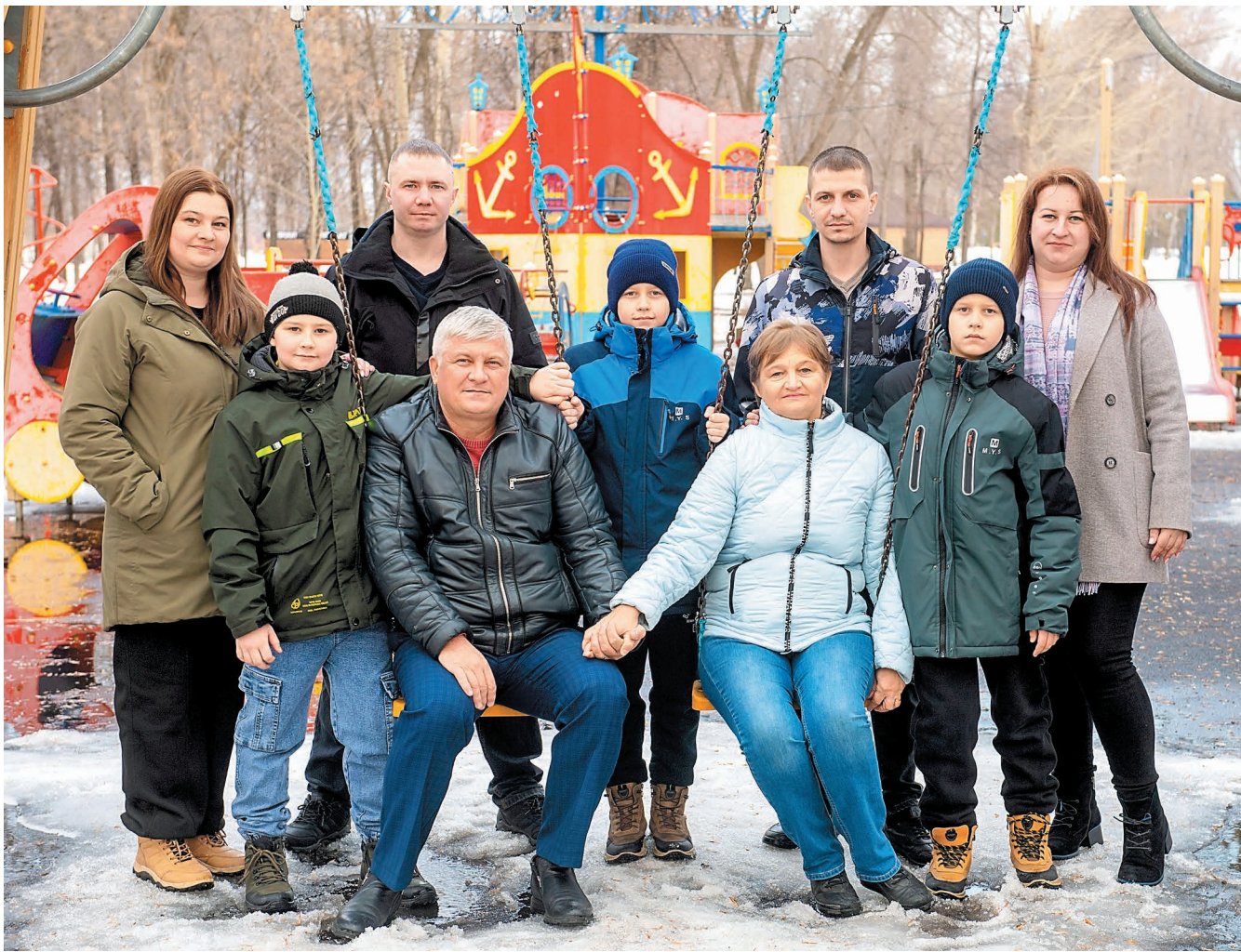
Младшие Губачевы считают, что быть представителями династии — двойная ответственность. Надо держать ответ не только перед коллегами, но и, прежде всего, перед семьей