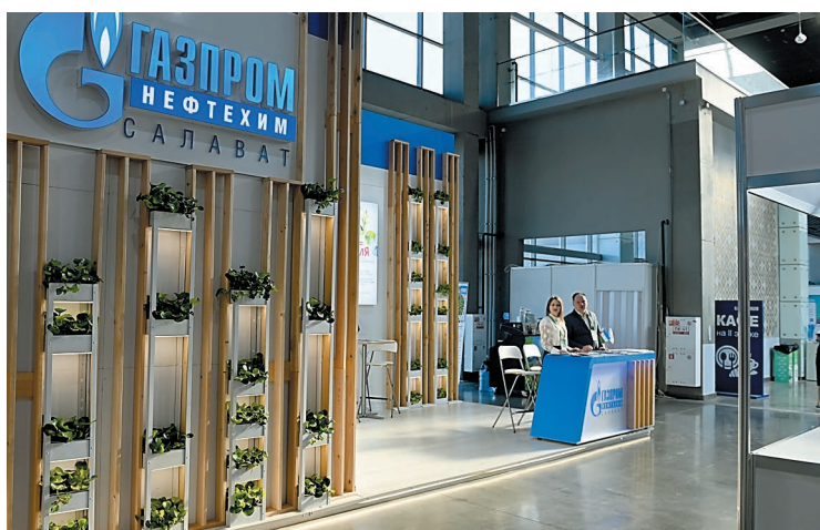
Стенд компании «Газпром нефтехим Салават»