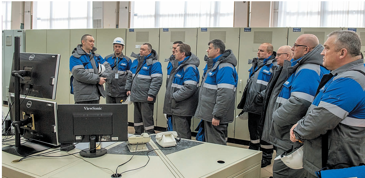
Участники совещания на экскурсии по предприятию

3-4 апреля на производственной площадке компании «Газпром нефтехим Салават» прошло совещание по вопросам подбора аналогов российских контрольно-измерительных приборов и поточного аналитического оборудования для объектов переработки углеводородного сырья.