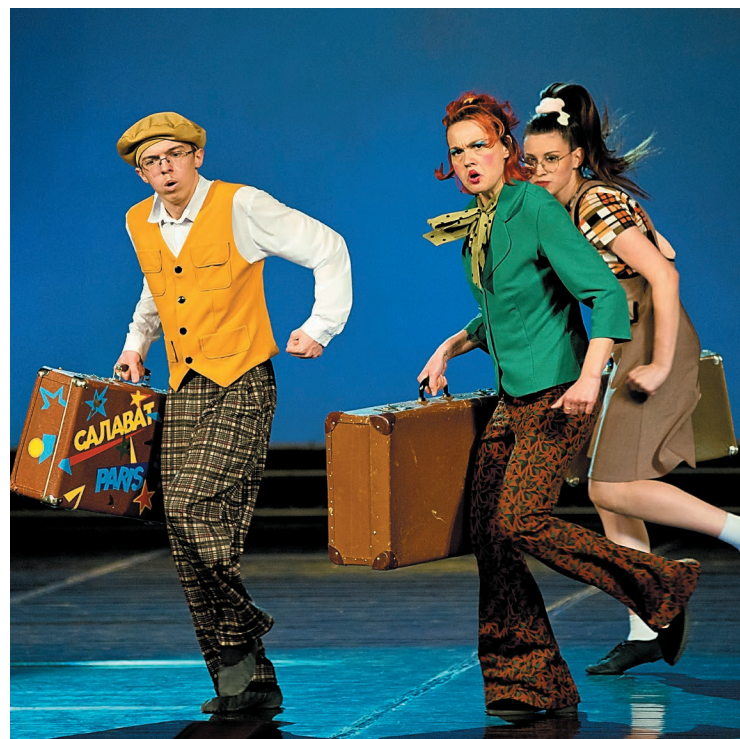
Участники «Пигмалиона» подарили зрителям незабываемые эмоции