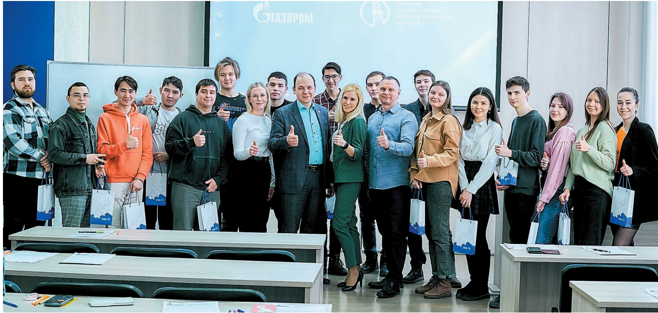
Участники студенческой олимпиады ПАО «Газпром» по профилю «Энергоресурсосберегающие технологии» в Уфе

Представители компании «Газпром нефтехим Салават» приняли участие в заключительном туре межотраслевой олимпиады ПАО «Газпром».