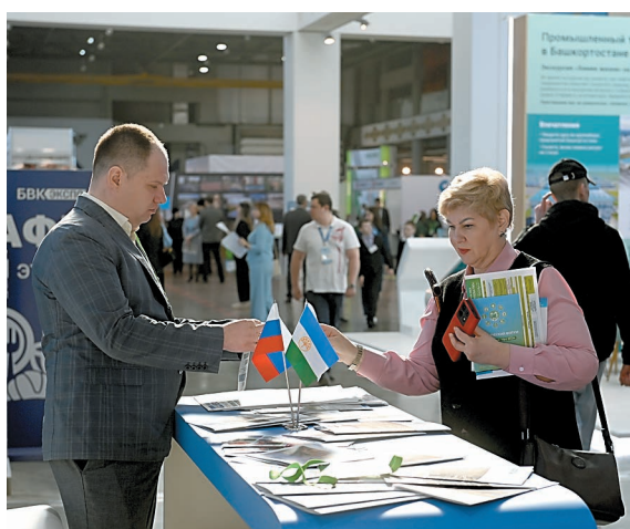
Во время работы выставки