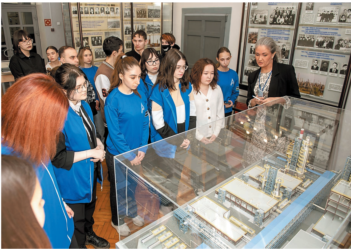
Участники чемпионата знакомятся с музеем трудовой славы ООО «Газпром нефтехим Салават»

В рамках чемпионата Национального центра «Абилимпикс» подростки с ограниченными возможностями познакомились с историей и деятельностью компании «Газпром нефтехим Салават».