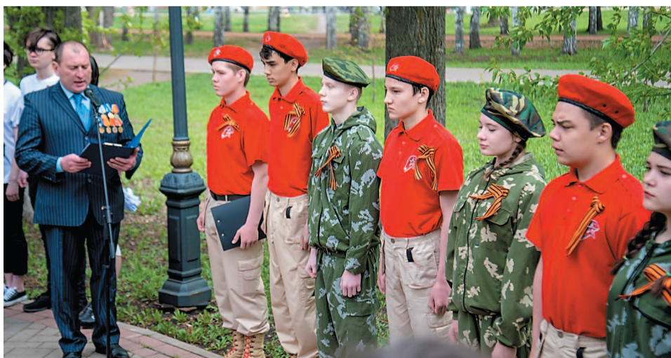
Юнармейцы поздравили ветеранов с праздником Великой Победы и дали слово быть достойными памяти великих предков