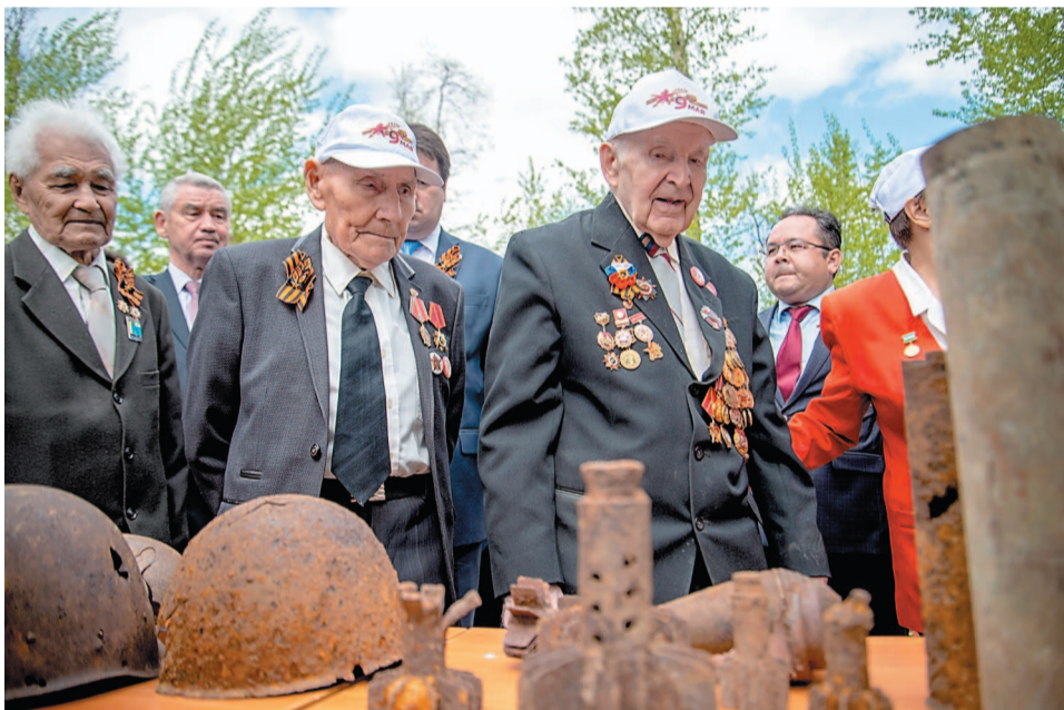
Ветеранам представили выставку экспонатов военного времени

С этого года все торжественные мероприятия в городе, посвященные празднованию 9 Мая, будут начинаться в городском парке культуры и отдыха у «Капсулы времени». С такой инициативой выступили ветераны Великой Отечественной войны, на митинге 7 мая это решение было поддержано официально.