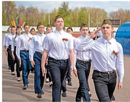
350 юных салаватцев соревновались в смотре строя и песни

7 мая на стадионе им. 50-летия Октября 18 команд, представляющих школы Салавата, демонстрировали навыки строевого марша, песни и чет-