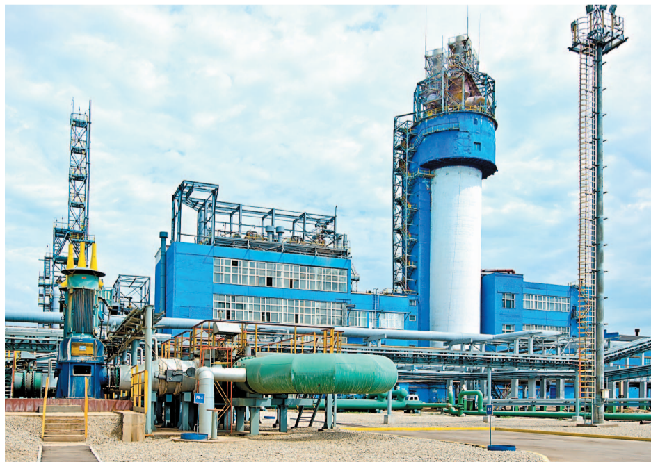
Во время ремонта персоналу ГХЗ предстоит выполнить работы по замене отбракованных участков и испытанию оборудования, ремонту статического и динамического оборудования

Проведенные работы позволят повысить эксплуатационную надежность работы производств, устранить проблемы по узким местам в работе производств аммиака и карбамида.