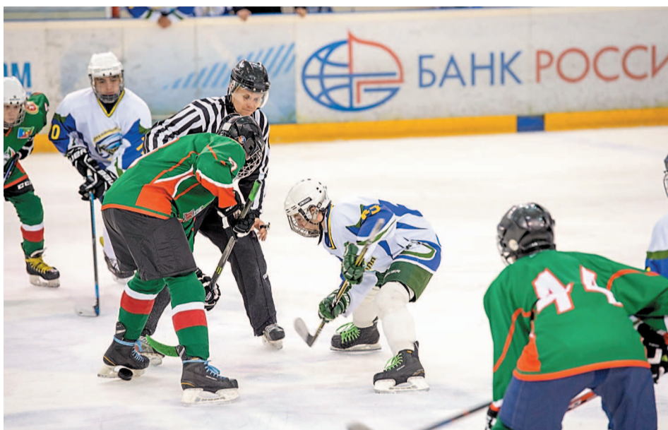
Ледовая арена СКК «Салават» стала хорошей площадкой для всероссийских турниров

В авангарде по традиции и пловцы компании «Агидель-Спутник». Они регулярно «заплывают» на различные пьедесталы почета. Начиная от соревнований республиканского уровня, где иногда их просто сложно сосчитать, до самых значительных высот. Так, на Чемпионате России по плава-