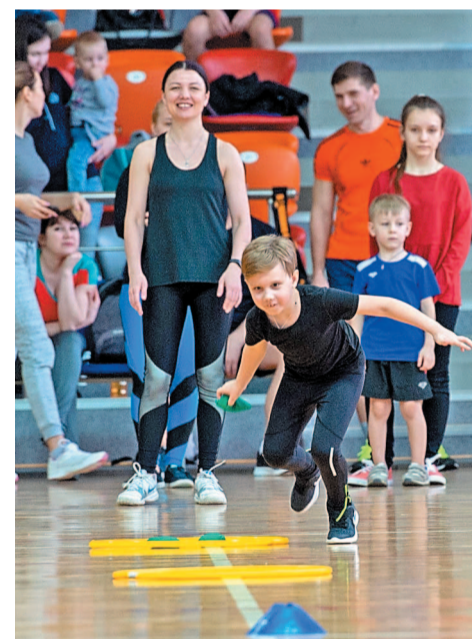
Число участников семейных стартов растет из года в год

– Многие нефтехимики, горожане вносят свой вклад в развитие физкультуры и спорта. Каждый, кто приходит в спортивный зал, в зал фитнеса, выходит на лед, на зеленый газон или ныряет в воду, – все они олицетворяют здоровую нацию, здоровое и спортивное поколение. А их немало! Более тысячи детей сегодня занимается на спортивных площадках, столько же взрослых идут за здоровьем в спортивные залы. Только за полгода спортивные объекты компании «Агидель-Спутник» приняли более 70 различных соревнований. Всероссийских, региональных, корпоративных... Цифра просто потрясающая с учетом того, что в среднем каждую неделю проходит более двух соревнований, т.е. сотрудники компании постоянно работают в напряженном ритме. Поздравляю всех профессионалов и любителей спорта с праздником! Счастья, удачи и новых побед!